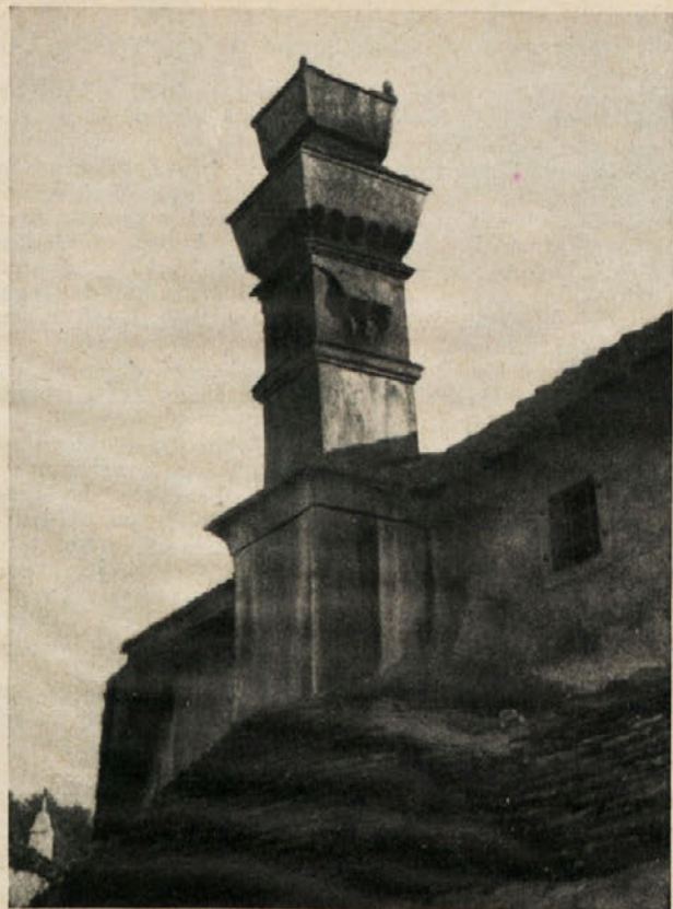
Svojevrsten dimnik na kraški domačiji.

Za Kranjca je to nov svet, svojski po obliki in življenju, vendar slovenski. Mogoče še bolj zavestno slovenski, ker je borben in vztrajen.