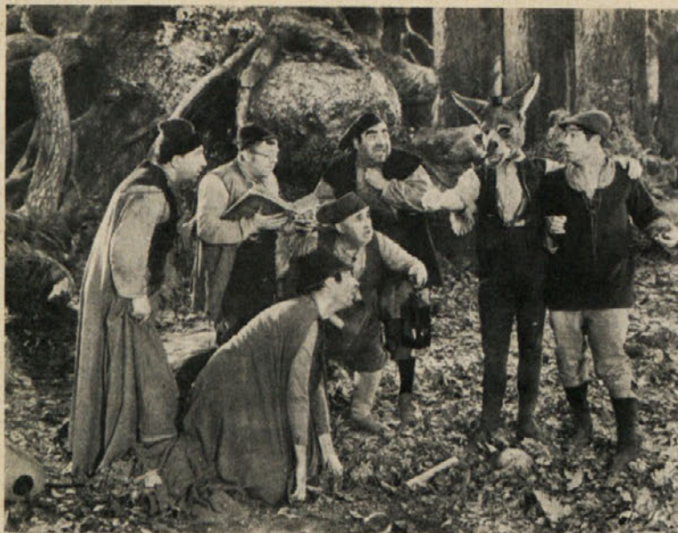
Atenski rokodelčiči se s Klobčičem dogovarjajo za igro pred kraljevim dvorom.

biti razglašen za prestolonaslednika, ker sem bil kraljičin prvorojenec, z naslovom princa Waleškega, potem pa biti vladar z imenom in naslovom.