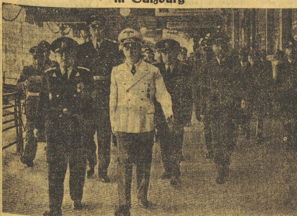
Kürzlich empfing Reichsaußenminister von Ribbentrop auf dem Bahnhof in Salzburg den königlich rumänischen Ministerpräsidenten Gigurtu und Außenminister Manoilescu. — Das Bild zeigt links Ministerpräsident Gigurtu und Reichsaußenminister von Ribbentrop, dahinter den Chef des Protokolls, von Dornberg, und Außenminister Manoilescu.