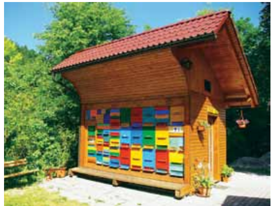
Čebelnjak, v katerem poteka spremljanje donosov danes

Opazovalna postaja v lški vasi je na taki geografski točki, da zbira podatke o medenju na južnem in severnem pobočju Krima do vrha, v Gornjem Igu, soteski lške do roba Mokrcia, na območju lške vasi do nižinskega gozda ob vasi Kot pri Igu ter na bližnjih pašnih površinah v okolici lške vasi. Vsa območja so registrirana v pašnem katastru občine Ig. Z izjemo Krima, kamor je treba vodo dovažati, je povsod drugod dovolj čiste sveže vode.