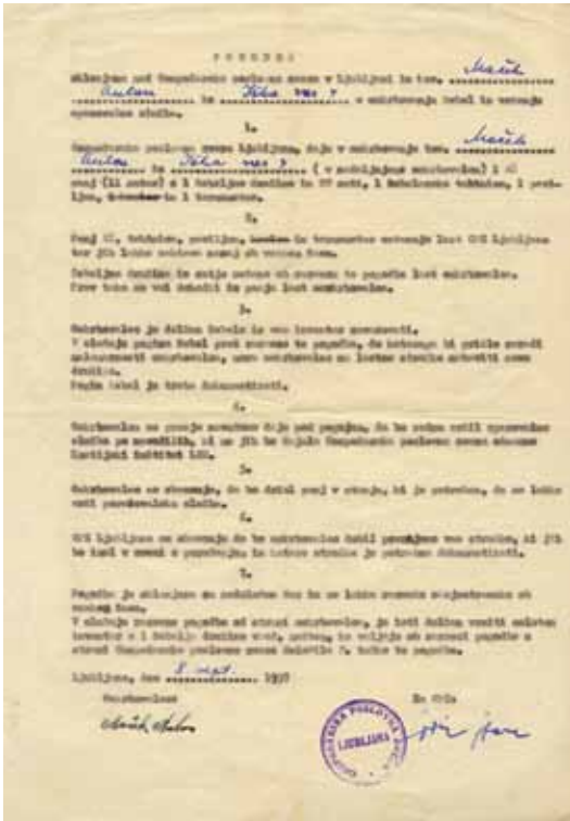
Originalna pogodba o oskrbovanju čebel in izvajanju opazovalne službe iz leta 1957