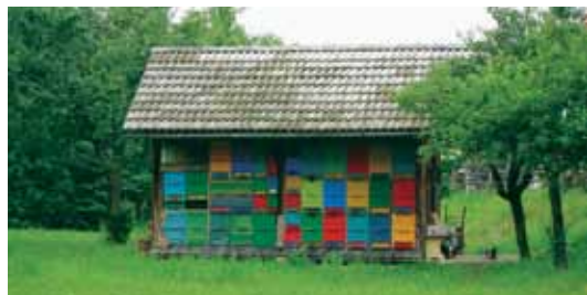
Razširjeni čebelnjak z dvema tehnicama