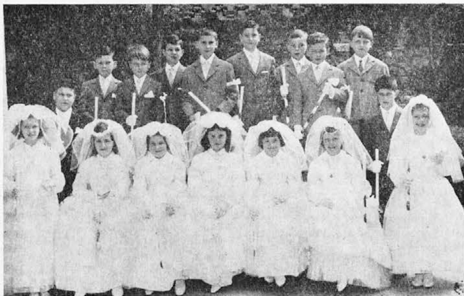
Sedemnajst letošnjih slovenskih prvoobhajancev in prvoobhajank iz Barčovelj