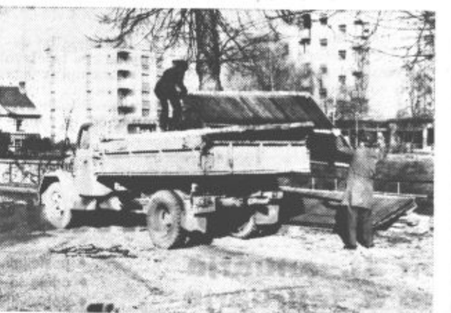
Prve priprave pri gradnji trgovske hiše v Soštanju

Nova trgovina bo imela približno 1.000 kvadratnih metrov prodajnih površin. V pritličju (hiša bo enonadstropna) bo samopostrežna trgovina z zelo široko izbiro. Prodajali bodo živila, gospodinjstva potrebščine, sadje, zelenjavo, kruh, slaščice, delicatno blago in sveže meso. Poleg tega bo v pritličju še bife s kuhinjo, kjer bodo pripravljali tople malice. V nadstropju bo na izbiro tekstilno ter drugo industrijsko blago.