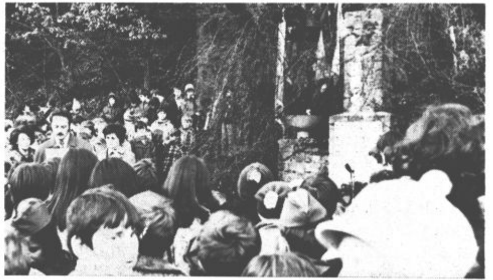
Mladina in drugi prebivalci Velenja so pretekli četrtek pred spomenikom talcev v starem Velenju počastili spomin na petnajst talcev, ki so jih Nemci ustrelili na tem prostoru 25. januarja leta 1944. V začetku januarja pred tridesetimi leti so partizani izvedli nekaj svaričnih obsodb nad izdajalci. To je zelo preplašilo Nemce, ki so iz mariborskih zaporov pripeljali petnajst talcev ter jih ustrelili z namenom, da bi prestrašili ljudi, ki so bili povezani z osvobodilnim gibanjem. Vendar njihov poskus ni uspel.

1. februar 1974 • Leto X., št. 4 (213) • Cena 1 dinar • Poština plačana v gotovini