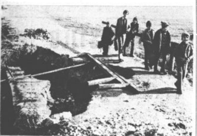
Lanske poplave so povzročile precej škode v Šaleški dolini. Priznanesle niso tudi mostu čez Toplico v Soštanju, ki je še e danes nepopravljene. Le kdaj bo popravljen, se sprašujejo ljudje, ki so ga do poplav uporabljali.

Na bližnjem občnem zboru bodo pregledali dosedanje dejavnosti slovenjgraških sindikatov. Razpravljali bodo tudi o analizi o samoupravljanju, ki so jo pripravili na osnovi anonimne ankete, izvedene v preteklem letu med zaposlenimi v Mislinjski dolini. Ugotovitve ugotavljajo doseženo razvojno raven samoupravljanja v delovnih organizacijah, opozarjajo pa na naloge, ki čakajo družbenopolitične organizacije, pri uresničevanju II. faze ustavnih dopolnil. Spregovorili pa bodo še o prihodnji akcijski usmeritvi Zveze sindikatov v občini.