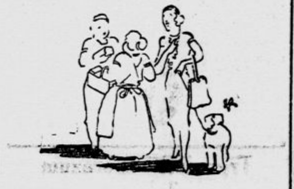
ZENE MED SEBOJ hvaljivo Mirim čokolado, ker je okusna in izdema — torej dobra in ob istem času poemi.

Ko je bil vlak ustavljen, se je nudi potnikom grozen prizor — strašna kopica razmesarjenih teles in razbitih delov voza.