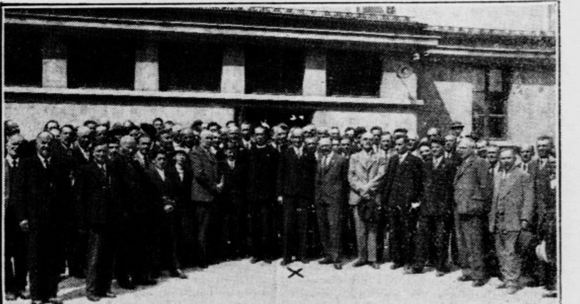
Za praznike so čebelarji iz vse države lepo proslavili 200 letnico rojstva našega prvega učnega čebelarja Antona Janše, hkrati so pa imeli velik zbor čebelarjev iz vse dravske banovine.