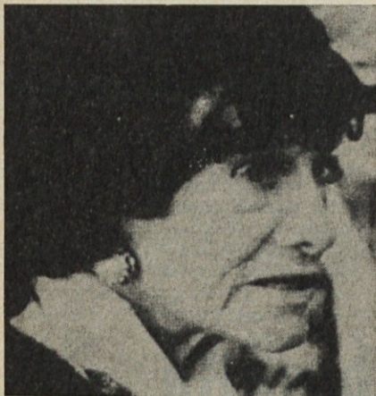
KRALJICA Z IMENOM COCO

Kako dolga vladavina! Začela se je leta 1883. Letnica se nam zdi zelo daleč. Coco Chanel je bila iz preteklega stoletja in vendar tako sodobna. 1883. tega leta se je v Moskvi car Aleksander III. s carico (oblečeno v več kot 32 kg srebrnega blaga) dal okronati za vladarja vse Rusije.