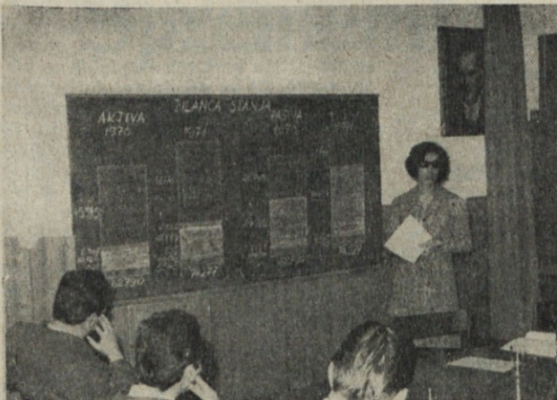
Sprejem zaključnega računa

Sestav poslovnih sredstev v ožjem smislu (osnovnih in obratnih sredstev) se v primerjavi z letom 1970 ni bistveno spremenil. Povprečno uporabljena obratna sredstva so praktično ostala na višini iz leta 1970. Razpoložljivi del rezervnih sredstev se je v letu 1971 povečal za 14 %, kar predstavlja ob-