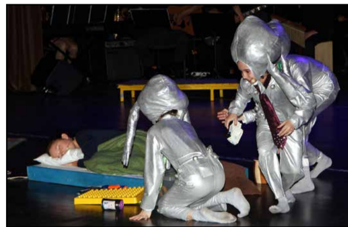
Ko je Drejček spal, so Marsovčki povzročali zmedo ...