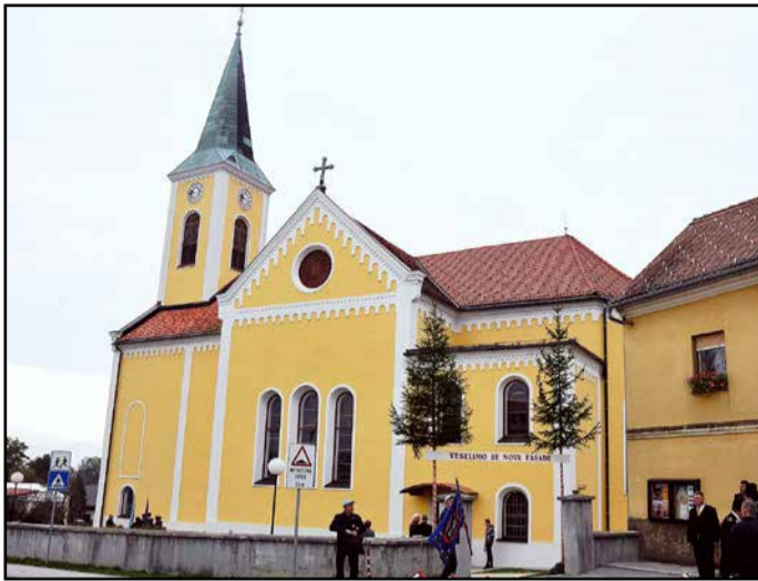
Cerkev sv. Pankracija na dan praznovanja in blagoslova fasade