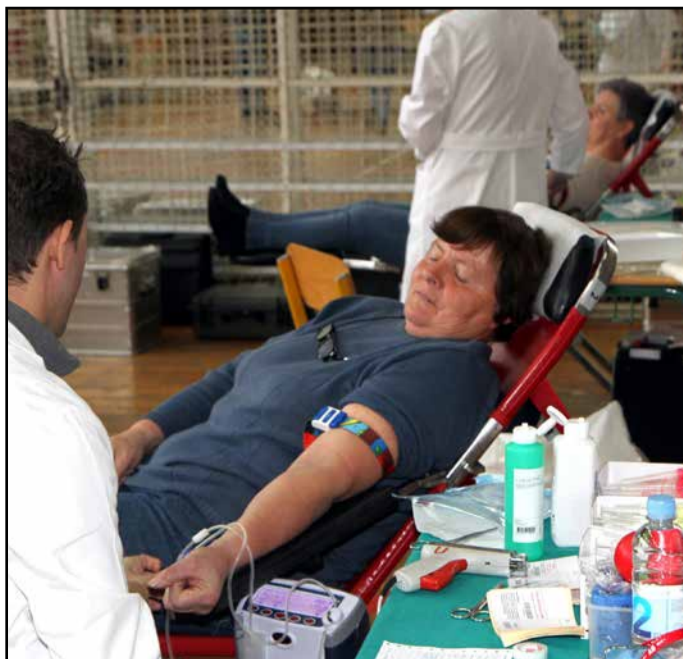
Z akcije v telovadnici žalske ljudske univerze

Naslednje leto bodo znova organizirali 10 akcij za Zavod za transfuzijo krvi Ljubljana in Transfuzijski center Celje.