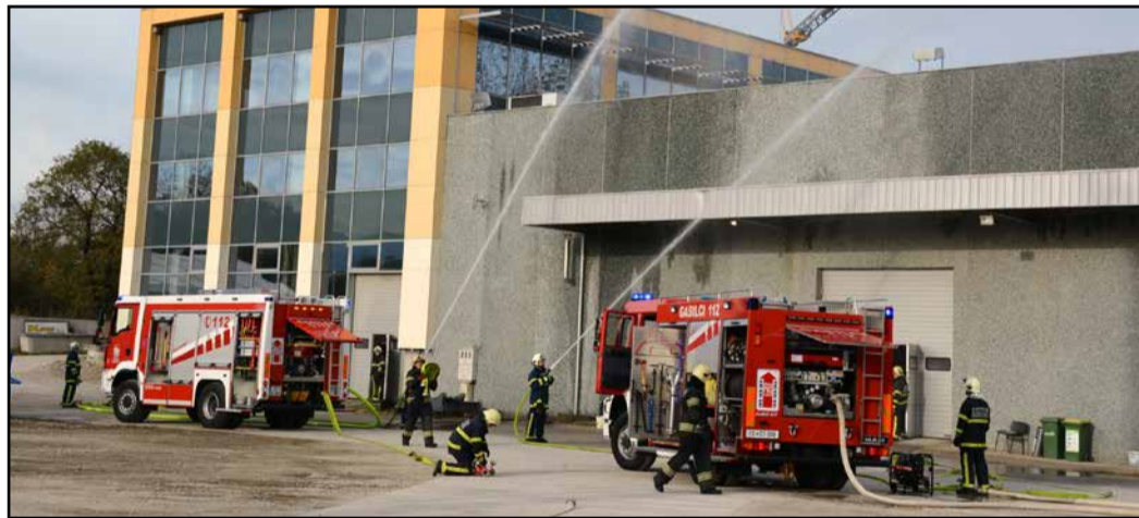
Gasilci med gašenjem objektov podjetja Ferkov

V preteklem mesecu so v preboldski občini pripravili kar nekaj gasilskih vaj. Poleg vsakoletne vaje treh vasi, ki jo organizirajo gasilska društva iz Sešč, Matk in Sv. Lovrenca, so na območju med preboldsko in trboveljsko občino izvedli tudi meddruštveno vajo PGD Prebold-Dolenja vas-Marija Reka in PGD Trbovlje mesto. Osrednjo gasilsko vajo GZ Prebold pa so letos pripravili na območju industrijske cone v Latkovi vasi, in sicer v podjetju Ferkov.