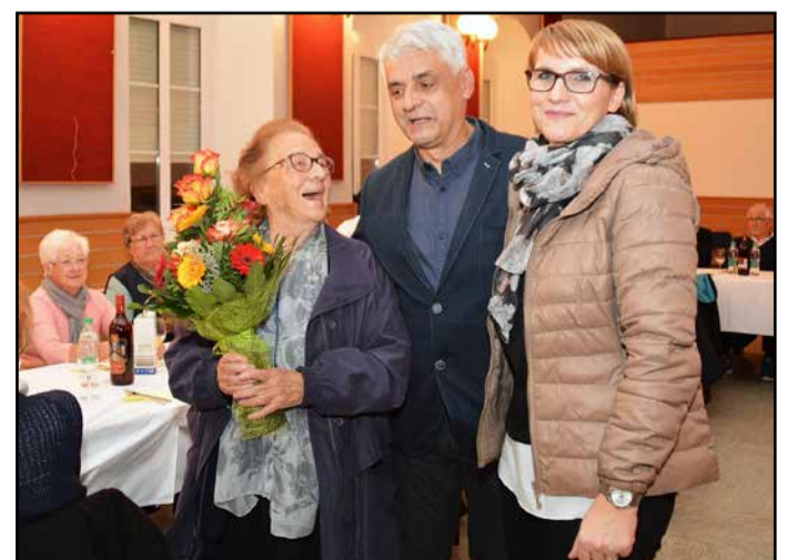
Šopek za najstarejšo krajanke