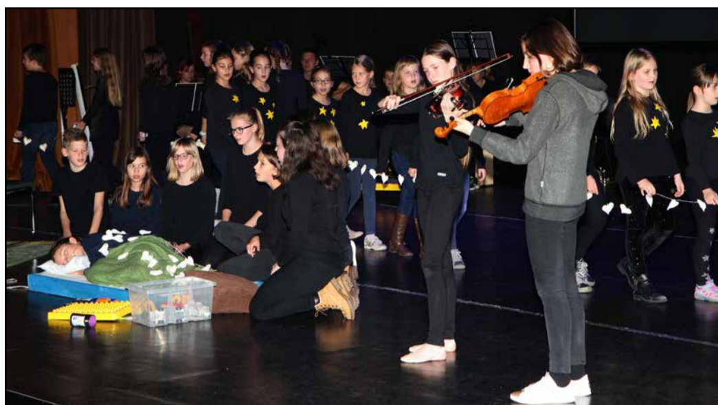
Tudi pevski zbor in šolski bend sta odlično opravila svojo nalogo.

180-letnico šolstva v Grižah pa so obeležili še z drugimi prireditvami in dogodki. Pretekli teden so v prostorih šole odprli razstavo likovnih del mladih, nagrajenih na mednarodnih razpisih revije Likovni svet na temo Etno oblačila in plesi mojega naroda. V kulturnem programu so nastopili učenci šole, razstavo pa je