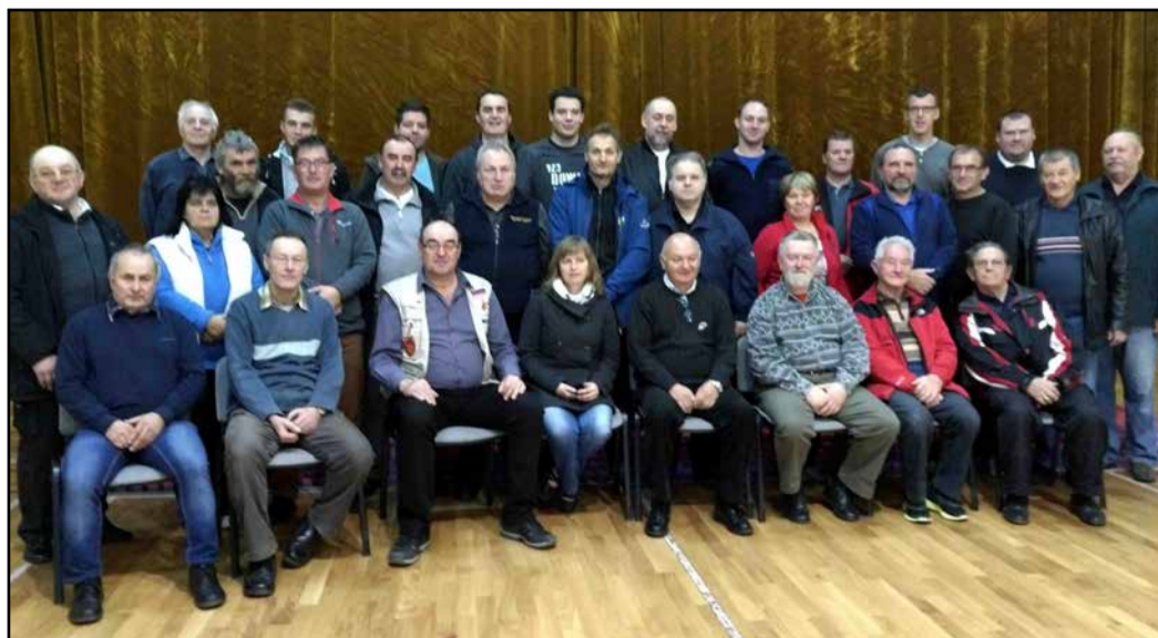
Ustanovni člani društva za ohranjanje gasilske dediščine Slovenije

V Domu krajanov Letuš je potekalo 18. srečanje zbirateljev gasilskih in drugih razstavnih predmetov. Po srečanju so se na pobudo članov iniciativnega odbora sestali tudi na ustanovnem občnem zboru Društva za ohranjanje gasilske dediščine Slovenije.