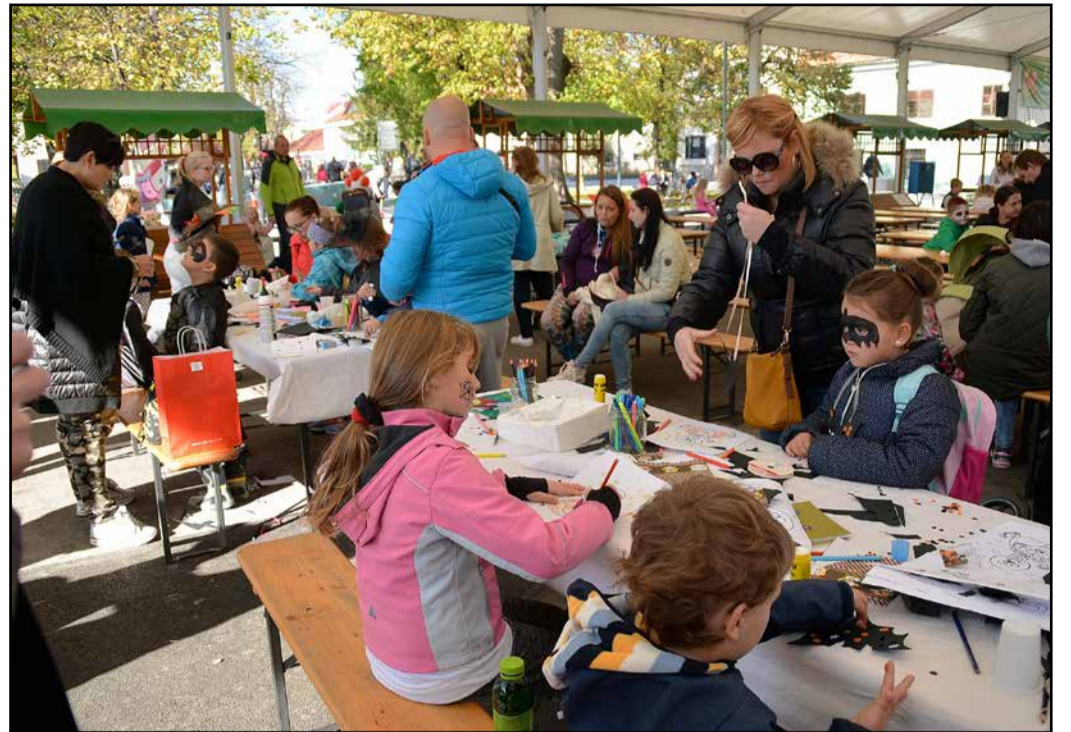
Organizatorji so na zadnji dan delovanja fontane pripravili tudi otroške delavnice.

Zadnji oktobrski dan je bil zadnji letošnji dan, ko so si obiskovalci lahko postregli s pivom na zdaj že svetovno znani Fontani piv Zeleno zlato. Hkrati so s tem sklenili letošnje dogajanje v okviru Festivala Zeleno zlato, ki je v vseh mesecih odprtja fontane postregel z vrsto prireditev. Na zadnji prireditvi, ki je bila v znamenju noči čarovnic, so organizatorji poskrbeli tudi za brezplačno pivo od 20. ure dalje. Na prireditveni ploščadi na Šlandrovem trgu pa so opoldne istega dne odprli drsališče.