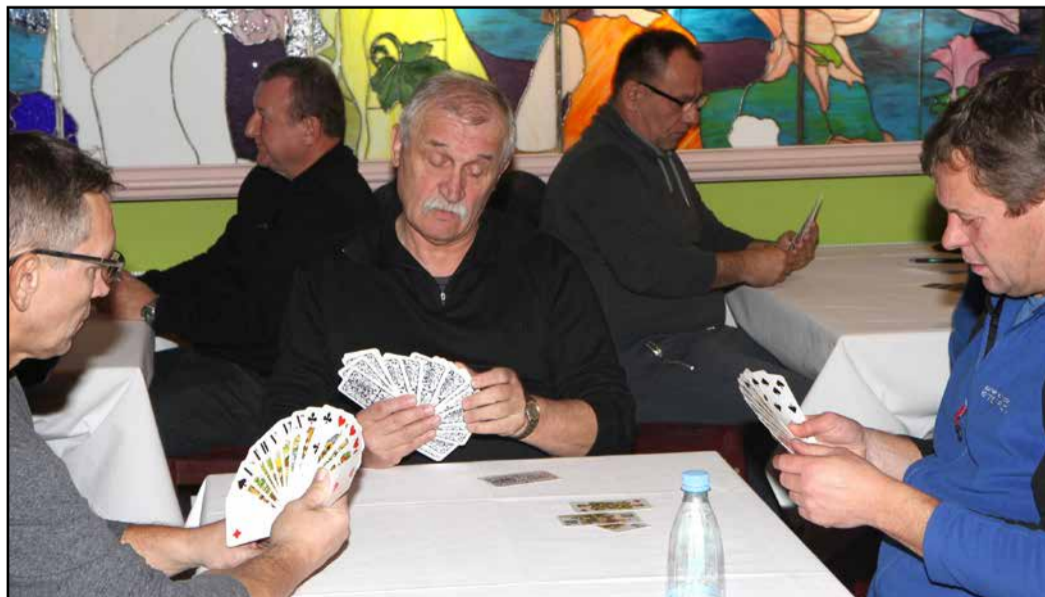
S tekmovanja v igranju taroka

PVD Sever za celjsko območje – Odbor Žalec je pod pokroviteljstvom ZPVD Sever v žalskem hotelu pripravilo državno ekipno in posamično prvenstvo ZPVD Sever v igranju taroka, ki je potekalo