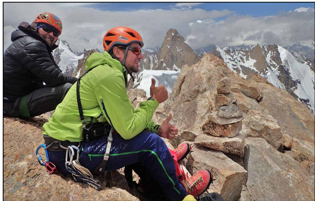
Najvišji vrh doline Rangtik – Remalaya (6278 m)

Njihov naslednji cilj je bil prvi pristop na Chakdoir Ri (6193 m aka H8). Plezati so