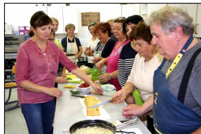
Kuharska delavnica Gobe v dobri družbi