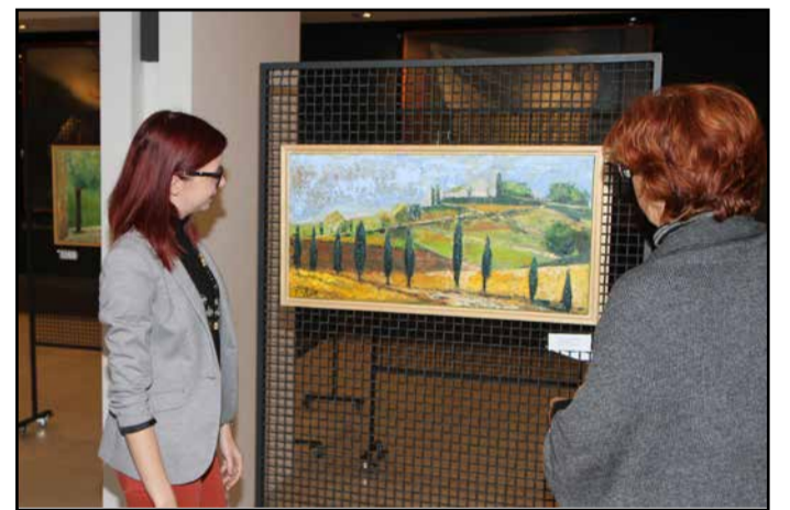
Z razstave Svetloba in barve Toskane