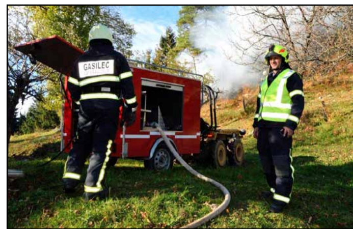
Z gasilske vaje na Dobrovljah pri domačiji Matko

Operativno taktična vaja je zajemala gašenje gospodarskega poslojpa in varovanje ostalih objektov na težje dostopni kmetiji Matko, Dobrovlje 24. Prav tako so gasilci položili dodatno napajanje požarne vode z »gasilsko verigo« za dobavo požarne vode iz rezervoarja na