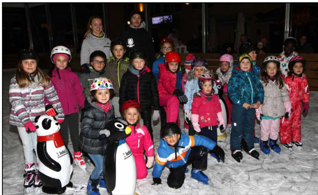
Veseli obrazi mladih udeležencev tečaja