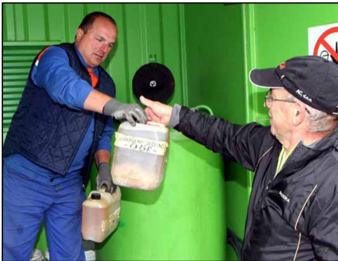
Z letošnje prve akcije zbiranja nevarnih odpadkov

Največ je bilo premazov, lepil in smol (3.190 kg), sledijo odpadna motorna olja (2.902 kg), zavržena električna in elektron-