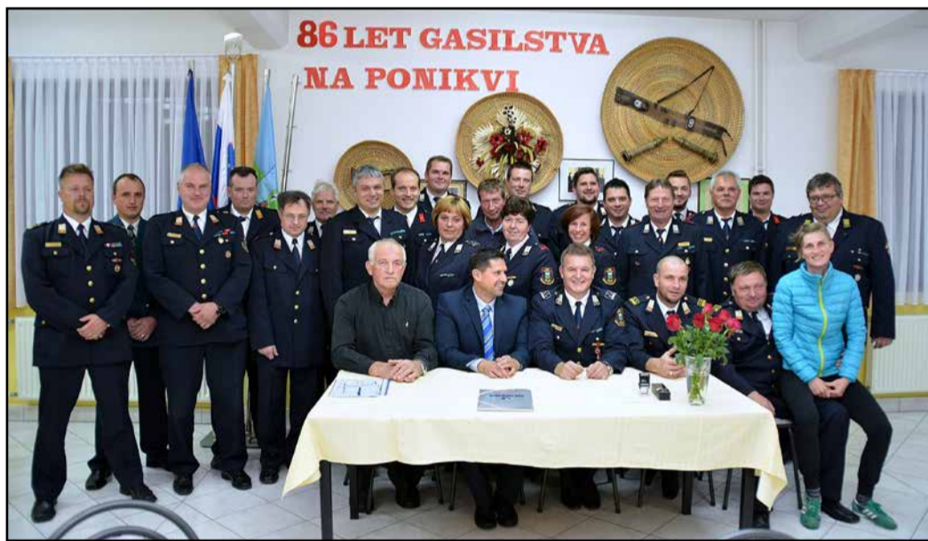
Udeleženci podpisa pogodbe

Na Ponikvi pri Žalcu bodo gasilci v prihodnje bogatejši za novo gasilsko vozilo – avtocisterno, ki bo z večjo kapaciteto vode zagotavljala boljšo požarno varnost v krajevni skupnosti in žalski občini. Konec prejšnjega meseca so namreč podpisali pogodbo o nakupu podvozja gasilskega vozila SCANIA P 400 CB 4x4 HHZ.