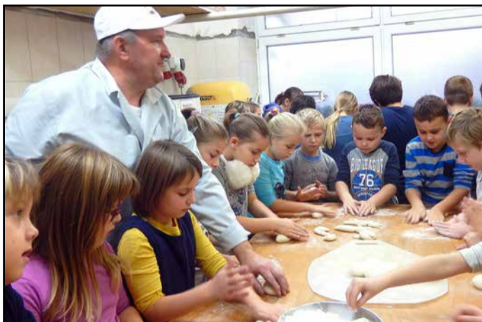
Z dneva slovenske hrane v Braslovčah