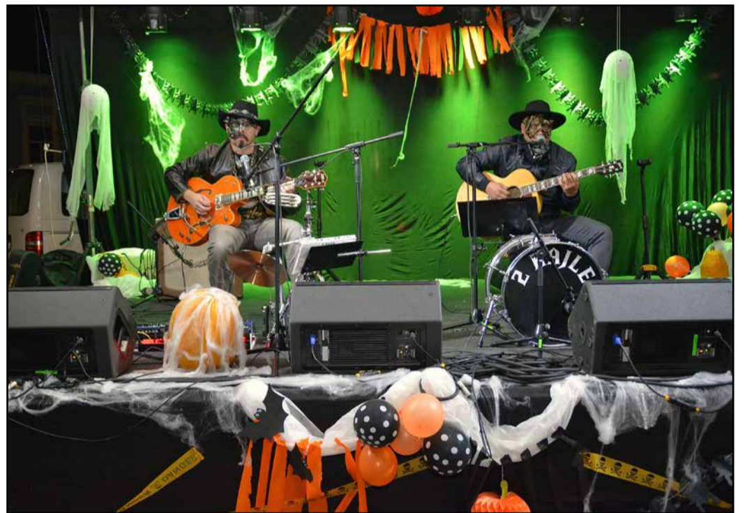
Za glasbeni del je med drugim poskrbel duet Dve kajle.