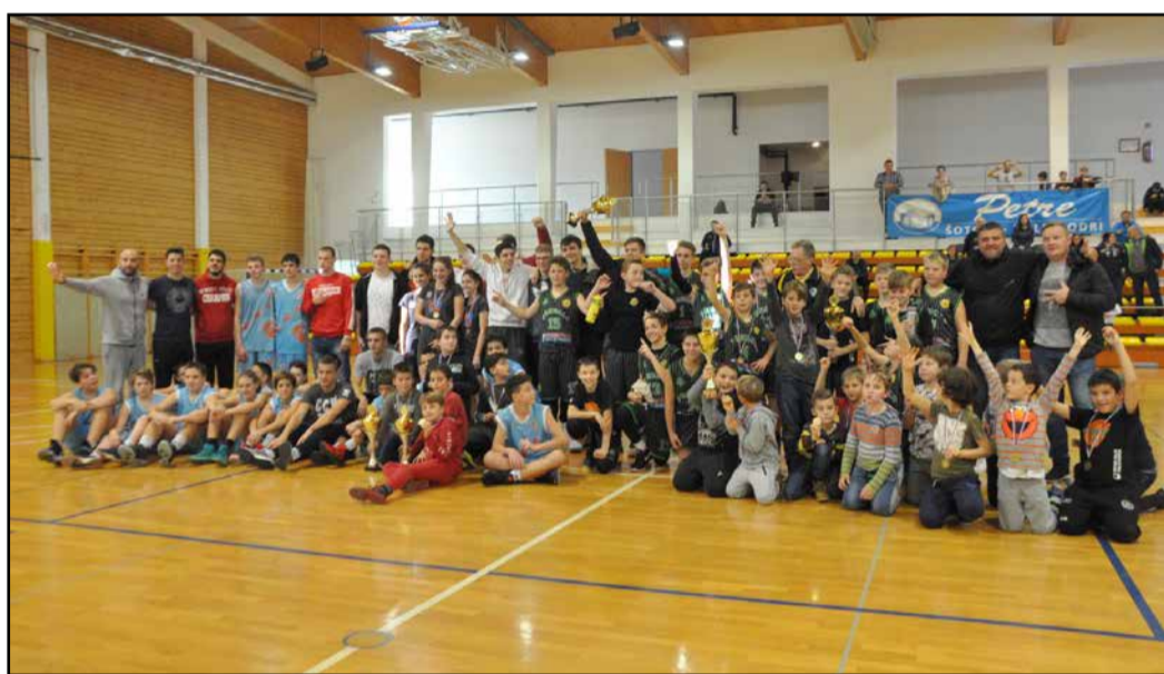
Kljub ligaškim obveznostim slovenskih klubov je preboldskemu klubu uspelo izpeljati V. mednarodni košarkarski turnir mladih.

Po nekaj manj kot desetih letih so lahko ljubitelji košarke spet spremljali košarkarsko tekmo članov v preboldski športni dvorani. Članska ekipa Košarkarskega kluba Prebold 2014 z imenom Prebold Vrtine Palir je prvo uradno tekmo v 4. slovenski košarkarski ligi odigrala v Vojniku, na prvi domači tekmi pa se je na Martinovo soboto pomerila s KK Brežice.