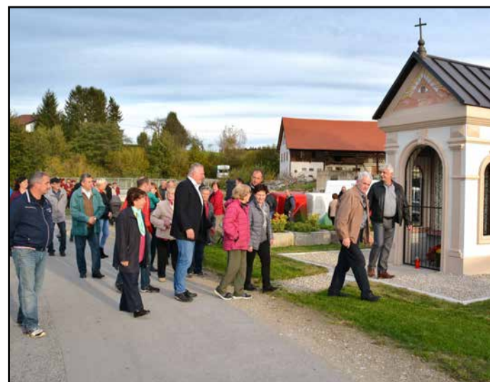
Udeleženci prireditve so se ob igranju libojske godbe sprehodili okrog kapele.