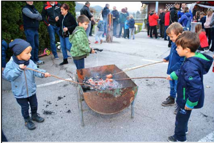
Udeleženci so si lahko sami spekli klobase.

so organizatorji poskrbeli tudi za poslikavo obraza in otroške delavnice, otroci pa so si ob pe-