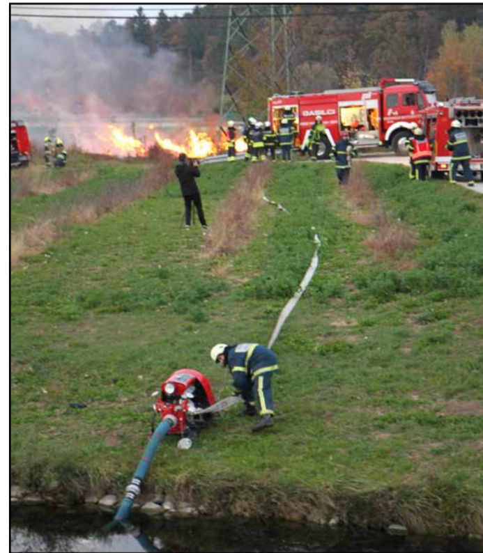
Z vaje gašenja na deponiji lesnih odpadkov