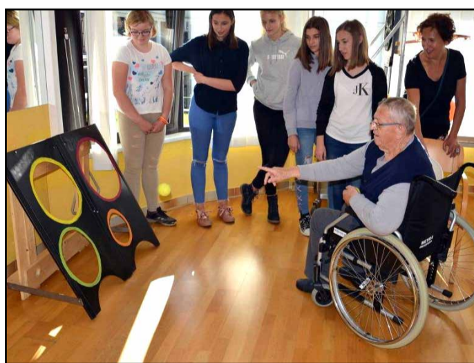
V Domu upokojencev Polzela se zavedajo pomena gibanja.

V Domu upokojencev Polzela dajejo velik pomen gibanju, saj se zavedajo, da sta gibanje in rekreacija pomembna dejavnika za ohranitev telesnega in duševnega zdravja.