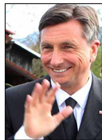
Borut Pahor ob prevolitnem obisku v naši dolini.