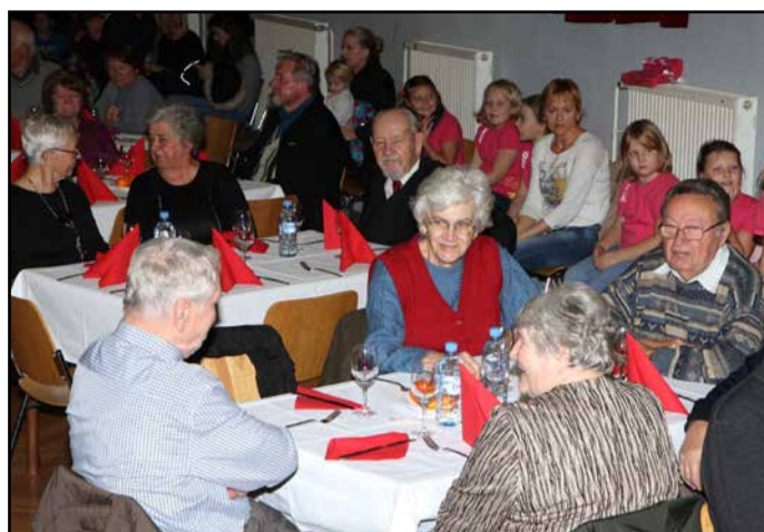
S srečanja starejših krajanov v dvorani KZ Petrovčje

Za prijetno vzdušje so poskrbeli Mešani pevski zbor A Capella ter učenci OŠ Petrovčje, z druženjem pa so ob jedaci in pijači nadaljevali v pozno popoldne. T. Tavčar