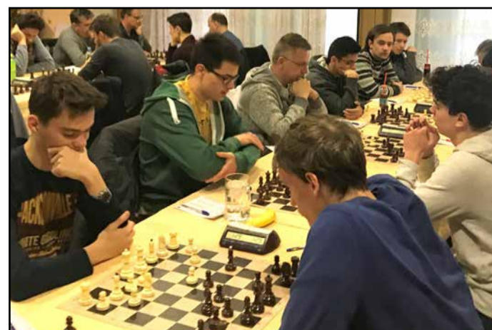
S šahovskega dvoboja med ŽŠK Maribor 2 in Žalčani

Že v prvem delu v Murski Soboti so premagali ekipo ŠK Brežice in ŠK Šentjur z rezultatom 5 : 1 in odigrali neodločeno s celjskim šahovskim klubom 3 : 3. V drugem delu so najprej premagali ekipo Slovenj Gradca s 5 : 1, v derbiju za prvo mesto z ekipo Branik Maribor pa so po začetnem vodstvu in dobrih pozicijah izgubili z 2 : 4. Sledil je še dvoboj z ŽŠK Maribor 2, ki so ga Žalčani dobili 3,5 : 2,5 in tako