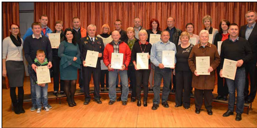
Dobitniki priznanj s preboldskim županom in predsednico komisije

Drugi novembrski petek je v Dvorani Prebold potekala zaključna prireditev Naš kraj lep in urejen, na kateri so podelili priznanja za najlepše urejene hiše, kmetije, gasilski dom, poslovni prostor, večstanovanjski objekt, planinski dom in kamp v občini v letu 2017. Podelili so tudi posebno priznanje za domiselno in vizualno privlačno ureditev vrtov.