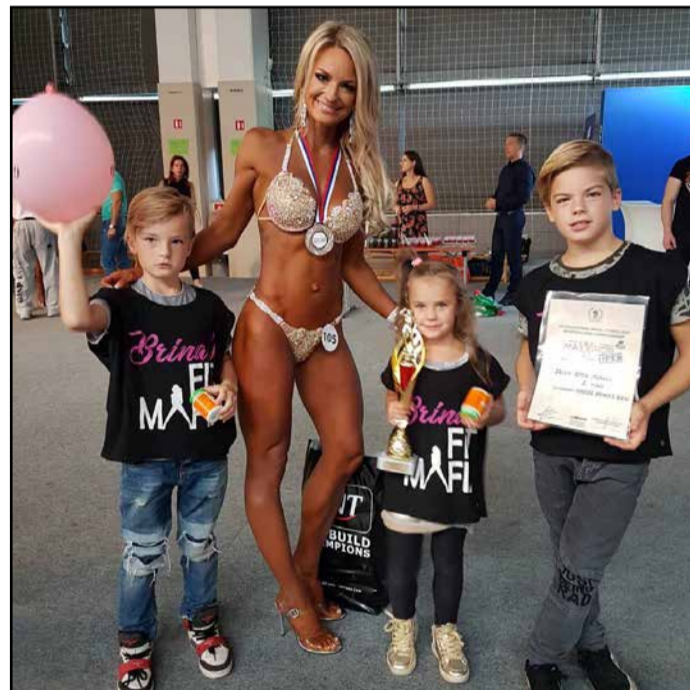
Otroci jo spremljajo tudi v zakulisju.