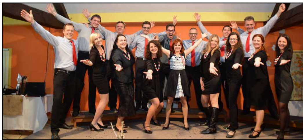
Zbor Glas srca z zborovodkinjo (na sredini z dvignjenimi rokami) po koncertu v razigranem vzdušju

Komorni zbor Glas srca, ki deluje v okviru KD Anton Schwab Prebold, je v soboto, 18. novembra, v dvorani Aninoga doma Župnije Prebold pripravil jubilejni koncert ob desetletnici svojega delovanja.