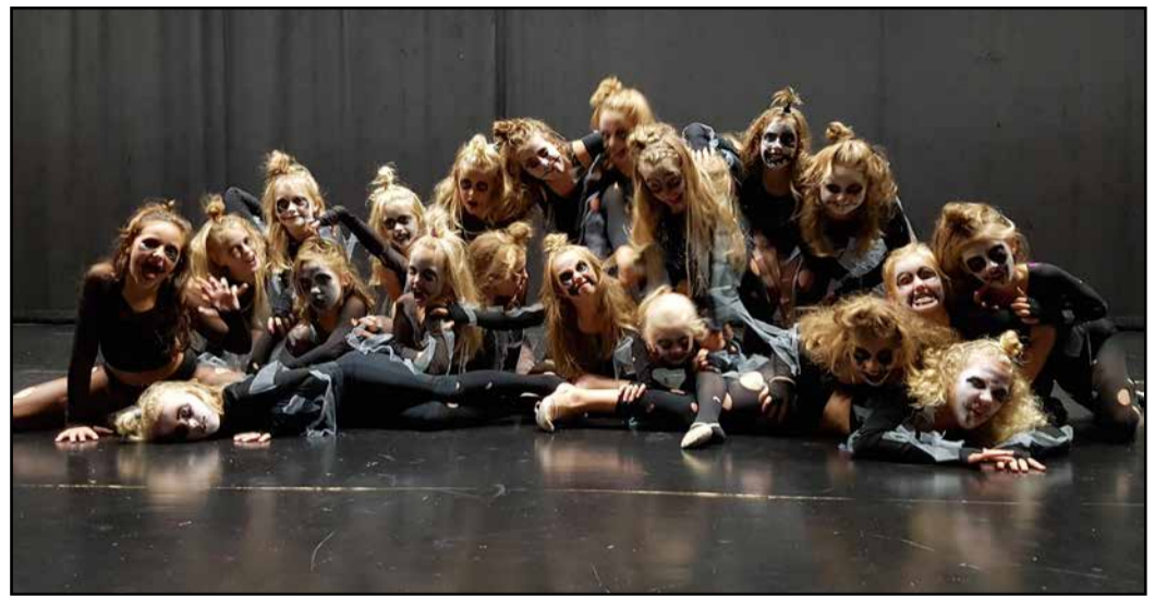
S plesnega spektakla na braslovškem odru