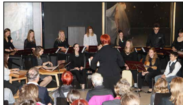
Množična orkestrska zasedba je novembra navdušila.