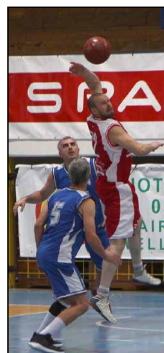
S prve tekme Lev zavarovanje : Veterani Polzela.