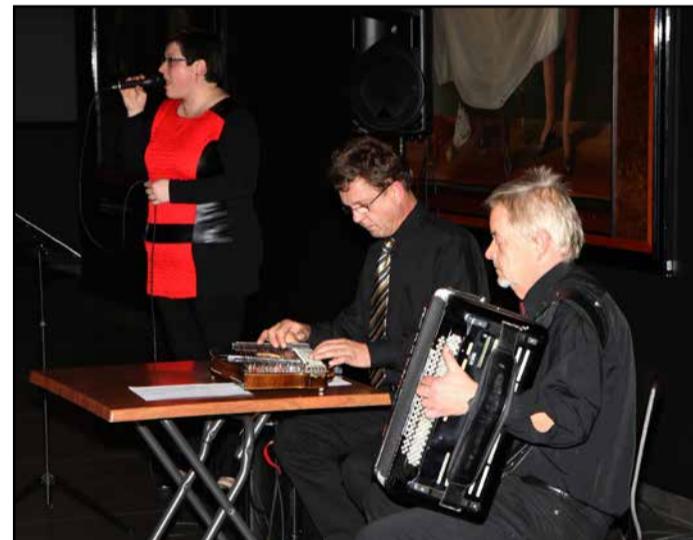
V okviru citrarskega abonmaja je nastopil Vokalno-instrumentalni sestav Cvetoča jesen.

Njihov repertoar obsega priredbe stare glasbe, originalne skladbe za citrarski orkester ter slovensko glasbo vseh žanrov, filmsko glasbo in podobno. Vsako leto pripravijo