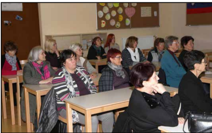
Nekaj udeležencev predavanja o ohranjanju zdrave kože

Društvo za promocijo in vzgojo za zdravje Slovenije s sedežem v Žalcu je v predavalnici I. OŠ Žalec pripravilo predavanje o vzdrževanju zdrave kože, prehrani in negi kože.