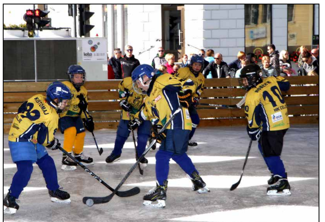
... ter mladih celjskih hokejistov.