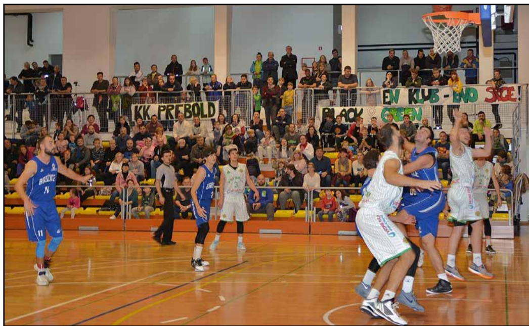
Na prvi domači članski tekmi v 4. SKL se je ekipa Prebold Vrtine Palir (v belih dresih) pomerila s KK Brežice.