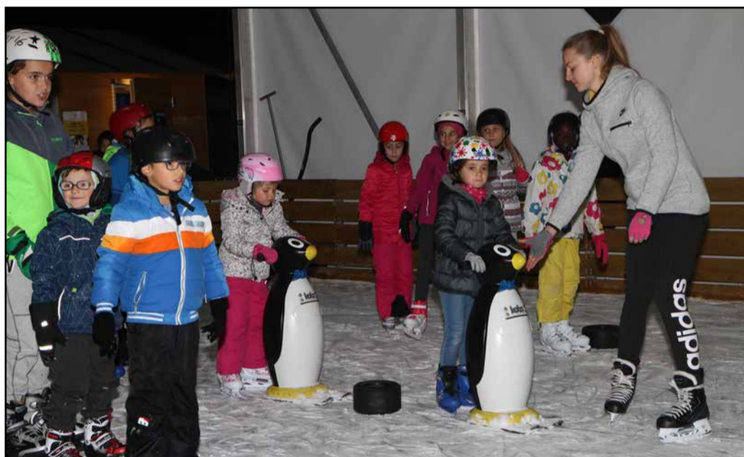
Začetniki si pomagajo tudi s pingvinčki

ZKŠT Žalec je poleg rekreativnega drsanja na drsališču v Žalcu, ki so ga uporabniki dobro sprejeli, poskrbel tudi za brezplačne tečaje drsanja, ki jih izvaja v sodelovanju s HK ECE Celje.