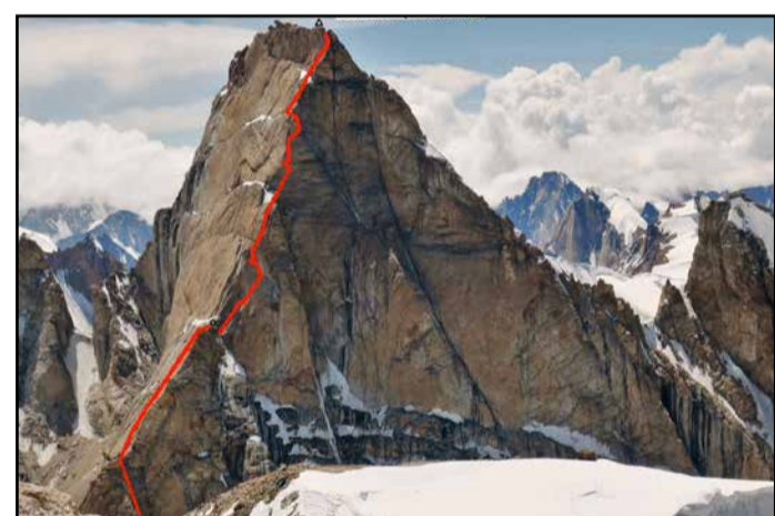
Plezalna smer na Chadkor Ri (6193 m)