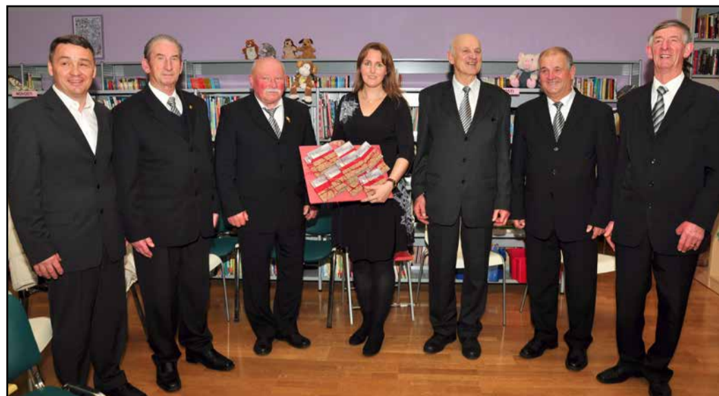
Reški slavčki ob predstavitvi zgoščenke

Predzadnji novembrski torek so v Občinski knjižnici Prebold v sodelovanju s Kulturnim društvom Marija Reka pripravili pogovorni večer s predstavitvijo zgoščenke Reških slavčkov, ljudskih pevcev izpod Reške planine.