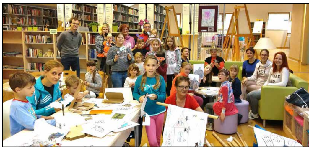
Udeleženci delavnice so uživali v ustvarjanju.

V Občinski knjižnici Prebold so pred letošnjo nočjo čarovnic pripravili ustvarjalno delavnico, ki so jo vodile Moj-