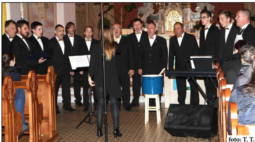
Moški pevski zbor Savinjski zvon v šempetrski cerkvi

V mesecu novembru smo bili priča dvema zanimivima koncertoma z naslovom Savinjski zborovski trio. Prvi je bil na Dobrni, drugi pa v Šempetru minulo soboto. Združila sta tri pevske zборе, ki so predstavili pesmi, ki jih bodo zapeli na regijskem tekmovanju odraslih zborov in malih pevskih skupin z naslovom Od Celja do Koroške, ki bo 2. decembra v Glasbeni šoli Celje.