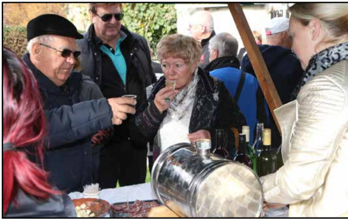
Na stojnicah je bilo na martinovo zelo veselo.