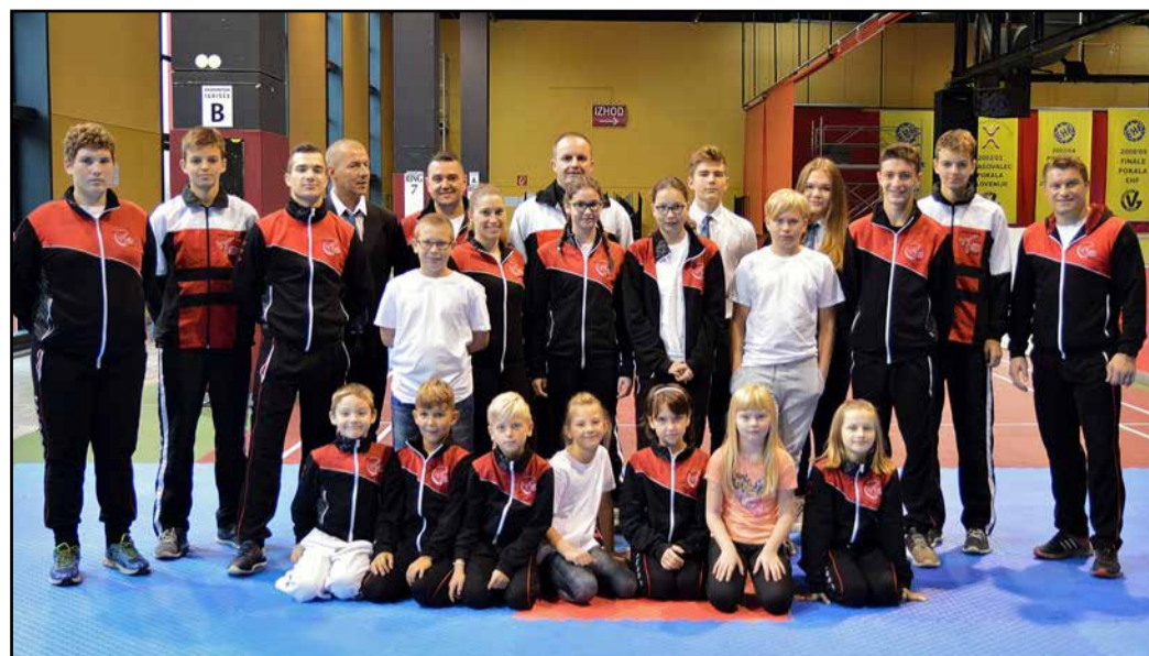
Članice in člani Taekwondo kluba Sun Braslovče

Braslovški taekwondoisti so se v sklopu SLO TEAM udeležili mednarodnega odprtega prvenstva na Češkem, štirinajst dni kasneje pa so na domačih tleh uspešno nastopili tudi na odprtem mednarodnem prvenstvu SLO open 2017.