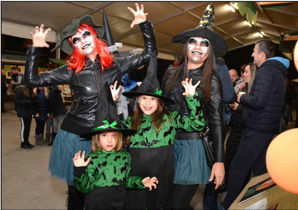
Male in velike čarovnice