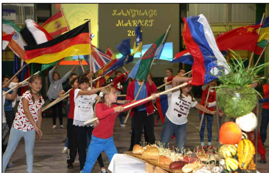
Z jezikovne tržnice na I. OŠ Žalec

Učitelji in učenci I. OŠ Žalec so v četrtek, 26. oktobra, pripravili že osmo jezikovno tržnico pod geslom Kjerkoli sonce teče, povsod kruh se peče. S tako obliko projektne dela celostno nadgradijo delo z učenci priseljenci in krepijo medkulturni dialog na šoli.