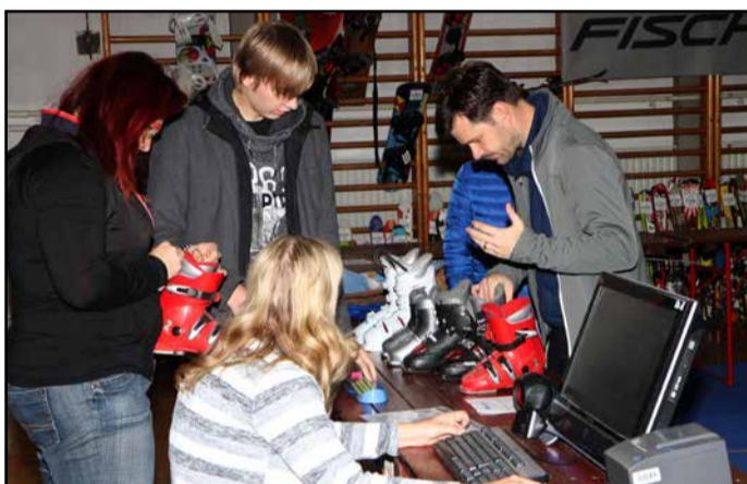
Z smučarskega sejma v telovadnici UPI – ljudske univerze Žalec

V OŠ Prebold pa je od petka do vključno nedelje potekal smučarski sejem, ki ga je organiziral Smučarski klub Pre-