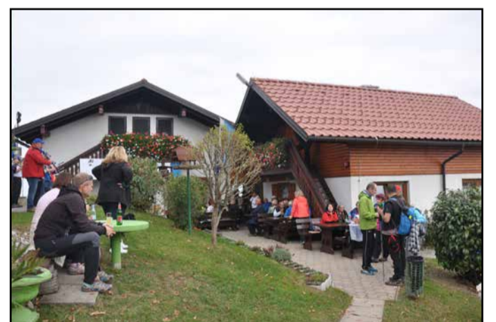
Dragov dom na Homu na dan praznovanja