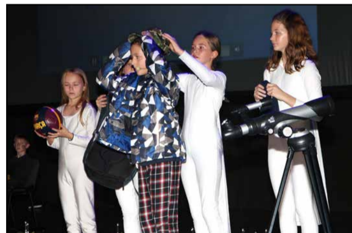
Drejček na poti v šolo, po noči nenavadnih dogodkov