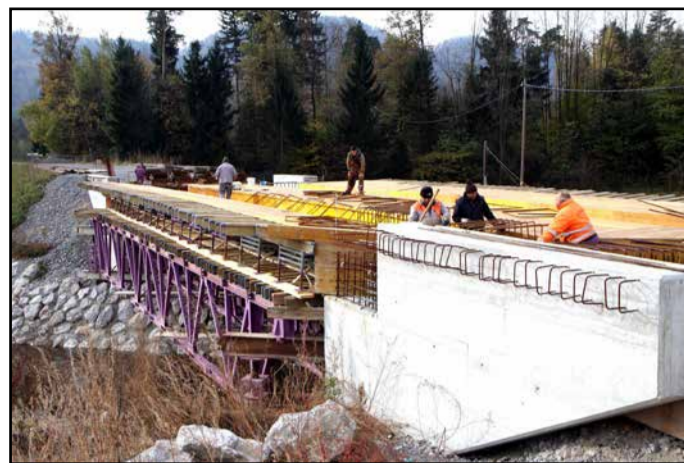
Gradnja novega mostu čez potok Bolsko

Minila so tri leta od tragične nesreče, v kateri sta na nizko postavljenem mostu čez potok Bolsko na Vranskem