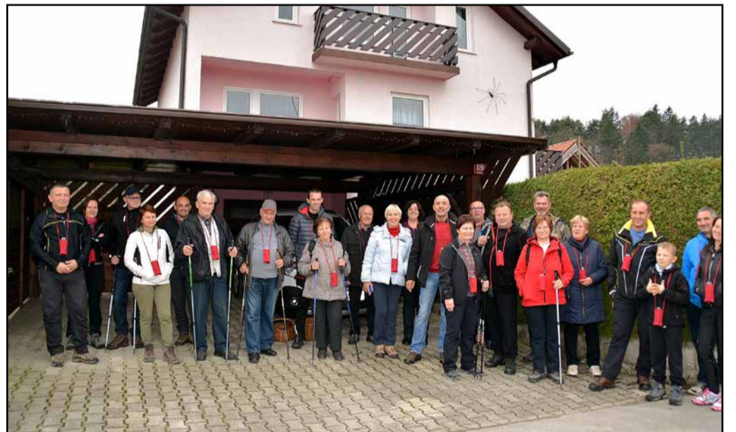
Nekaj udeležencev pred začetkom pohoda s kozarčki okrog vratu

Sovaščani spodnjih Kasaz, ki vse leto skrbijo za razna druženja, so se tudi letos na Martinovo nedeljo zdaj že tradicionalno podali na pohod.