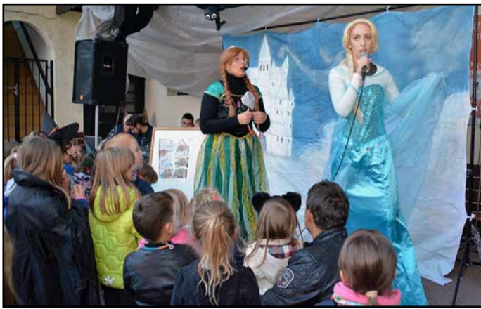
Otroci so si ogledali predstavo Ledeno kraljestvo.

Prireditve se je udeležilo veliko občanov in obiskovalcev iz drugih krajev doline. Prav gotovo so najbolj uživali otroci, ki so se preobrazili v male čarovnice in čarovnike. Ob tej priložnosti