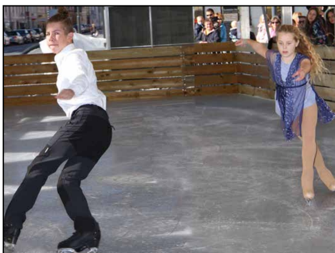
Nastop Nine in Luke Logarja ...

Na prireditveni ploščadi na Šlandrovem trgu pa so istega dne ob 12. uri odprli tudi drsališče, ki bo predvidoma odprto