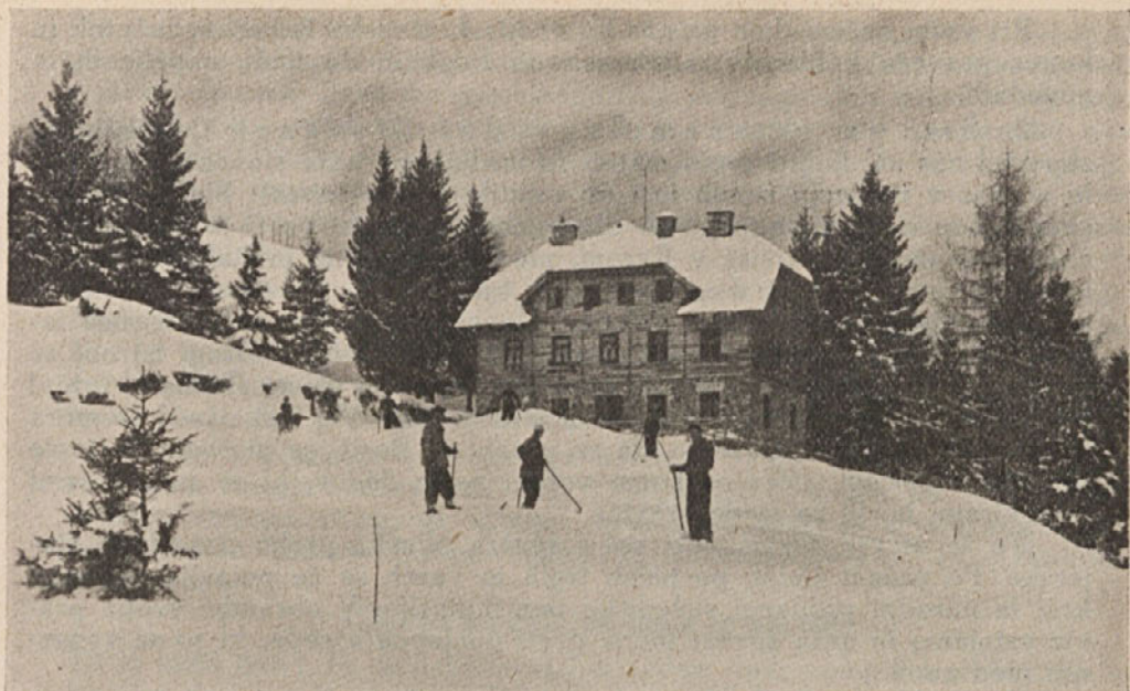
Planinski hotel »Pension Lobnica« na Smolniku pri Rušah leži 950 m visoko. Hotel je moderno opremljen, vendar najde v njem tudi skromen turist svoj primeren kot. V bližnji cerkvi na Smolniku je skoraj redna nedeljska sv. maša. Pri hotelu so lepi smučarski tereni in izleti.

fantje tovariši, ki se doslej še niste uprli v plug skupnosti, nekateri zaradi nerazumevanja, drugi pa morda zaradi negotovosti, zapeljani. Prvim kličemo zahvalo, druge vabimo k skupnemu delu.