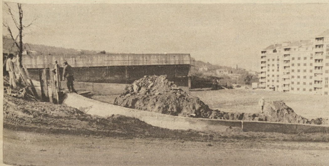
KOPER - Emona center v koprski Smedeli, ki bo imel v dveh etažah 2100 kv. metrov prodajnega prostora, predstavlja tehnološko in konceptno eno izmed rešitev, izvedeno iz dosedanjih izkušenj Emone, obenem in istočasno prvi Emona center na obali, ki se v izhodišču naslanja na sosese in njen razvoj. Kupcem bo na voljo 60 parkirskih, kar je pomembno tudi za tranzitne kupce - turiste, ki jih tu v sezoni ne manjka. Dela se bližajo h koncu, zato pričakujemo, da bo novi Emona center odprt v prvi polovici prihodnjega leta.