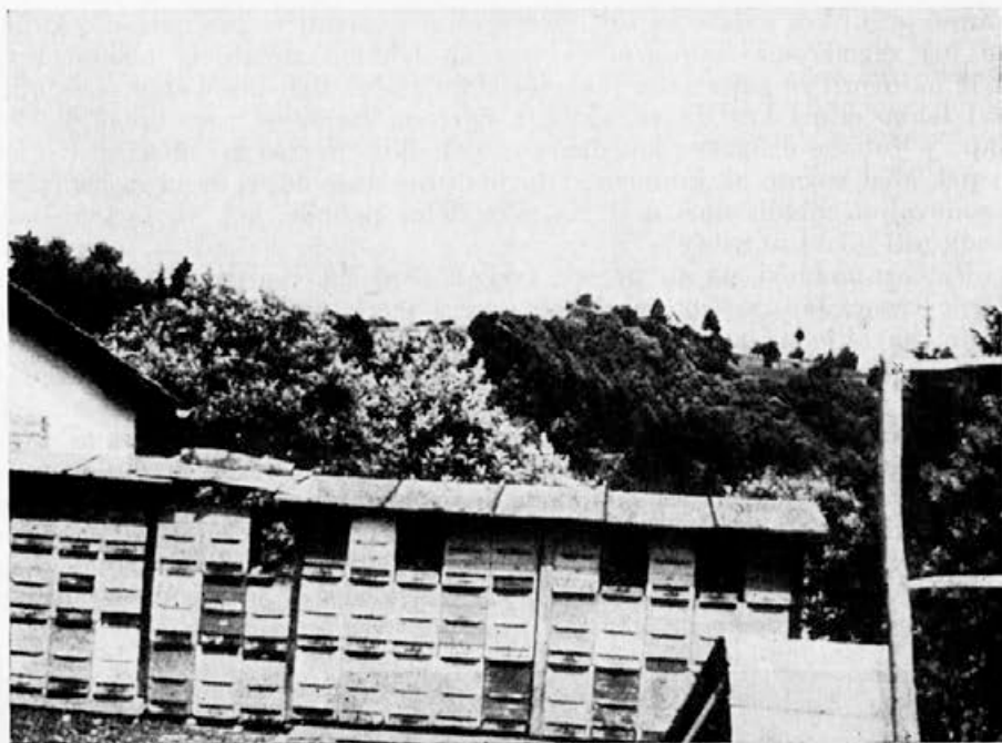
Urednikove čebele na kostanjevi paši v litijskih hribih

občutno prizadene. Kostanj ali hoja je le v nekaterih predelih. Zato sta julij in avgust za čebele in čebelarje meseca preseljevanj. Kdor ne čebelari le zaradi moralnega ali športnega užitka, temveč hoče imeti od čebel tudi vsaj nekaj gmotne koristi, ta se skoro mora odločiti za prevažanje. Seveda je to združeno s precejšnjimi skrbmi, napori in izdatki. Posebno transporti velikih čebelarstev na dolge proge ali celo v nepoznane pokrajine zahtevajo ne le debelo, neizčrpno mošnjo, temveč »heroja« od glave do pet: ne samo pogumnega, čvrstega, mišičastega, vztrajnega in potrpežljivega, ampak zlasti tudi podjetnega, spretnega, iznajdljivega, zmožnega naglih odločitev in drznih tveganj.