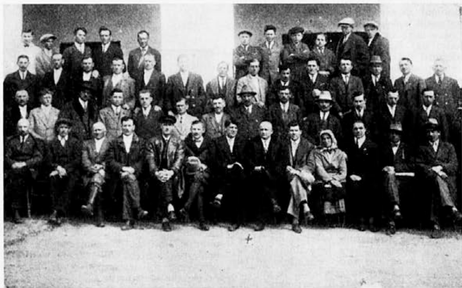
Spomin na prvo ustanovljeno čebelarstvo družino v Dolnji Lendavi v Pomurju leta 1921. Imela je samo dva člana manj kot takratna čebelarstva podružnica v Ljubljani. V njej je bilo 74 članov

V soboto 1. aprila t.l. je predaval o tem v Zagrebu naš tovariš urednik približno 200 čebelarjem, ki so prišli iz vseh hrvatskih krajev. Po predavanju so se navzoči zelo zanimali za probleme vzreje in želeli, da bi jim tudi tu pomagali, dokler delo ne bo steklo. Tovariš urednik jim je obljubil vso pomoč. Hrvatski čebelarji žele, da bi bilo tako predavanje tudi na Reki.