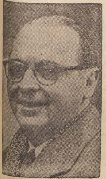
Zahodnonemški zunanji minister Brentano

Paris, 19. febr. (AFP). — V poučenih krogih izjavljajo, da je Zahodna Nemčija danes, tik pred začetkom pogajanj o Posarju, izročila odgovor na francosko spomenico, ki je vsebovala vprašanja, zadevajoča Posarje, o katerih