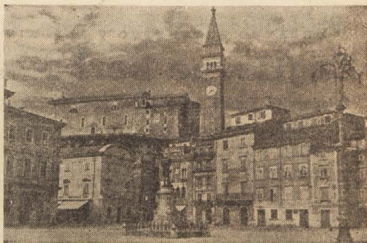
Piran z znamenitim zvonikom v ozadju

Ceprav lahko ugotovimo, da je gumena industrija pokazala v pojavnem obdobju lep napredek, seveda to še spričo naglega razvoja in potreb ostale industrije, ne moremo trditi, da bi šla vzporedno z ostalim našim razvojem. Zato sodijo strokovnjaki, da smo v tej panogi industrije pravzaprav v pričetku razvoja in ji bo za naprej potrebno posvetiti vso pozornost, tako da bo lahko zadostila velikim potrebam, ki jih prinaša sodobno gospodarsko življenje.