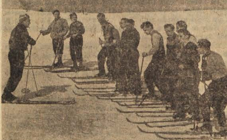
Udeleženci tečaja pri »teoretičnem pouku kristianije

Zanimalo me je, kakšne občutke imajo ti ljudje pri spustu, ko dosegajo precejšnjo hitrost. Pojasilni so mi, da strmino občutijo samo po tem, da jih nese navzdol. Sklonijo se naprej (strove