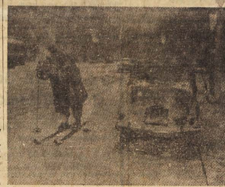
Slika je bila posneta na eni izmed najbolj prometnih ulic v Rimu. Skoraj neverjetno, toda tudi v tem mestu letos niso ostali brez snega, čeprav je le-ta tu prava redkost. Iznajdljivi smučar si je privezal smuč in se vključil v mestni promet.

Reaktivni čoln prevozi na uro nad 11 km. Konstruktorji pravijo, da bo hitrost večjega čolna z močnejšim motorjem še večja. Načelo, po katerem vozi reaktivni čoln, ni nič novega. Takšne čolne izdelujejo ne le v Veliki Britaniji, marveč tudi v ZDA in v ZSSR.