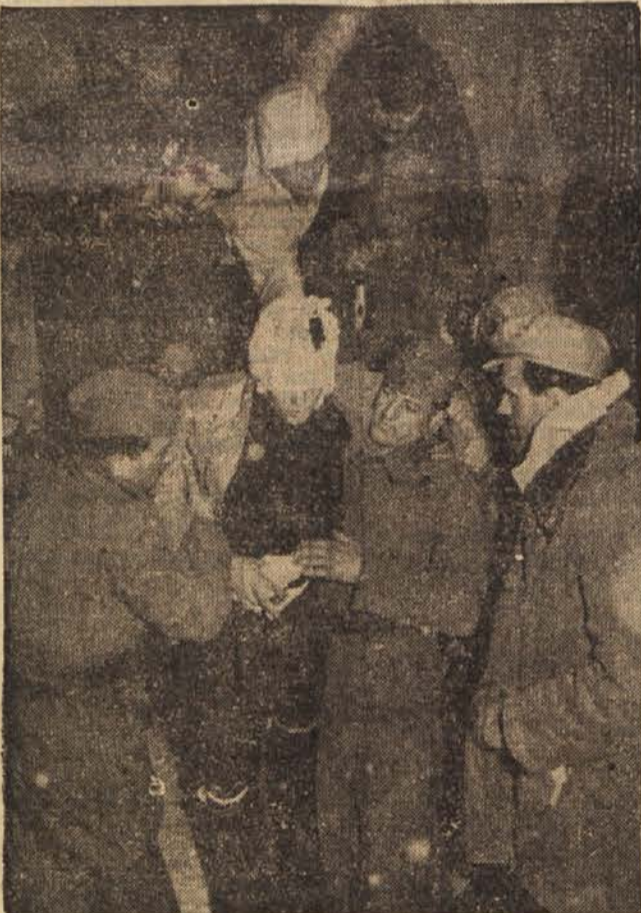
Reševanje ponesrečencev na Mavrovem: vojaki nosijo ranjence na zdravstvene postaje.