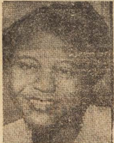
Tesarjeva žena je podpisala prošnjo, da bi njen otrok obiskoval isto šolo kot beli otroci. Rezultat: moža so vrgli iz službe, njo pa ponižali.

Mesto Yazoo je mesto, ki leži v delti Mississippija, mesto polno magnolij, zelenih verand in vrste spominov, ki se ne pozabijo tako