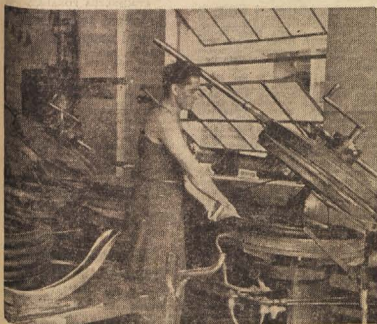
Delavec jemlje izdelan plašč za kolo iz vulkanizatorja

Ena najmlajših industrij na svetu in tudi v naši državi je gumena industrija. Prvi začetki te industrije segajo 90 let nazaj, pri nas pa je bila ustanovljena prva tovrstna tovarna pred 35 leti, in sicer »Sava« v Kranju, ki je pričela delovati februarja 1921. leta. Do sedaj se je ta vrsta industrije zelo razširila po svetu, tako da izdelava sedaj letno že kaka 2 milijona 600.000 ton raznih izdelkov. V naši državi jih seveda izdelamo dosti manj. V minulemu letu smo v vseh tovrstnih tovarnah pri nas izdelali za blizu 6500 ton gumijaste obutve, tehničnih izdelkov okoli 4800 ton in pnevmatik za okrog 2400 ton. Gumena industrija porabi približno dve tretjini kavrčka za proizvodnjo pnevmatik.