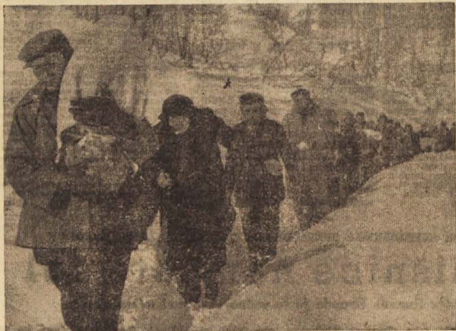
Evakuacija prebivalstva iz ogroženih področij

največ pa pripadniki Jugoslovanske ljudske armade in Ljudske milice.