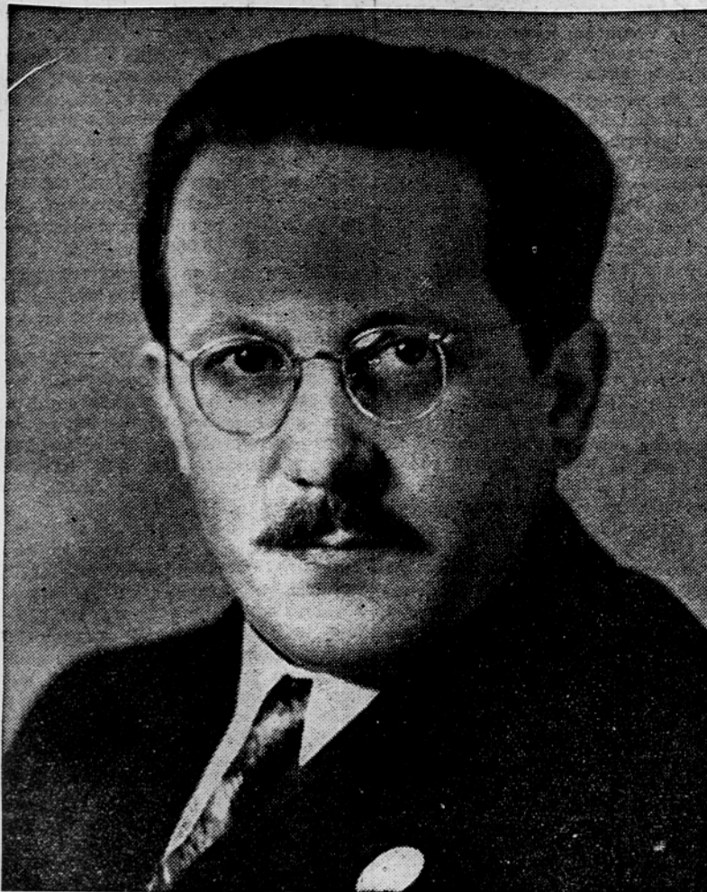
TOVARIŠ EDVARD KARDELJ

podpredsednik Zvezne vlade in predsednik Kontrolne komisije FLR Jugoslavije, eden najvidnejših graditeljev nove Jugoslavije, odlični bореc za pravice naših narodov, je kandidat II. volivne enote Okrožja mesta Ljubljane, I. volivne enote na Jesenicah in II. volivne enote v Mariboru