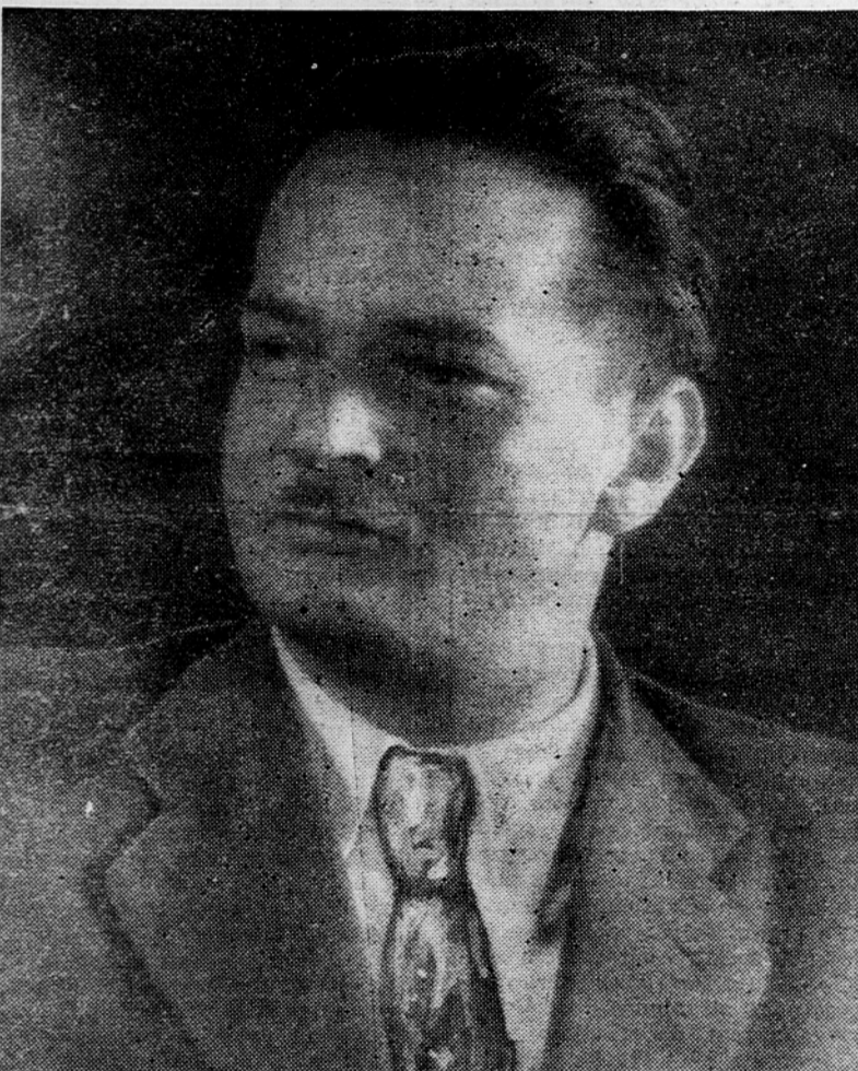
TOVARIŠ BORIS KIDRIČ

podpredsednik Zvezne vlade in predsednik Kontrolne komisije FLR Jugoslavije, eden najvidnejših graditeljev nove Jugoslavije, odlični bореc za pravice naših narodov, je kandidat II. volivne enote Okrožja mesta Ljubljane, I. volivne enote na Jesenicah in II. volivne enote v Mariboru