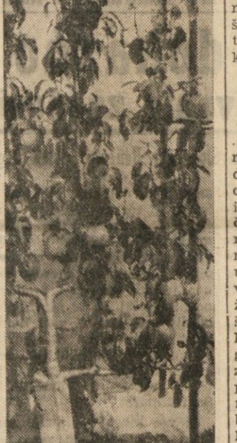
SKRBNO NEGOVANA HRUSKA

So zajedavci, ki napadajo tudi pri nas sadno drevje že med samim cvetenjem, in še pred tem, kakor na pr. cvetočih in nekatere gosericice. Ampak na splošno je teh malo. Poleg tega pa bi škropljenje med cvetenjem na splošno bolj škodovalo kot koristilo. Sredstva, s katerimi škropimo ali brizgamo drevje proti zajedavcem, so večje ali manj škodljiva tudi cvetju samemu, oziroma njegovim notranjim delom, ki predstavljajo najnežnejše organe rastline. Ako škropimo sredstvo pride v dotik s prašniki in pestiči, navadno uniči cvet, ki se ne more več oploditi in ne more napraviti sadu. Saj so ti notranji deli v sadu večkrat poškodovani in od samega dežja, ki ni strupen. Najboljši dokaz za to trditve nam more služiti pojav, da ima na splošno malo sadja, ako sadno drevje cvete ob dolgo trajajočem deževnem vremenu.