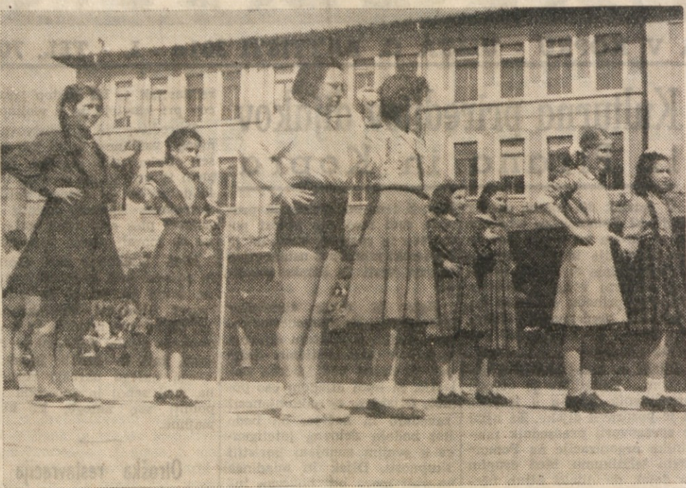
PIONIRKE PRAV PAZLJIVO SLEDJO SVOJI VADITELJICI, KI JIH BO TEMELJITO PRIPRAVILA, DO BODO NA TELOVADNEM NASTOPU 1. MAJA NASTOPILE RES BREZ HIBNO OB NAVDUSENJU GLEDALCEV.