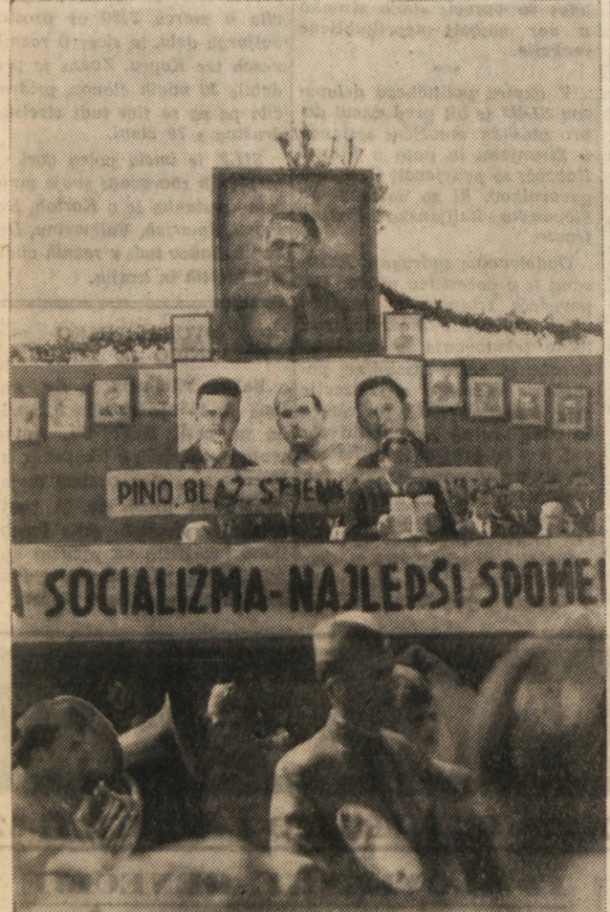
POGLED NA ODER OB SPOMINSKI SVEČANOSTI

skih herojev je obenem priznanje za žrtve vsega primorskega ljudstva. Tako kot se je zavestno borilo za svojo osvoboditev, gradi zdaj zavestno socializem. To bi hoteli naši sovrainiki zdaj zbrisati pred svetom, ker smo jim mi nevaren zgled. Utriramo nova pota in nosimo odgovornost ne le pred bodočimi pokolenji nego pred vsem naprednim človeštvom.»