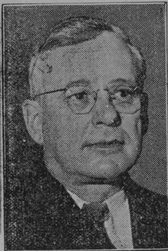
Rooseveltov protikandidat pri volitvah predsednika Združenih ameriških držav Alfred M. Landon, guverner države Kansas in pristaš republikancev.

Iz Španije javljajo o zopetnih nemirih. Očitno je, da še dolgo ne bo prišlo med razburkanimi in nahujskanimi španskimi masami do reda in trajnega pomirjenja. Omenka vredna je popustljivost španske vlade, katero kaže napram avtonomističnemu gibanju v posameznih pokrajinah. Značilna je bila tudi ugotovitev voditelja španskih katoličanov, katero je podal pred kratkem v parlamentu in v kateri trdi in dokazuje, da je bilo pod levičarsko vlado pri komunističnih nemirih razdejanih 251 cerkev, 259 oseb je bilo ubitih in 1287 težko ranjenih. Promet po cestah je nemogoč, ker zahtevajo levičarji od vseh vozov in avtomobilov poseben davek za uporabo cest.