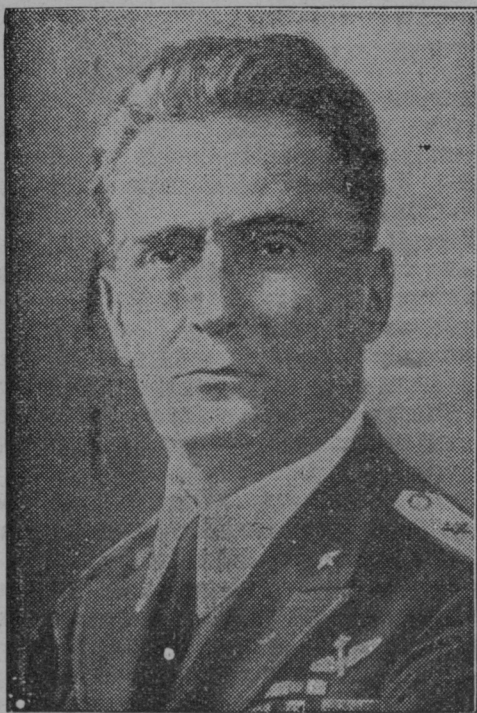
Abesinski podkralj italijanski maršal Graziani.