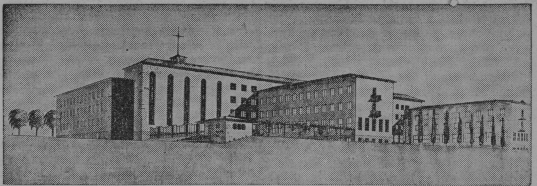
Tako bo zgedalo novo mariborsko bogoslovje.

Ponovno opozarjamo, da nedeljske karte ne veljajo za vse praznike, ampak samo za nede-