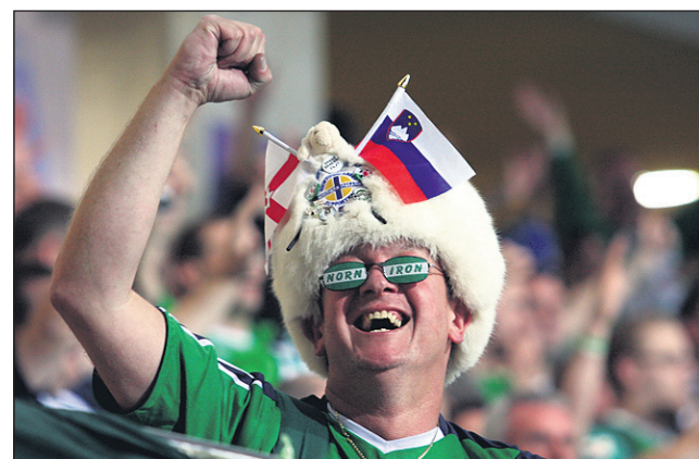
Irski navijači so skozi celotno tekmo prepevali in vzpodbujali svoje igralce.

tekmo, toda poraza nikakor ne. Škoda predvsem, ker se je ta poraz zgodil pred našim domačim občinstvom. Toda to je šele prva tekma, sedaj imamo na razpolago nekaj dni, da napake iz tekme proti Severnim Ircom popravimo. Sicer pa je