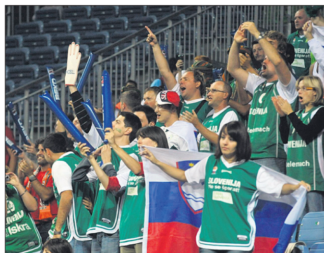
Preostali slovenski navijači so bili v novi dvorani Sinan Erdem odlično razpoloženi.

dobro zapolnjena. Lepo je bilo videti, da so srbski in hrvaški navijači, v glavnem resnični ljubitelji košarke, prerasli politično sovraštvo in da so ume tarčno razdvojeni ljudje sposobni