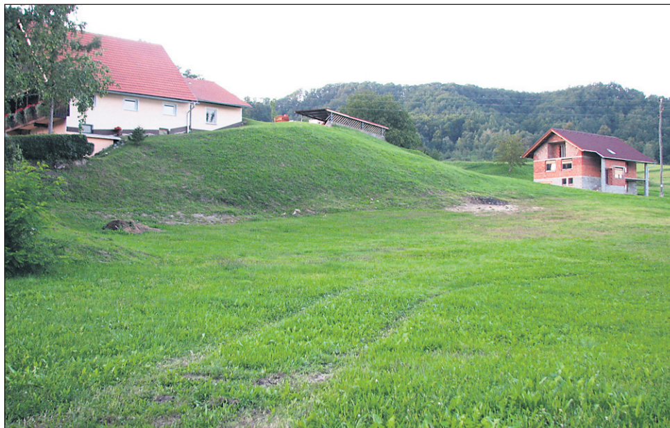
Tudi v Žetalah se bodo lotili prvega projekta po načelu javno-zasebnega partnerstva; zasebni investitor naj bi na lokaciji »Žabjek« (na posnetku), kjer je 2,6 hektarja velika parcela v občinski lasti, zgradil večstanovanjski objekt.