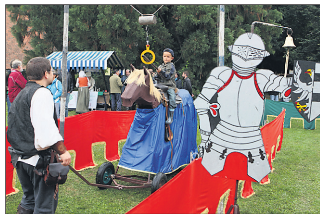
Na turnirskem prostoru je tudi letos potekal zanimiv program, ki je pritegnil številne, poskrbljeno je bilo tudi za animacijo in zabavo otrok.