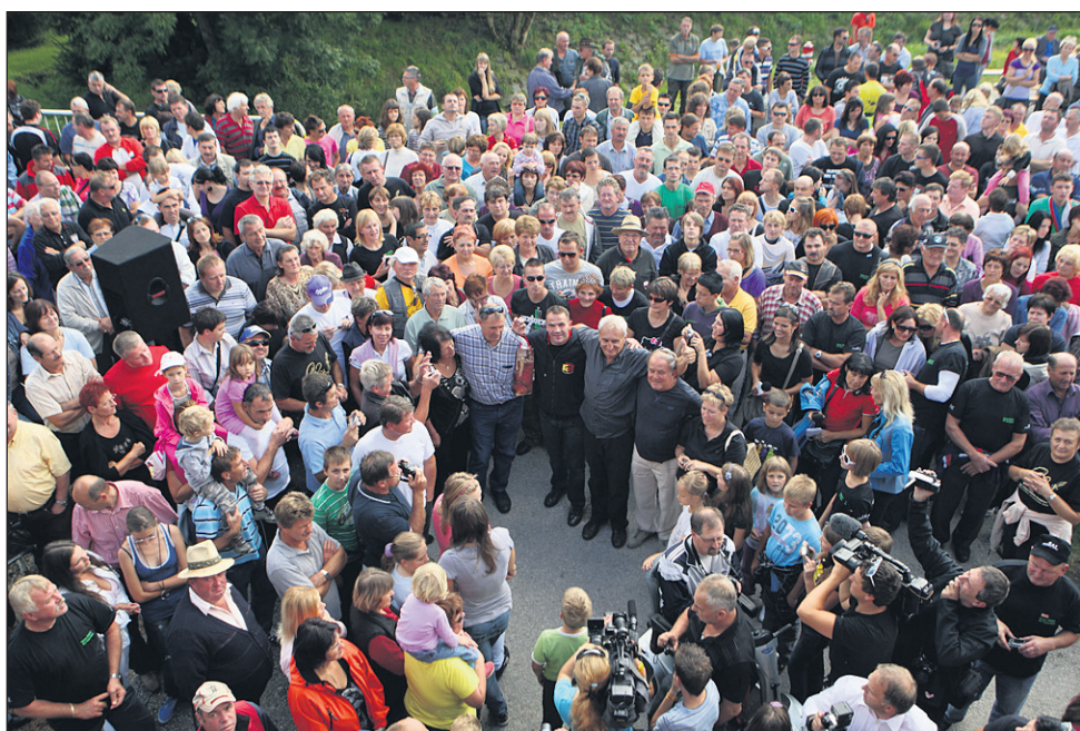
Utrinek s sprejema v Gaberniku, ki so ga domačini pripravili sovaščanu (več v petkovi številki).