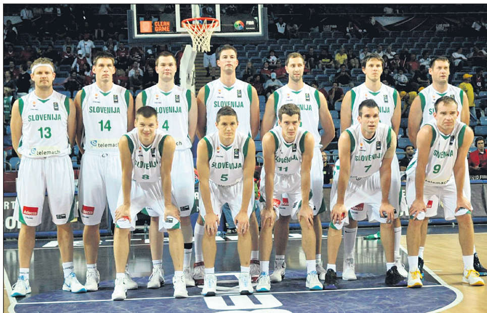
Slovenski reprezentantje so v osmini finala proti Avstralcem odigrali fantastično tekmo.

kjer se posamezni politični »voditelji« v svojem individualnem egoizmu borijo za svoje cilje, ki pogosto tudi niso cilji ljudstva, za katere so ti voditelji poklicani. Dokler bodo športni navijači tako dovezetni za navijače drugih ekip, bodisi čele-ti prihajajo iz t. i. »osi zla« ali iz naše sosesčine, obstaja pot do mirnega reševanja sporov. Včasih si lahko le želimo, da bi takšen športni spektakel potekal čez celo leto in bi politični veljaki sestankovali in kovali vojne zarote le 14 dni na leto.