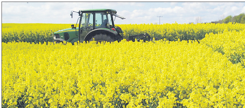
Oljna ogrščica je precej zahtevna kultura, ki pa ima visoko odkupno ceno, zato jo kmetje sejejo na vedno več površinah.

ne gre pričakovati posebnega pridelka, morda do 1,5 tone na hektar. Če pa se kmetje odločajo za intenzivnejše gojenje in s tem za višji dohodek, pa je bolje sejati sortno ali hibridno seme, ki daje večji pridelok, in predvsem dosledno upoštevati tehnologijo vzgoje in nege oljne ogrščice. Ta kultura namreč zahteva precej kvalitetna tla z relativno visokim Ph, najbolje v mejah med 5,5 in 6. Zelo priporočljivo je tudi, da so tla založena s kalijem. Smiselno je dodajati še mineralna gnojila, ki vsebujejo žveplo. Sicer pa je pri setvi s hibridi potrebno relativno majhna količina semena, priporočila se med 2,4 do 3,2 kilograma semena po hektarju, odvisno od teže po-