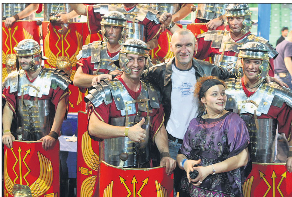
S ptujskimi Legionarji se je fotografiral tudi nekdanji hrvaški profesionalni boksar Željko Mavrovič.