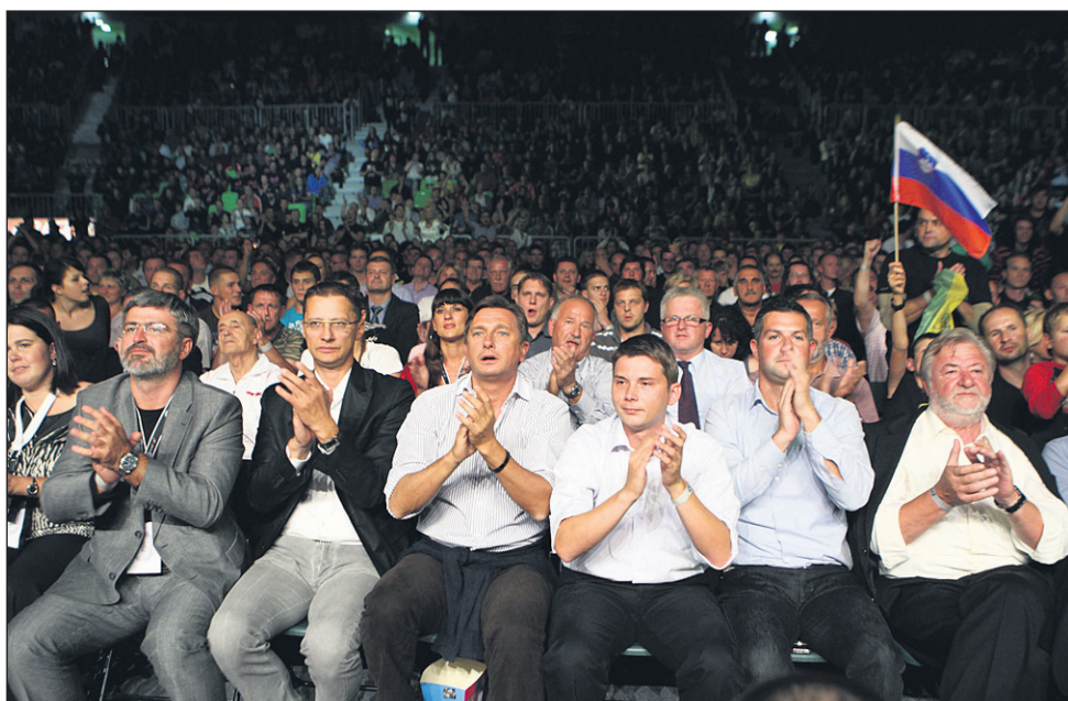
Med skoraj 13 tisoč glav množico je bilo veliko uglednih gostov iz sveta politike, gospodarstva, estrade, športa ... Manjkal ni niti predsednik vlade Borut Pahor.