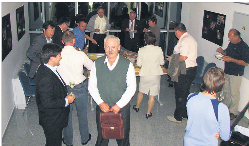
Na zadnji seji v sedanjem mandatu so svetniki sprejeli le en pomemben sklep za začetek postopka za izbiro izvajalca sistema daljinskega ogrevanja, sicer pa so se zadovoljili z branjem poročil o opravljenem delu vseh komisij, odborov in o izvedenih naložbah v zadnjih štirih letih, večer pa zaključili takole, kot je vidno na posnetku ...