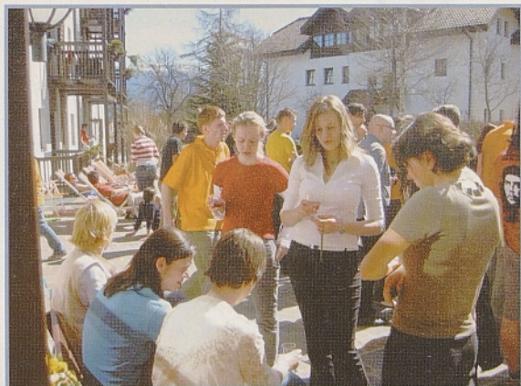
Zgoraj: zbirališče pred Haus der Familie nad Bocnom.

V nedeljo zjutraj je bila na programu ekumenska maša, nekaj ljudi pa se je ni udeležilo, eni, ker pač niso verni, drugi pa so še preganjali mačka. Popoldne pa je bilo na sporedu slavnostno odprtje seminarja, exchange market ("tržnica", kjer si manjšine med seboj izmenjujejo raznorazno gradivo, tipične jedi in pijačo) in okrogla mi-