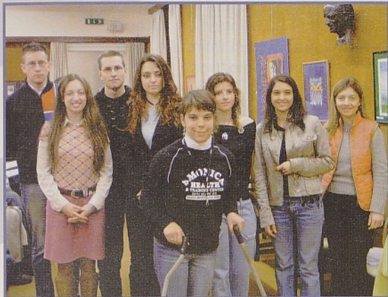
Mladi nagrajenci z nekaterimi člani komisije; pogled na dvorano med nagrajevanjem.