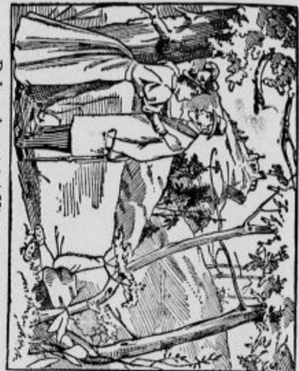
Dober dan strici! Kje pa je teta?