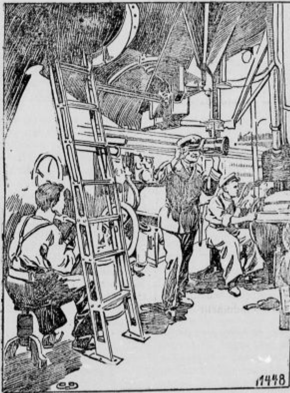
V notranjščini čolna-potapljača.

Zmaga pri Sibirju popolna. Romuni so skušali pri Sibirju (Hermannstadt) z napadi preprečiti zbiranje naših in nemških čet, pa se jim ni posrečilo. Uneli so se srditi boji. 26. septembra so začeli naši napadati. Bavarske čete so prodrle od severozapada po gorah in gozdovih Romunom za hrbet in zasedle prelaz Rdečega stolpa na romunsko-ogrski meji. S tem so hrabri Bavarci Romunom odrezali železnico in cesto v Romunijo. Ko so Romuni to opazili, so pognali vse svoje rezerve v