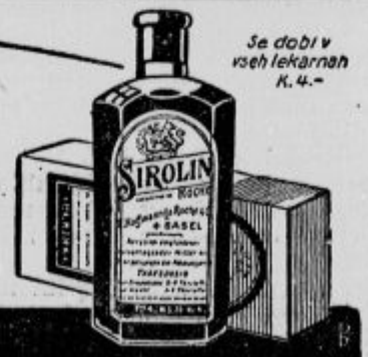
Se dobi v vseh lekarnah K. 4.-