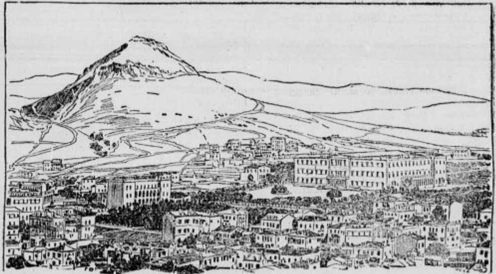
Atene s kraljevim gradom.

»A tako?... Nič ni bilo!« so se začeli posamezni glasovi in razočarana se je razšla »purga« in ono, kar je prebivalo pod grajsko streho. »Še enega niso ubili, pa so jih toliko sem privlekli!«