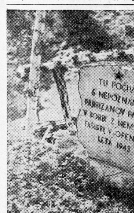
Grob na Frad

V Trbovljah so odprli enoletno gospodinjstvo šola, s skromno otvoritveno svečanostjo se je dne 16. septembra začel pouk na enoletni gospodinjstvi šoli v Trbovljah. Stari, mlade gospodinjstve in ženska mladina so nenehno izražali željo, da bi ustanovili tako gospodinjstvo šola, ki bi stalno delovala. Ne podlagi tej želji je Svet za prosveto in kulturo pri okrajnem ljudskem odboru v Trbovljah pristopil k pripravi ustanovitve gospodinjstve šole. Za sprejem v šolo se je prijavilo kar 61 mladink v starosti 14 do 18 let. Pri izbiri za sprejem v šolo je Svet za prosveto in kulturo dal prednost partizanskim sirotam in socialno šibkejšim prostilkam. V šolo je bilo sprejetih 36 mladink, medtem ko bodo morale ostale prositke čakati do prihodnjega leta.