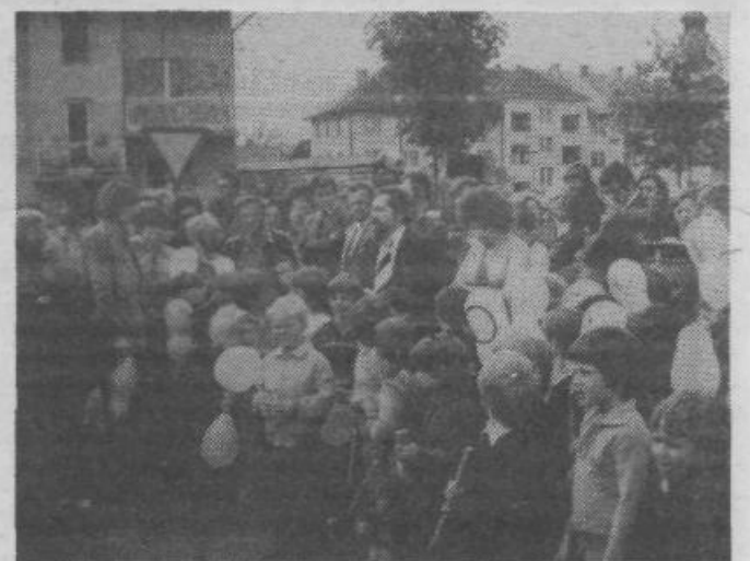
Poročali smo že, da je bil sredi maja odprt drugi vzgojno-varstveni zavod v naši soseski. To pot objavljamo sliko z odprtja. Mladi in stari se je razveselilo novega vrta, saj so z njim omiljene težave, ki na tem področju pestijo našo sosesko.