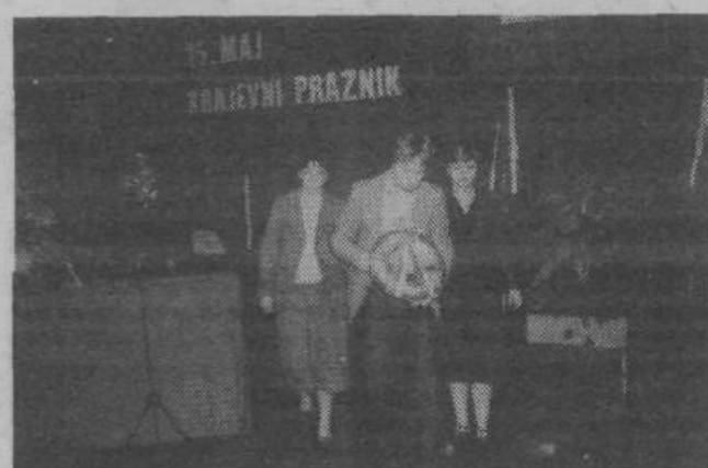
Krajani Most so se 15. maja množično zbrali v dvorani telovadnega društva Partizan in s krajšim kulturnim programom ter s podelitvijo priznanj zaslužnim krajonom počastili praznik svoje krajevne skupnosti. Ob tej priložnosti so tudi položili venec pred spominsko ploščo na stavbi krajevne skupnosti ob Zaloški cesti. (Na sliki: delegacija krajanov nese venec) D. J.