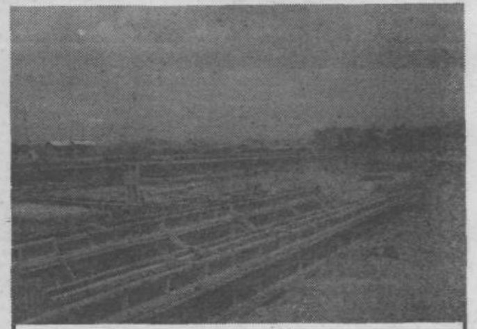
Od temeljnega kamna do temeljev za ves vrtec ob Cerutovi cesti je več kot korak.