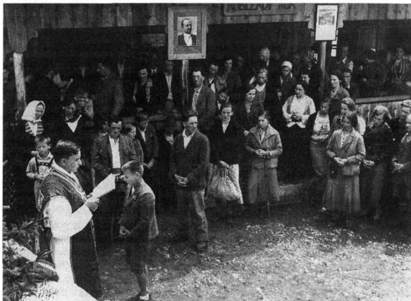
Praznovanje 40-letnice PD Radovljica pred Roblekovim domom leta 1935