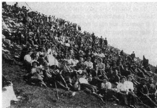
Otvoritev Prešernove koče na Stolu se je udeležila množica ljudi