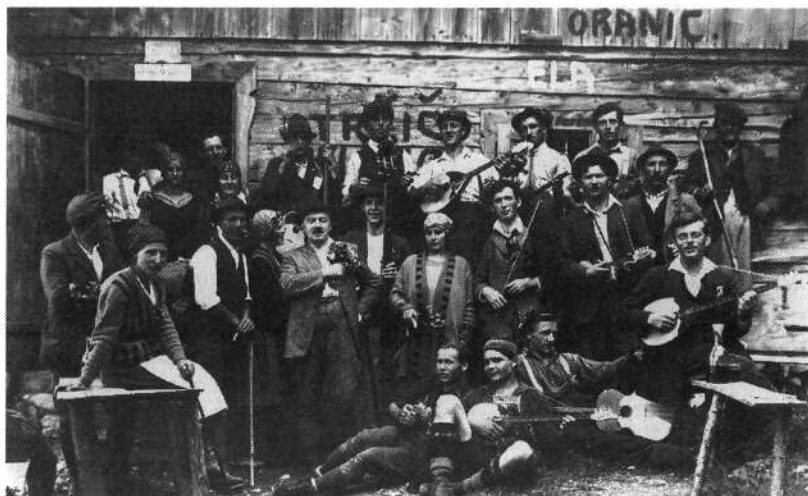
Na Poljski planini so leta 1908 odprli Vilfanovo kočo, ki pa je propadla