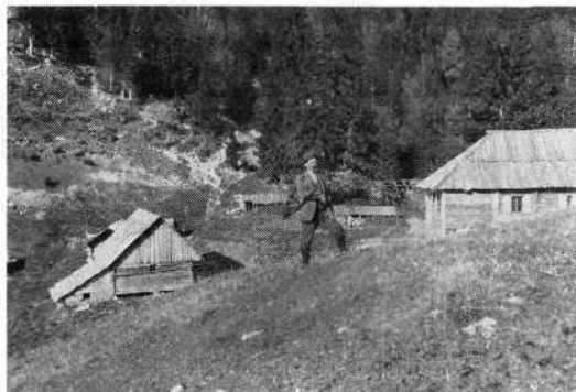
Poljška planina z nekdanjo Tomčevo kočo v desnem kotu zgoraj leta 1914

Za začetek planinstva na Begunjščici je pomembna Tomčeva koča na Poljški planini, ki so jo odprli leta 1900. Kasneje so zgradili novo kočo nekoliko višje (med Poljško planino in današnjim Roblekovim domom). Otvoritev je bila 25. 7. 1908. To je bila Vilfanova koča, ki je večkrat gostila vesele družbe, kot na primer tamburaše. Koča pa je ležala prenizko, bila je brez vsakega razgleda, postala je tudi pretesna, saj je bila