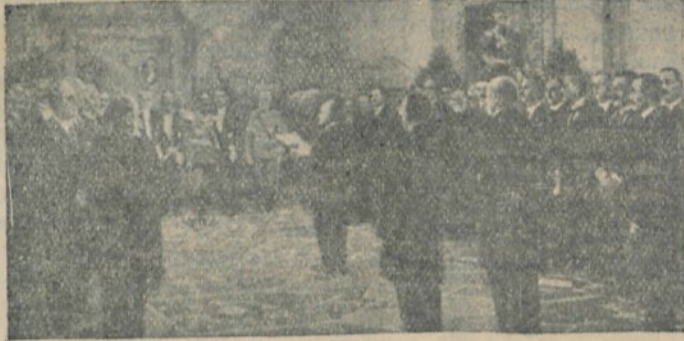
Zedinjenje 1. XII. 1918

velični lik blagopokojnega Viteškega kralja Aleksandra I. Zedinitelja, ki je žrtvoval vse svoje sile, vso svojo ljubezen in končno tudi še svoje dragoceno življenje za svoj narod. Ob 20-letnici zedinjenja ni časa za rekriminacije. Ob tem velikem jubileju nas mora navdajati neomajna vera v našo državo, v njeno svetlo bodočnost in v nerazdruž-