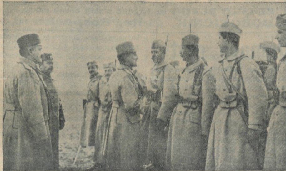
Kralj Aleksander med dobrovoljci

V tem znamenju ponosno obhajamo 20-letnico našega državnega in narodnega zedinjenja.