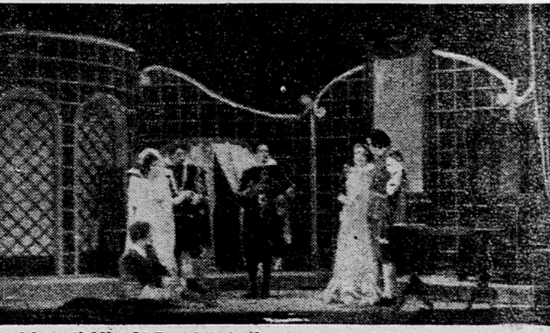
Drevi bo v ljubljanski Dravi že tretji leta v letošnji sezoni, in sicer Calderonove drame »Dama« — »Kralj«.