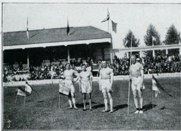
Finski metalci kopja na olimpijadi I. 1920.

Koliko konj je na svetu? Izmed 95 milijonov konj, ki jih je na svetu, živi 44 milijonov v Evropi. Ostali so razdeljeni na Ameriko s 34,2, Azijo s 13, Avstralijo z 2,8 ter Afriko z 1 milijonom. Pred vojno je imela največ konj Evropska Rusija, 24 milijonov (v Aziji še 10 milijonov),