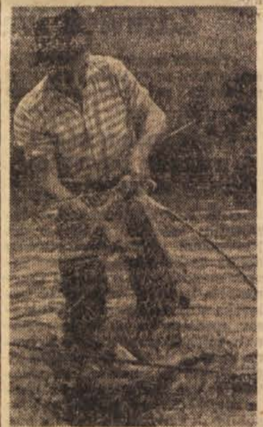
Skrb za zarod v ribogojnici

Zastrupljanje rib v naših rekah je pereče vprašanje, ki ga je treba nujno urediti. Če vodstva tovarn ne bodo tega razumeli, je dana možnost, da jih pristojni organi z zakonom k temu prisilijo. Te možnosti pa doslej aliso dovolj izkoristili.