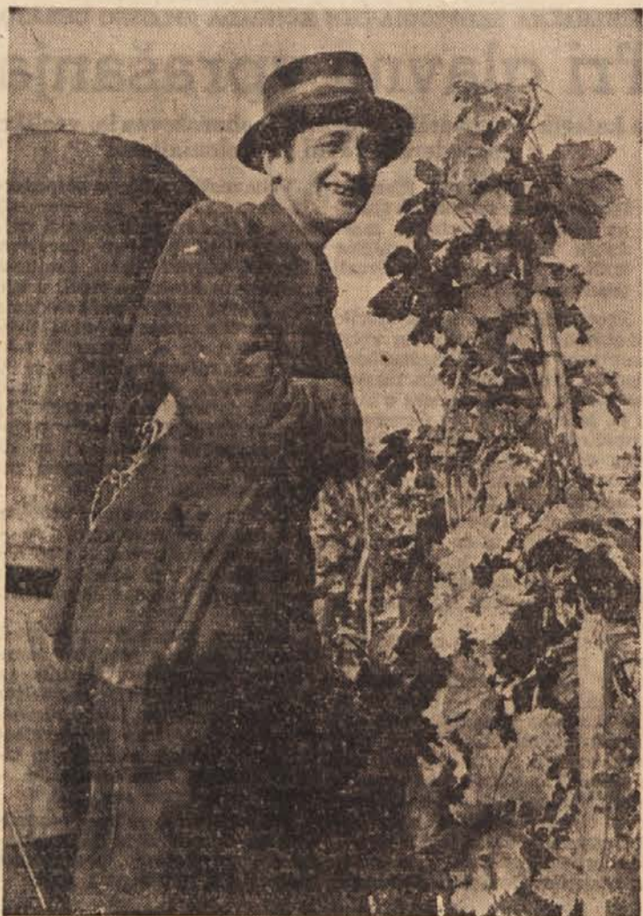
Spet trte so rodile...

Glavne ovire za sklenitev pogodb o sodelovanju v kooperacijski skupnosti za prodajo vina so odpravljene — Ustanovljena je za nedoločeno dobo, vsak član pa lahko odpove sodelovanje — Ceno in kakovost vin bo določala strokovna komisija skupnosti, sestavljena iz proizvajalcev