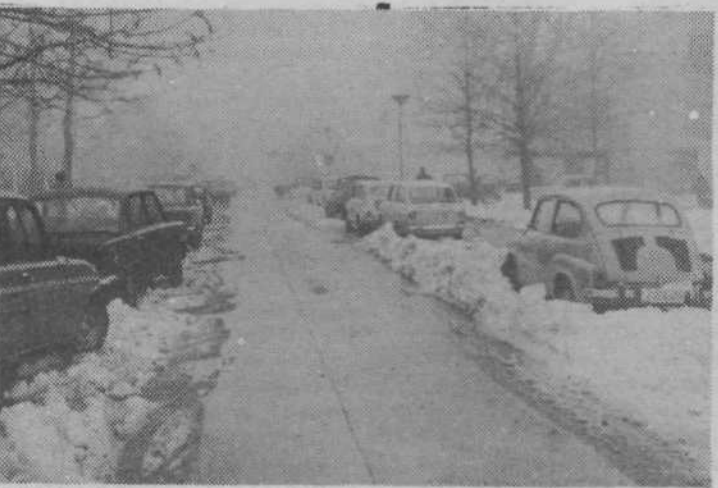
Odrinjeni kupi snega so povzročali težave pri parkiranju