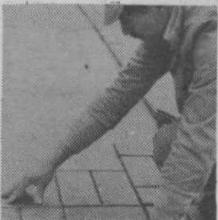
Polaganje ploščic je zahtevno in natančno delo