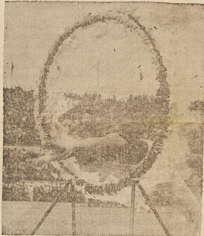
SKOZI OGNJENI OBROČ — Mlad turški dijak se je pogнал pri mladinskih športnih igrah v Carigradu skozi ognjeni obroč.

Oddasta se dve prenovljeni stanovanji, vsako po 5 sob s kopalnico in furnezo, na 1105 E. 74 St. Za pojasnila kličite HE 1-3946. —(5,8,10,12 avg.)