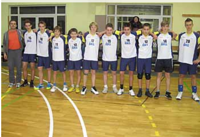
Celotna ekipa na turnirju, brez dveh bolnih igralcev iz prve postave

V četrtek, 15. decembra 2011, je bil na OŠ Preserje pri Radomljah odigran finalni turnir v šolski ligi (domžalska regija) v odbojki za starejše dečke. Naši učenci so se, ne glede na veliko smolo, ki se jim je pripetila, uspeli uvrstiti na višji (področna regija) nivo. Na turnirju smo bili drugi in tako prejeli srebrne medalje.