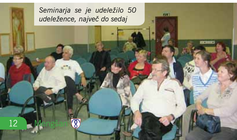
Seminarja se je udeležilo 50 udeležencev, največ do sedaj