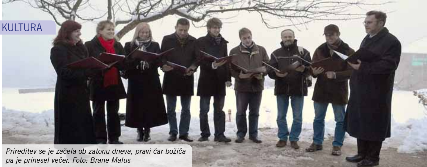
Prireditve se je začela ob zatonu dneva, pravi čar božiča pa je prinesel večer.