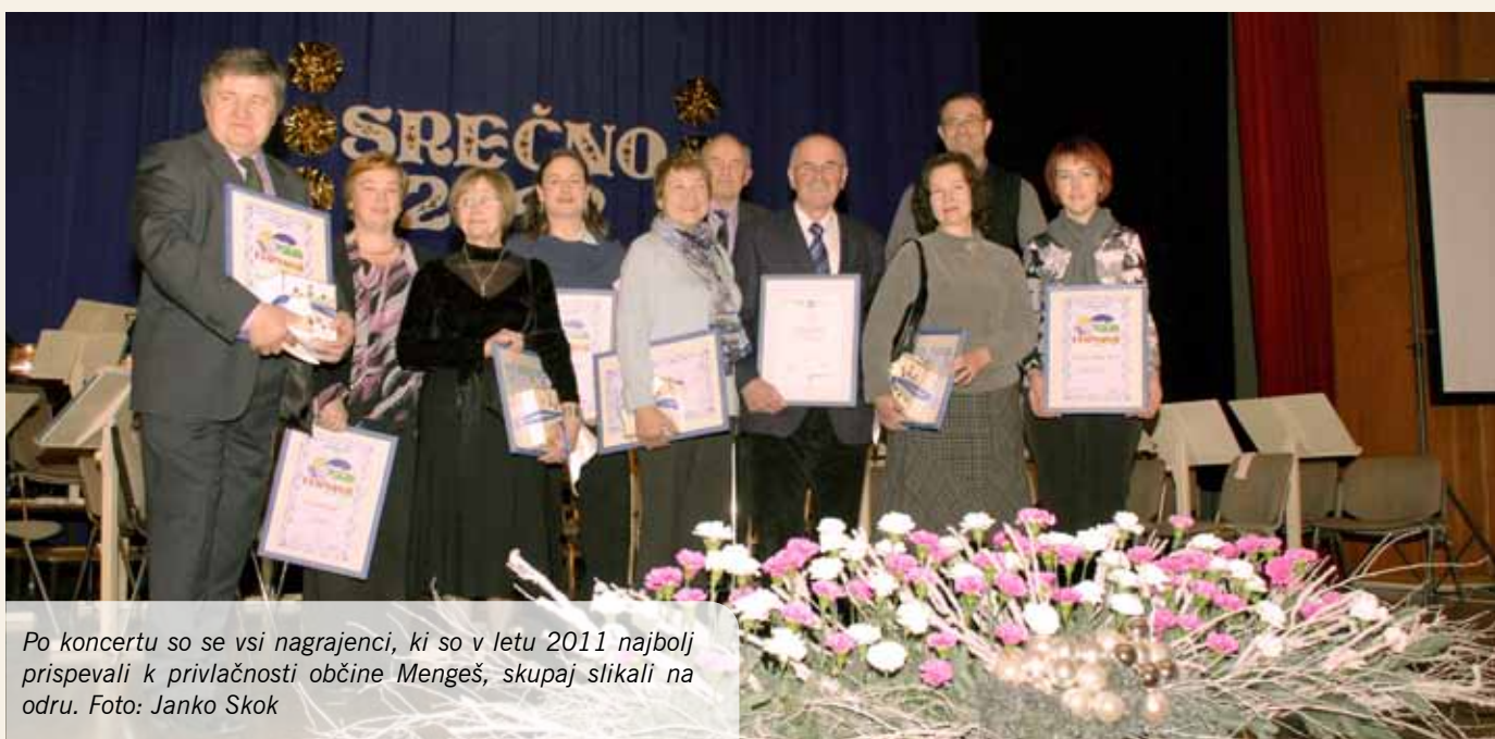
Po koncertu so se vsi nagrajenci, ki so v letu 2011 najbolj prispevali k privlačnosti občine Mengeš, skupaj slikali na odru.