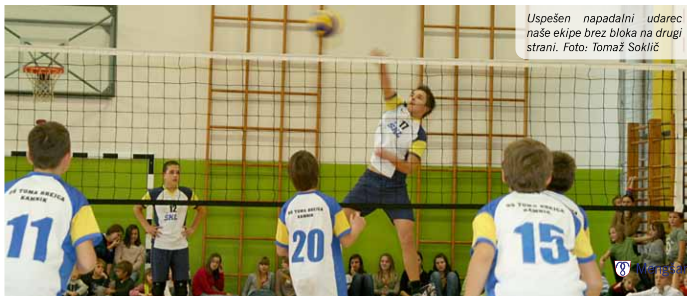
Uspešen napadalni udarec naše ekipe brez bloka na drugi strani.

Aleš Koštomaj, trener in učitelj ŠVZ na OŠ Mengeš