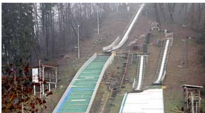
Vse tri skakalnice so pripravljene na zimo. Prekrite so z zaščitno prevleko in poletvane, tako da le nestrpno čakamo na prve centimetre snega.