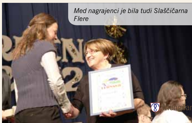
Med nagrajenci je bila tudi Slaščičarna Flere