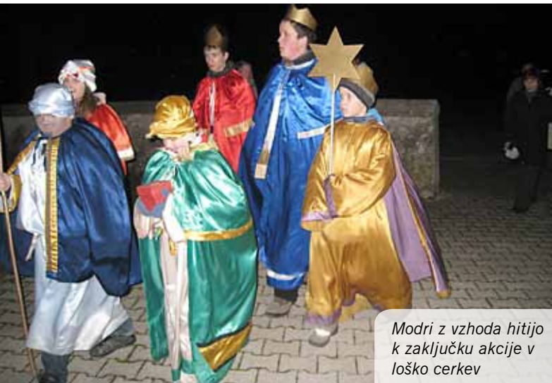
Modri z vzhoda hitijo k zaključku akcije v loško cerkev

Dolga procesija, z glasno molitvijo, se je v soju bakel vila skozi temo proti streljaj oddaljeni cerkvici, iz katere je zvenelo pritrkavanje in kjer smo se kolednikom zahvalili