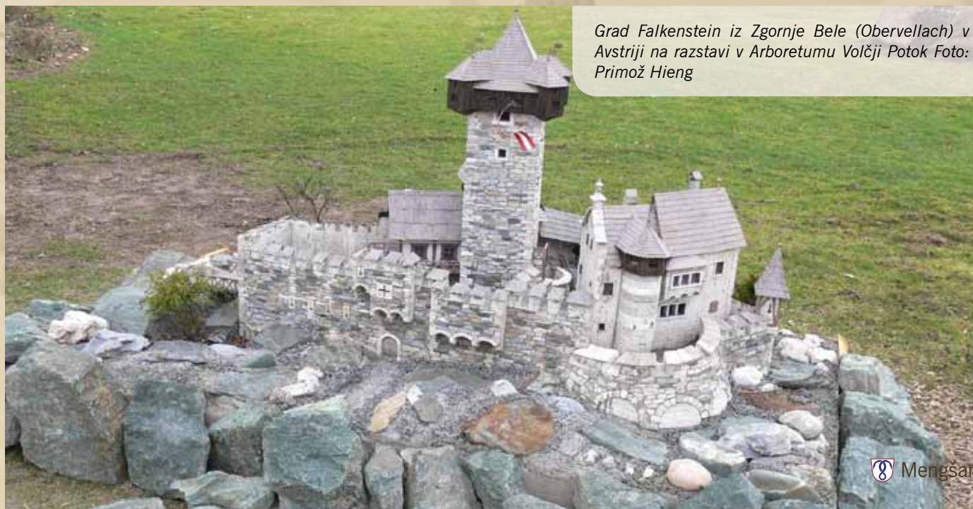
Grad Falkenstein iz Zgornje Bele (Obervellach) v Avstriji na razstavi v Arboretumu Volčji Potok