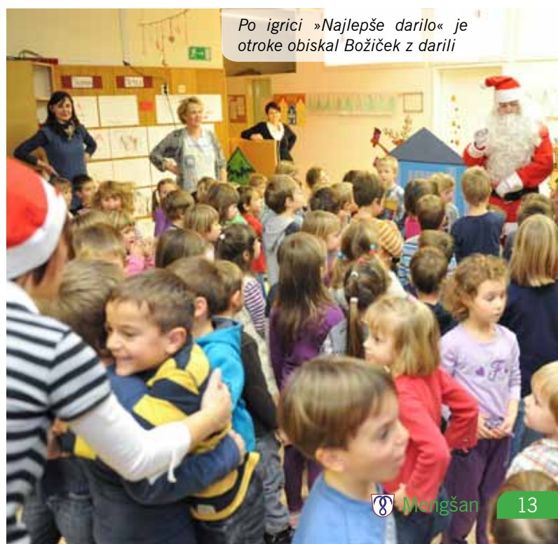
Po igrici »Najlepše darilo« o je otroke obiskal Božiček z darili

Besedilo: Tanja Burja