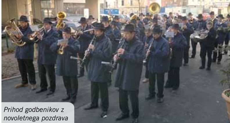
Prihod godbenikov z novoletnega pozdrava

December je ponavadi bolj vesel mesec, za godbenike pa delaven, poln vaj in koncertov. Letošnji tako ni bil nobena izjema.