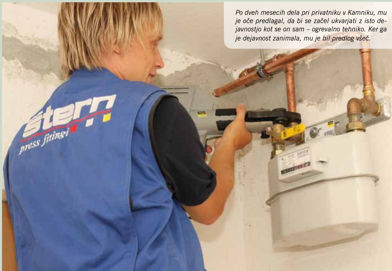
Po dveh mesecih dela pri privatniku v Kamniku, mu je oče predlagal, da bi se začel ukvarjati z isto dejavnostjo kot se on sam – ogrevalno tehniko. Ker ga je dejavnost zanimala, mu je bil predlog všeč.