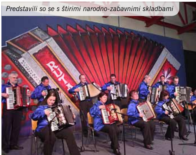
Predstavili so se s štirimi narodno-zabavnimi skladbami