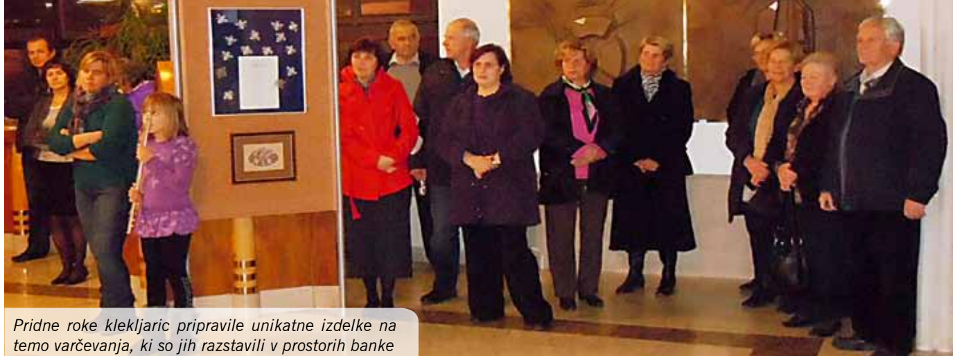
Pridne roke klekljaric pripravile unikatne izdelke na temo varčevanja, ki so jih razstavili v prostorih banke