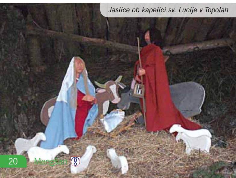
Jaslice ob kapelici sv. Lucije v Topolah