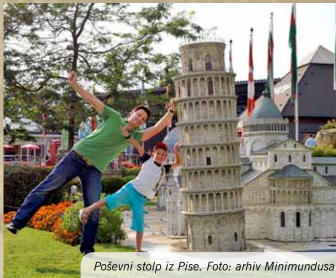
Poševni stolp iz Pise.

Park je zelen in prav vsak obiskovalec si lahko najde klop v senci, kjer si odpočije. Odpravite se lahko tudi v restavracijo, trgovine s spominčki, na sladoled ali le na otroška igrala, na voljo vam je prav vse. Dobro je vedeti tudi to, da je infrastruktura parka prirejena za vozičke, pa naj bodo otroški ali