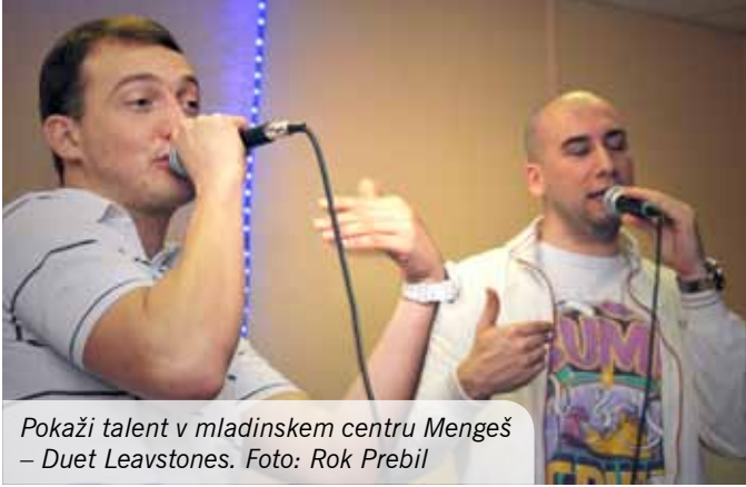
Pokaži talent v mladinskem centru Mengeš – Duet Leavstones.