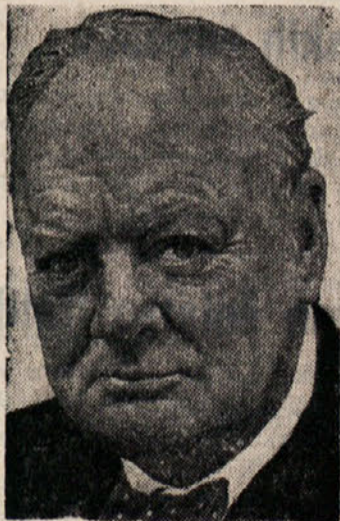
Sir Winston Churchill

S Churchillovo odločitvijo pa vsaj zaenkrat padejo v vodo tudi pričakovanja tistih krogov, ki so bili mnenja, da bi bil zdaj najbolj ugoden trenutek za prenos oblasti na sedanjega zunanjega ministra Edena, kateri bi si v enem letu vladanja do prihodnjih volitev (verjetno leta 1955) lahko nabral potrebne izkušnje v vladnih poslih. Izgleda, da je Churchill odločen,