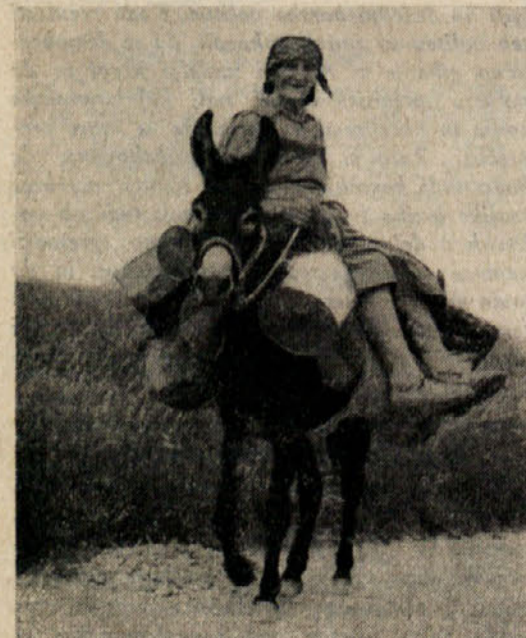
Značilna slička iz istrske pokrajine

V devetih letih jugoslovanske vojaške uprave je na področju šolstva bilo ogromno narejenega. O tem pričajo številne nove zgradbe, ki so vprašanje pomanjkanja šolskih prostorov tako za slovenske kot za italijanske šole že znatno omilile. Ogle-