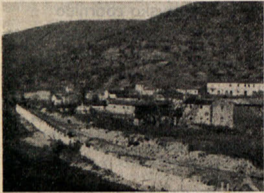
Gradnja nove ceste pod vasjo Rižana

En dan svojega letošnjega dopusta, ki sem ga v prvih jesenskih dneh preživljal ob lepi slovenski obali Jadrana, sem izkoristil tudi za to, da sem obiskal tovariše v uredništvu »Slovenskega Jadrana«. Že poleti je uredništvo našega lista prejelo njihovo povabilo, naj pridemo za nekaj dni k njim v goste, da spoznamo življenje, ljudi ter gospodarski, kulturni in politični razvoj v — tedaj še — coni »B« Svobodnega tržaškega ozemlja, ki pa je