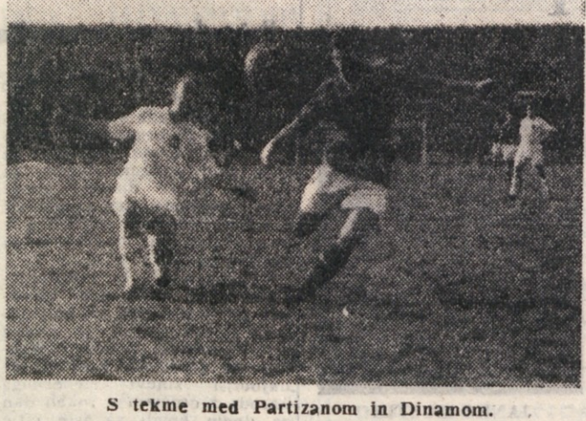
S tekme med Partizanom in Dinamom.

Potem se je urno in krohotačje se umaknil zamahu njene žajgle.