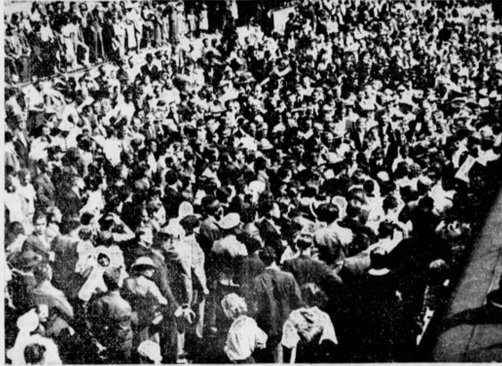
Tako so Celjani pričakali češke Orle na kolodvoru