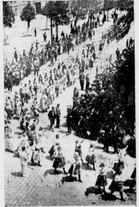
Češke Orlice odzdravljajo