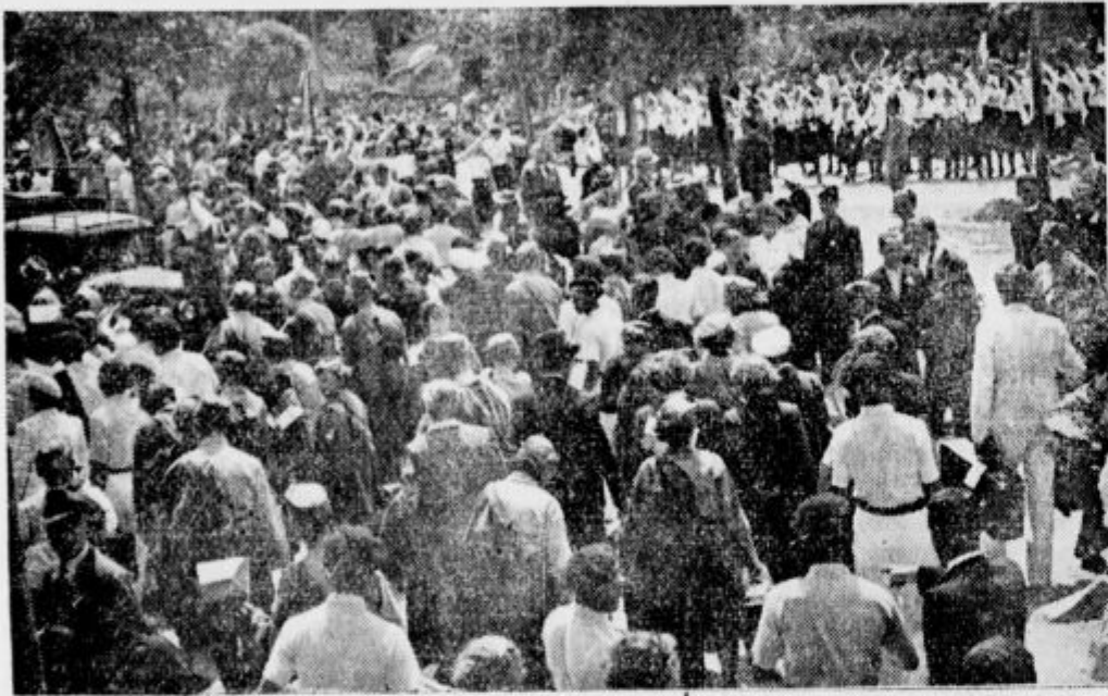
Množice navdušeno pozdravljajo češke Orle pred kolodvorom