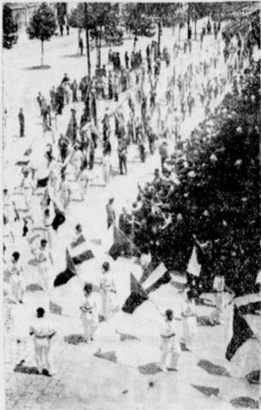
Bratske zastave vihrajo