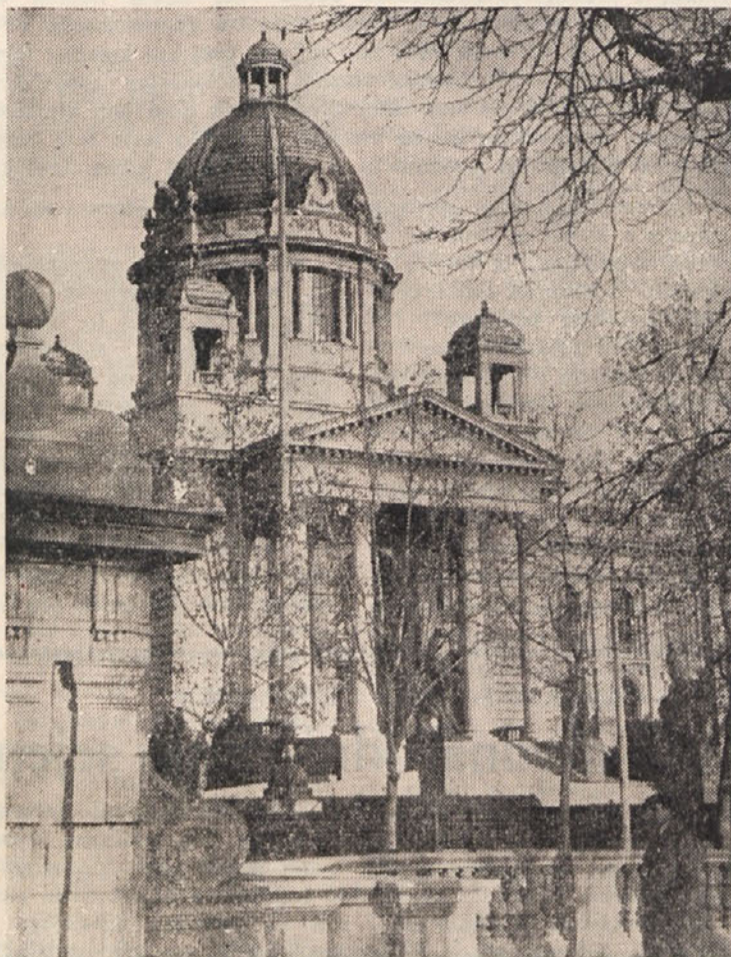
Sedanja napetost v svetu opozarja:

Zato so v teh dneh oči sveta uprte v Beograd, kjer se danes začne konferenca šefov izvenblokovskih držav, v katero pretežno del človeštva stavi upanje, da bo z mirnimi sredstvi in pogajanjem mogoče doseči mednarodno sodelovanje pri reševanju resničnih svetovnih vprašanj, kar bi ljudem odprlo svetle perspektive v dnevih, ki jih zasenčujejo grozeči oblaki atomske smrti.