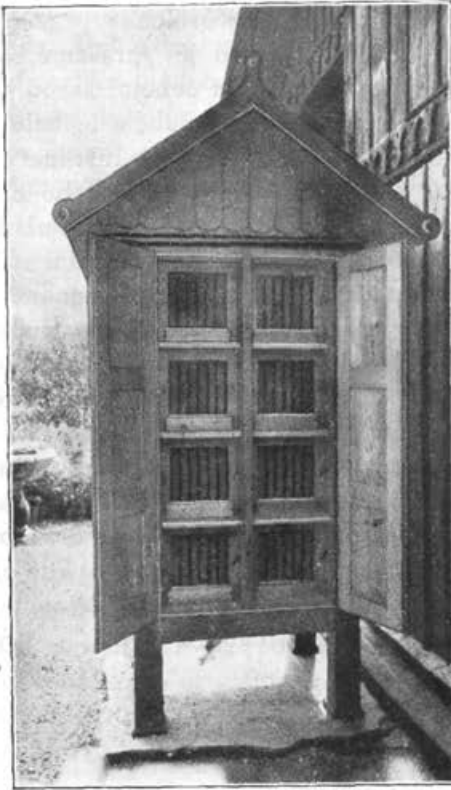
Notranjščina paviljona. Razdeljen je za 8 rojev A.-Ž. panjeve mere ali pa se lahko priredijo v njem 4 družine z mediščem.

2. Paviljon mora imeti krajne stene z dvojnimi pažem, prazen prostor med ste-