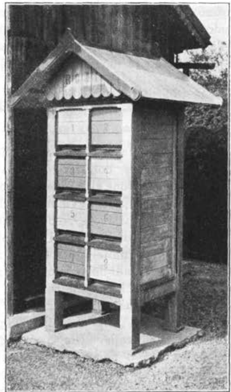
Paviljon A.-Ž. panjeve mere za 8 rojev.

Pri nas v Sloveniji bi paviljonsko čebelarstvo prišlo v poštev kvečjemu na šolskih vrtovih in pri takih zasebnikih, ki imajo nekaj vrta, a jim ni do čebelarstva v večjem obsegu, temveč le za domačo zabavo in opazovanje čebelnega življenja. Poudarjam pa, da je treba tudi pri takem malem čebelarskem obratu znanja, kako s čebelami ravnati. Treba se je o tem že poprej poučiti, kar lahko dosežemo s citanjem dobrih čebelarskih knjig in našega »Slov. Čebelarja«.