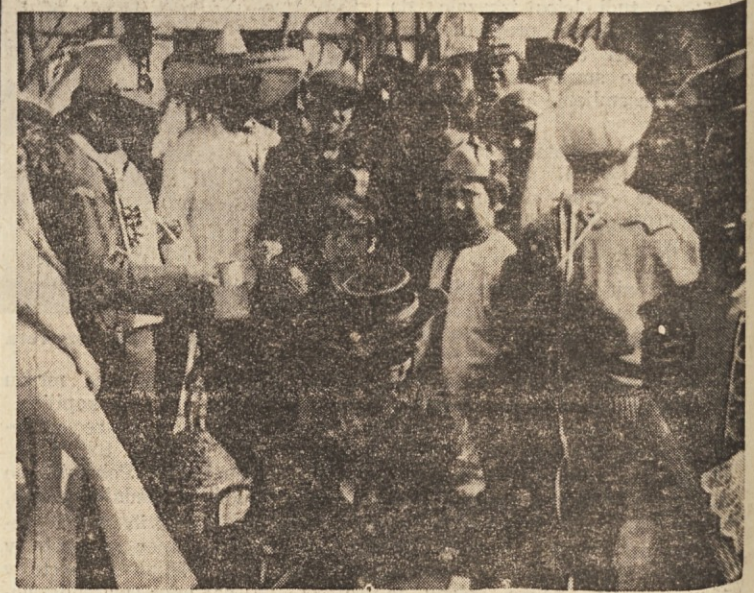
Slika s pustovanja v Mačkovišah