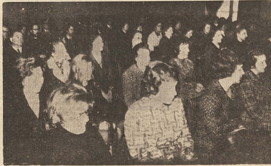
Pogled na del udeležencev seminarja za slovenske šolnike v Gorici

V Gorici se je včeraj pričel četrti seminar za slovenske šolnike. Pr. Sirk ugotovil postopno ranje pravnega položaja šolnikov