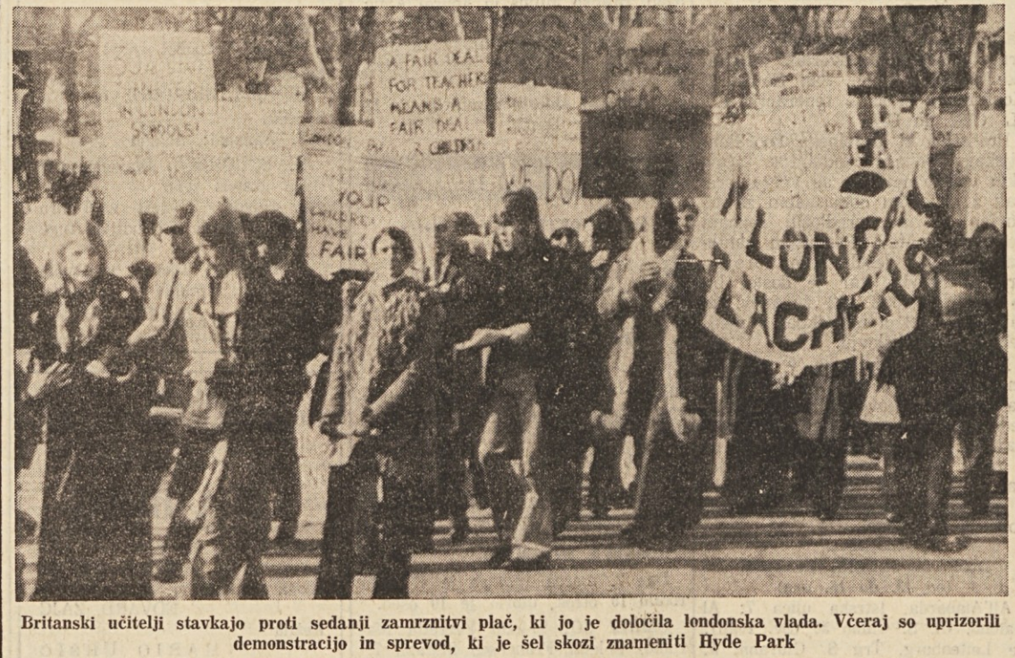
Britanski učitelji stavkajo proti sedanji zamrznitvi plač, ki jo je določila londonska vlada. Včeraj so uprizorili demonstracijo in spreved, ki je sel skozi znameniti Hyde Park

RIM, 7. — Minister za delo Coppo je imel danes dopoldne ločene sestanke s predstavniki zasebne kovinarske industrije in kovinarskih sindikatov. Popoldne pa je bil ob navzočnosti