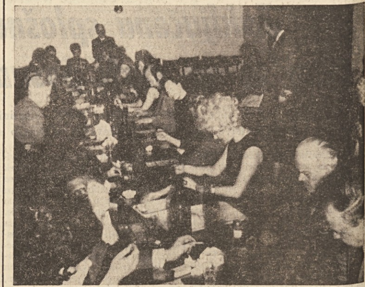
Slovenski klub je za pustni večer priredil tradicionalno tombolo, kjer pa ni manjka kozarček domačega