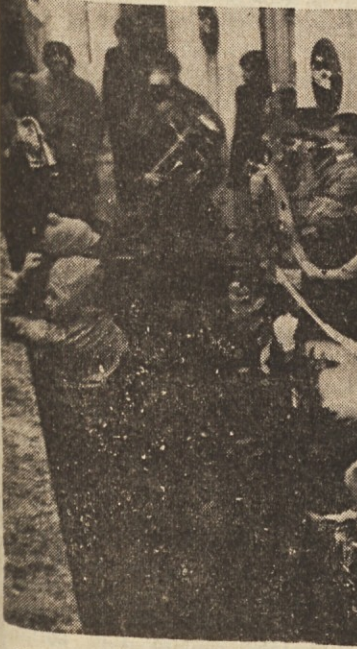
V Ricmanjih je bil pust ves dan na parah pred Kuretovo gostilno. Zvečer so ga zažgali. Zalostinke je igrala domača godba na pihala

V koloni so bili tudi tanki, topovi in helikopteri kot nekakšna demonstracija proti vojnim žariščem