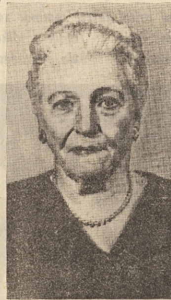
kjer prikazuje Ameriko, njene probleme in ljudi. Največji uspeh so ji prinesle, kot rečeno, knjige s kitajsko tematiko.

V visoki starosti 80. let je v Dengbinqihu umrla svetovno znana pisateljica Pearl Buck, ki je napisala vrsto del, nanašajočih se v glavnem na Kitajsko in njene ljudi.