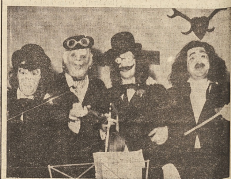
Zares odlični «orkester», ki ga je za letošnji pust sestavila skupina fantov od Ferlugo