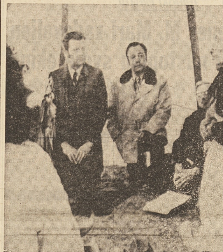
Indijanci, ki so prejšnji teden zasedli vasico Wounded Knee so postavili nove pogoje za preinititev svoje manifestacije. Zahtevali so odstranitev predsednika rezervata v Pine Ridgeju in načelnika urada za indijanska vprašanja. Na sliki: indijanski voditelji med pogovorom z washingtonskimi funkcionarji

MILAN, 7. — Milanski preiskovalni sodnik dr. D'Ambrosio, ki vodi preiskavo o pokolu na Trgu Fontane je danes zasljal v zaporu fašističnega založnika Venturo.