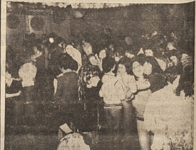
Veselo so se za pust zabavali tudi v dijaškem domu