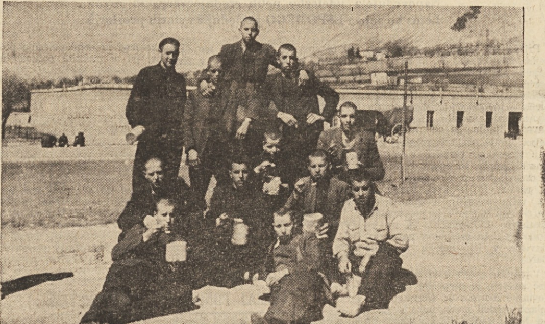
Skupina fantov iz Doline in Boljunca v vojašnici v Aquili. Edino kar jih na zunaj «veže» z vojsko, glava ena balina in «gavetta»

Pobrali so vse mladeniče iz letnikov 1924, 1925 in 1926 - Tistega dne harmonika ni pela - Najprej v Aquilo, nato v Foggio in drugam na jug. - Trpljenje, lakota, bombe - Jutri zvečer se bodo preživeli sestali na družaben večer v gostišču v Dolini