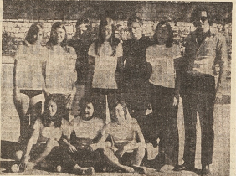
Na odbojarskem turnirju prijateljstva bo sodelovala tudi ženska ekipa Kontovela

V večeršnjih zahvali sodelavcem pri organizaciji letošnjih 7. ZSI je pomotoma izostalo ime Oda Kalana. SPDT se mu za to opravičuje in se tudi njemu zahvaljuje za pomoč pri izpeljavi te manifestacije.