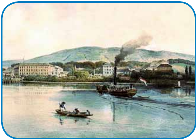
Prvi parni šift na Balatoni je ime po pesniki Károlyi Kisfaludyni daubo; od leta 2014 se - v gnakoj formi - pá pela po vodej

V etom cajti so se naraudile ideje, štere so po evropskoj ino merkanarskoj minti najvekšo mauč mele v vogrskoj politiki. »Liberalci« so terdjali gnake porce ino pravice za vse, cuj pa eške slobaudne novine, vöre ino društva, »centralisti« so želejli eden vogrski rosag brezi županij. »Stari konservativci« so steli gordržati indašnji sistem brezi reform, zmejs so pa »nauvi konservativci« želejli pomalek naprej stapati.