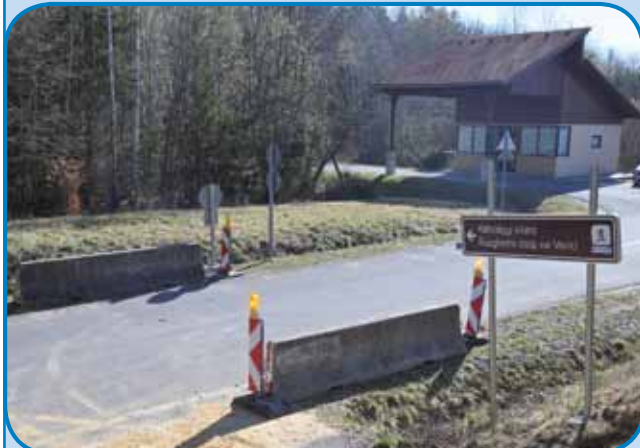
Odstranili so fizične prepreke, kar pa seveda ne pomeni, da lahko kdorkoli in kadarkoli prestopi mejo