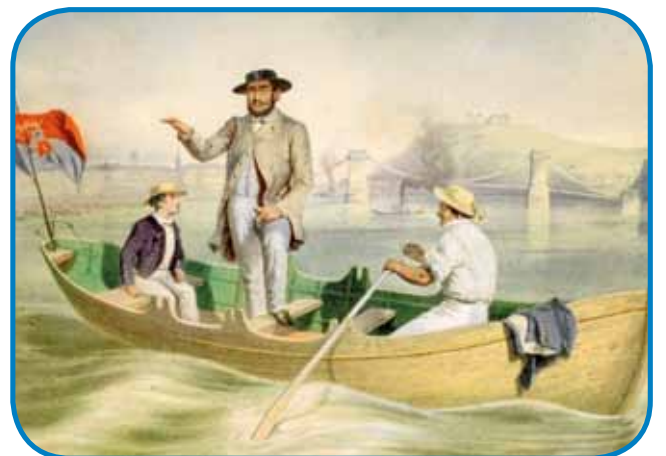
István Széchenyi s svojim sinaum Bélanom pred nauvim peštarskim maustom »Lánchídom«

V prvaj polovici 19. stoletja so gornajšli dva nauviva mašina: šift ino cug na paro. Prva redna linija na Donavi je začnila leta 1831 voziti med Bečom pa Budov, de so pa takše šifte malo kisnej nücali na Tisi, Dravi, Savi ino Balatoni tó. Leta 1846 je prvi parni