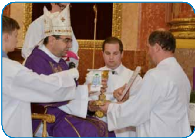
Pred sombotelskim škofom Jánosem Székelyem

Lani 8. decembra je sombotelski škof János Székely skupaj