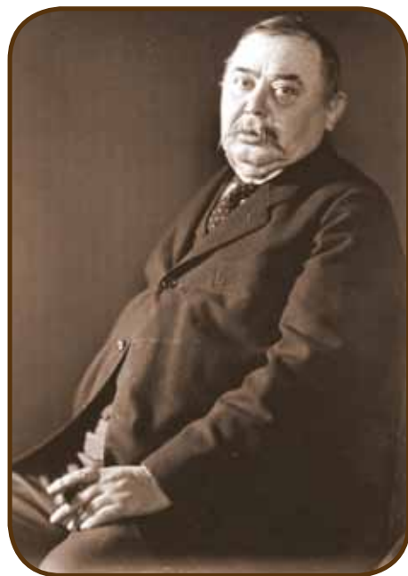
28. majüša miné 110 lejt od smrti vögrskoga pisatela, novinara ino parlamentarnoga poslanca Kálmána Mikszátha (1847-1910). Zavolo jubileja smo vam dojobrnavili ništerne njegve novele s knig »A jó palócok«, s šterimi je pisatel leta 1882 rejsan eričen grato. Tau so kratke pripovejsti, štere nutpokažejo (dostakrat tragičen) žitek pavrov v Mikszátha rodnoj krajini. Vidli te, ka bi se leko vse tau godilo - eške nej tak davnik - v našom Porabji tö ...

Njeni glas je méki ino žalosten, segne do srcá kak igrauta, štera, gda že táméra, eške itak cinga v lufti, ka bi vsikšoga ino vse spremenila.