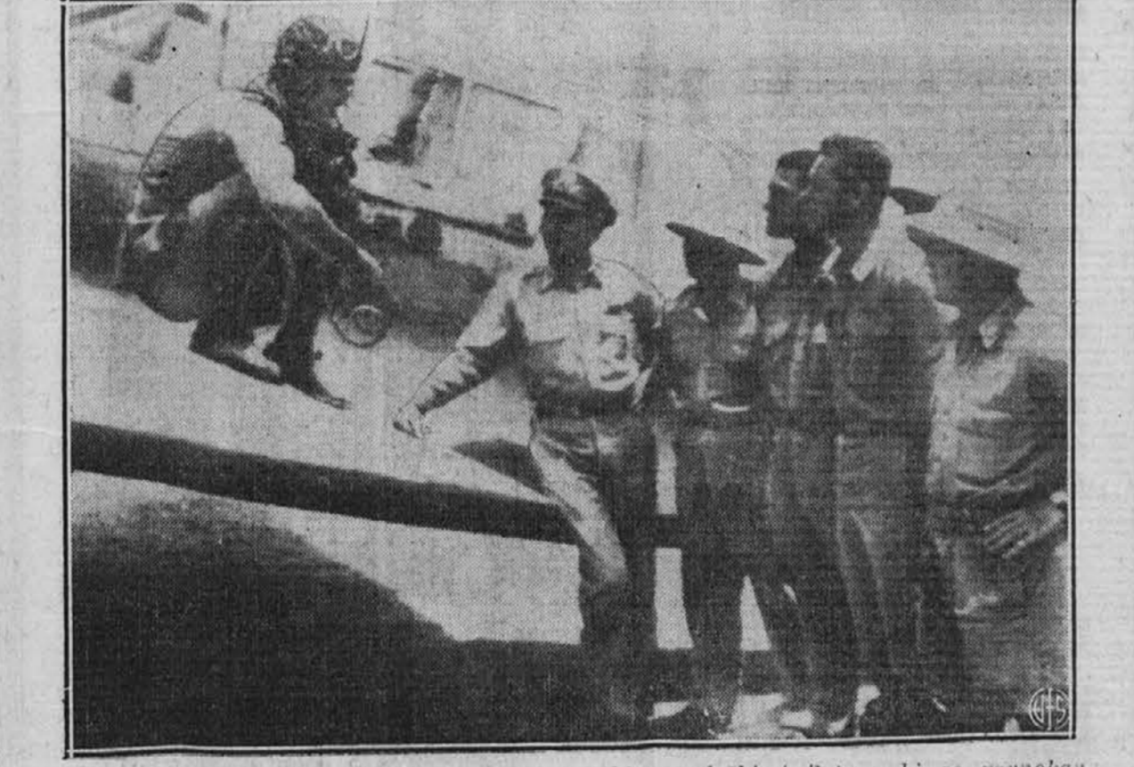
Skupina ameriških pilotov v pogovoru z nekim angleškim pilotom, ki se ravnokar vrnil z "obiska" nad osiškimi postojankami v Egiptu. Ameriški polkovnik, ki poveljuje ameriškim letalcem na afriškem bojišču, sloni ob krilu letala poleg njega pa so ameriški letalci.

BLISS COAL CO. PREMOG IN DRVA Zastopstvo WHITING STOKERS 22390 LAKELAND BLVD. KENmore 0808