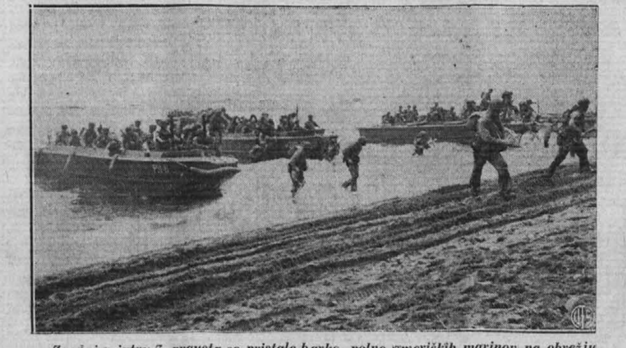
Zgodaj v jutru 7. avgusta so pristale barke, polne ameriških marinov na obrežju enega izmed Solomonskih otokov. Predno so se Japonci na otoku dobro zavedli, so jim bili ameriški marini za vratom. Slika kaže izkrcavanje ameriških marinov na Solomonskem otočju.