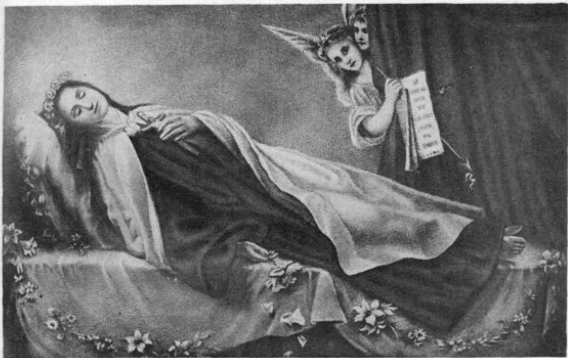
Sv. Mala Terezija na mrtvaškem odru.

»Zdaj je stvar pač lahka, ko vemo za ime in priimek dekletov. Pojdite jutri na avstrijski konzulat in tam vse še enkrat povejte in naročite, da naj konzul nemudoma piše na župni urad v Alservorstadt na Dunaj in naj zahteva krstni list za mladenko, ki je dobrih