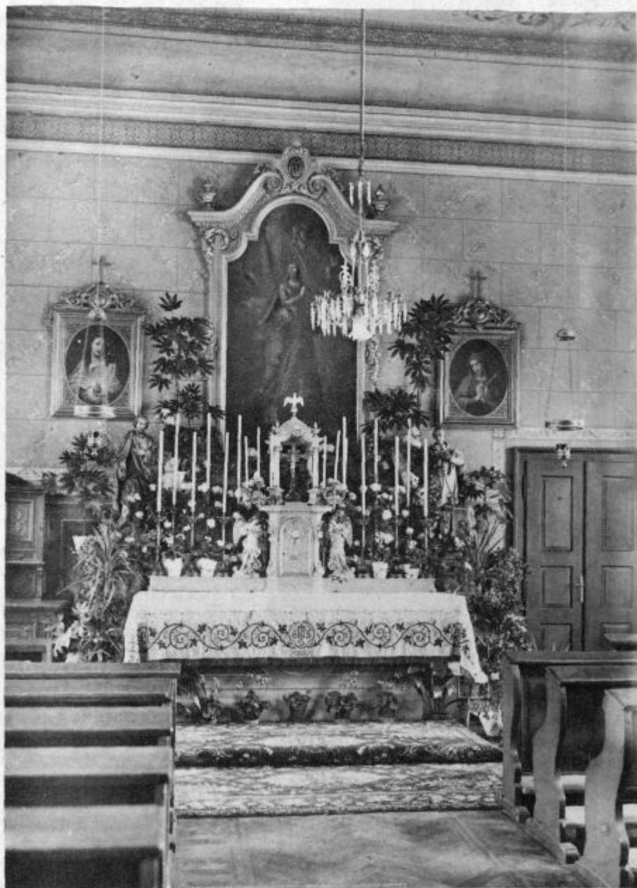
Kapela v ljubljanskem duhovnem semenišču, kjer so se pred 75 leti prvič obhajale šmarnice.

Prosim torej, da bi se me usmilili in mi pomagali. Prosim, da bi me sprejeli v sv. katoliško Cerkev in me krstili, če še nisem krščena. Nazaj k Arabcem ne grem več, ker to