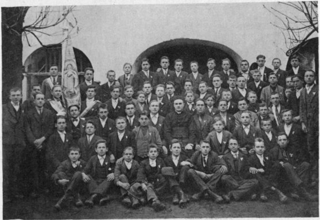
Fantovska Marijina družba v Metliki.

Hkrati pa naj bo ta »roman« v svarilo našim mladim dekletom, ki prihajajo v Egipt, da se tukaj ne poizgube, kar se žalibog večkrat prigodi.