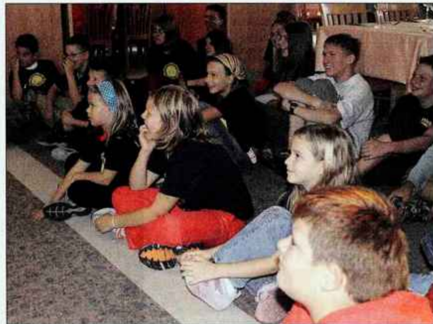
Otroci so bili navdušeni nad Sončkovim živžavom.

Kranjska Gora z okolico jim nudi obilo možnosti za aktivno preživljanje prostih trenutkov, sicer pa so zanje pripravili naravoslovno, planinsko in adrenalinsko obarvane taborne, medtem ko otroci v zadnji skupini snemajo film in ustvarjajo risanko. Minuli petek jim je letovanje s prireditvijo Sončkov