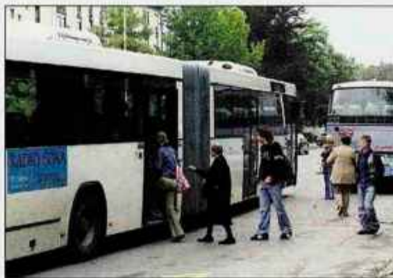
Ukinitve skupnih vozovnic Integrala Tržič in Alpetourja bo prizadela predvsem dijake in študente.

bus. Kakorkoli že, zadeva se bo očitno uredila, saj se nam slej ko prej obeta uvedba skupne vozovnice za celotno državo," je pristavila.