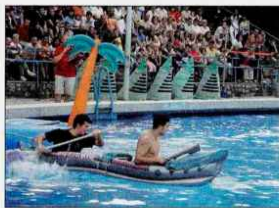
Kljub vsem zapletom so v soboto v Tržiču vendarle izpeljali igre brez meja.