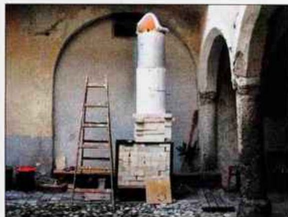
Tri metre visoka peč je po opravljenem delu ostala v spomenu na fotografiji.