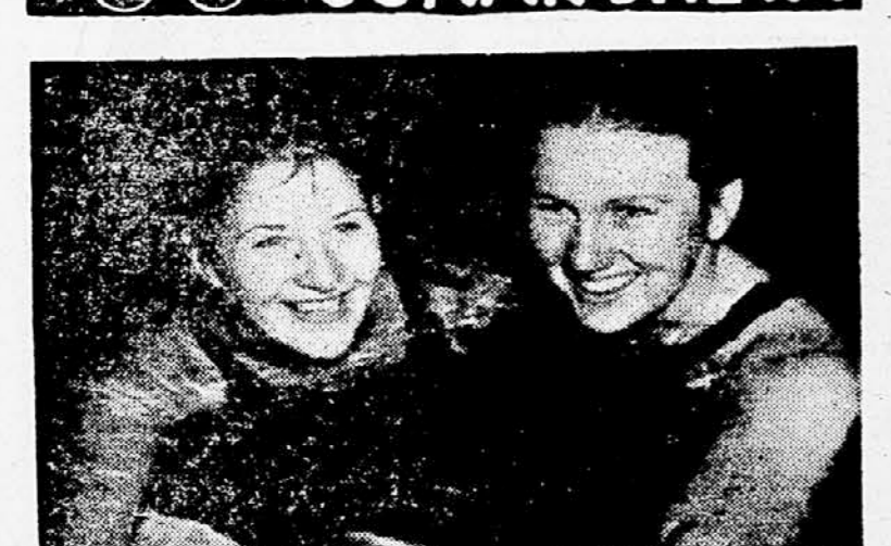
Avstralki Fraserjerja in Crappova — najboljši plavalci sveta