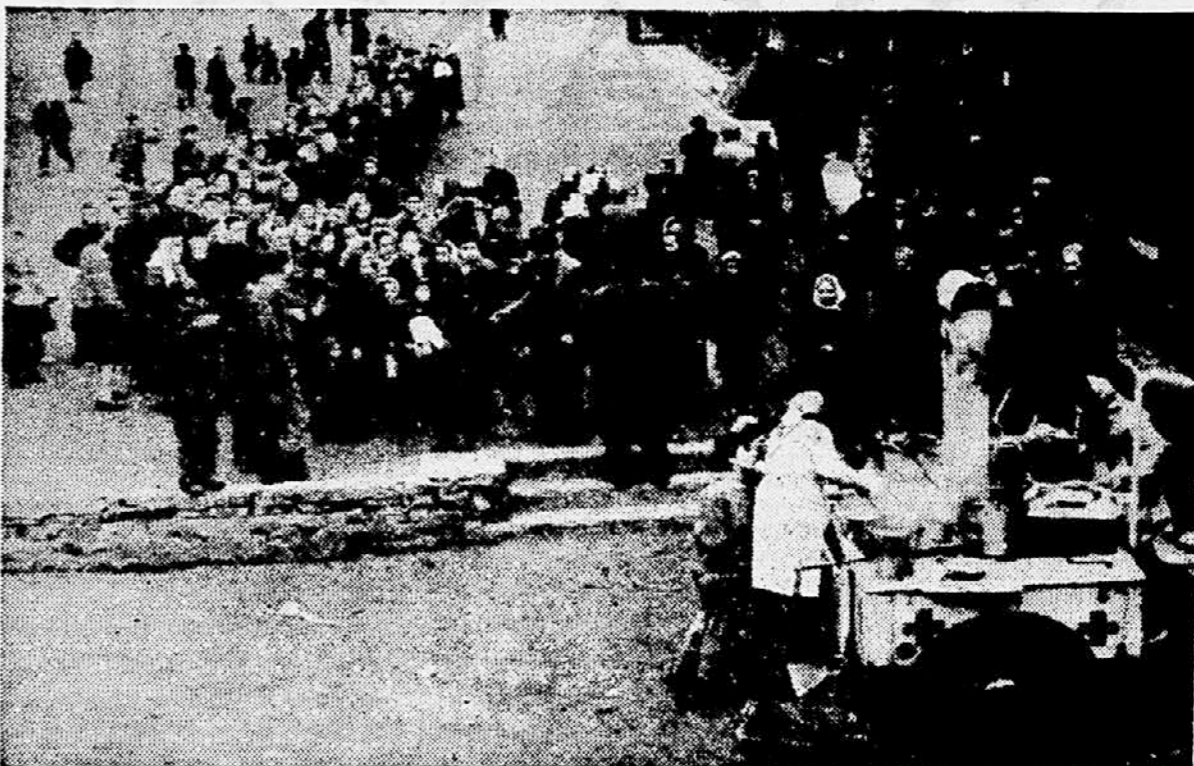
Prehivalstvo Budimpešte je hudo prizadeto. V mestu primanjkuje hrane. Zato je Rdeči križ organiziral prenosne kuhinje, ki delijo najpotrebnejšim tople obroke

Delegat Velike Britanije Pierson Dixon je izjavil, da morajo Združeni narodi, ki iščejo rešitev sušeskuemu problemu, paziti, »da ne bi odprli Srednji vzhod sovjetskemu komunizmu«. Dejal je tudi, da se bodo anglo-francoske sile kmalu umaknile iz Egipta in da bi tudi Sovjetska zveza morala umakniti svoje čete iz Madžarske. Nato je britanski delegat zavrnil egiptovske trditve, da so britanske in francoske sile razrušile Port Said in blokirale Sueški prekop.