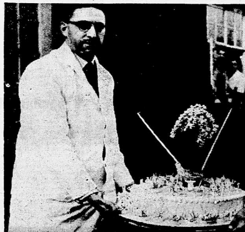
Winston Churchill, ki je 29. novembra praznoval svoj 82. rojstni dan, se poslali in bližnje družinske člane, ki je vidno na sliki.