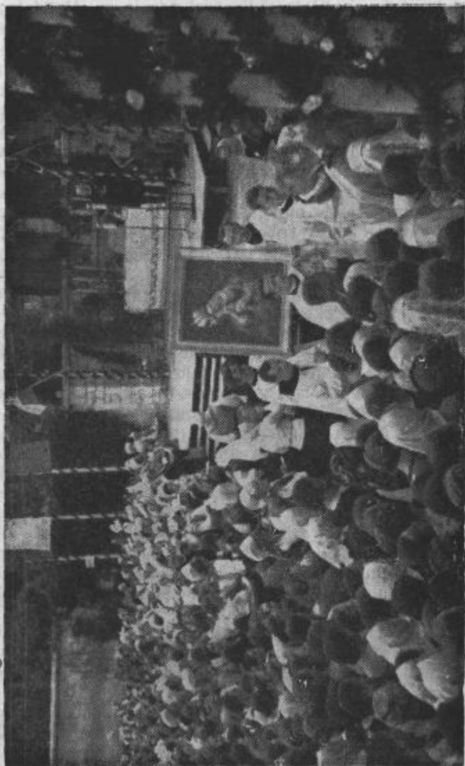
Veličastni prvi tabor katoličanskih mladenk na Brezjej. Po končanoj službi božoj so med tem, kda je vsa vnožina listiva tiho mahala z robčeki, odnesli Najsvetejšeji i podobo brezjanske Marije Pomagaj v slovesnom sprevodi nazaj v cerkev.

Treseti let je Bog naklono svojim angelom, da so gledali te prizor, da spomin na njega ostane vsa stoletja. Treseti let je živela Marija Magdalena med delom spokorjenja i poveličanim