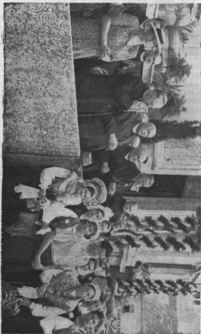
Dekliški tabor na Brezljaj.

predstojnikov pa je navajaš, da zasmehavajo njihove opomine. — Ti, B. si tat, ki z nesramnimi govori kradneš dušam nedužnost. — Ti, C. si ropar, ki z listki, s knjigami, v skrivališčih ropaš Mariji njene sinove. — Ti, D. si hūdobni dūh, ki pohūj-