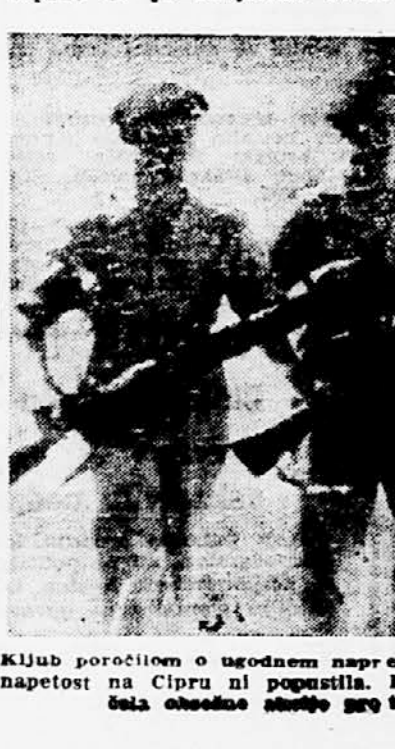
Kljub poročilom o ugodnem napredku grško-britanskih pogajanj napetost na Cipru ni popustila. Britanska policija je te dni začela obsežno iskanje orožja in eksplozivnih materialov.

Rim, 12. dec. (Tanjug). Minister za zunanje zadeve Martino je dejal sinoči na kongresu liberalne stranke, da italijansko ministristvo za zunanje zadeve, odkar ga vodi on, nikoli ni izgubilo izpred oči združitve Evrope. Skupno tržišče, ki bo v kratkem organizirano, bo narokovalo najprej skupne finance, nato pa tudi meddržavne organizacije, ki bodo privedli do združitve Evrope. Morda bo pot drugačna in daljša kot si jo je bila zamislila evropska obramba-