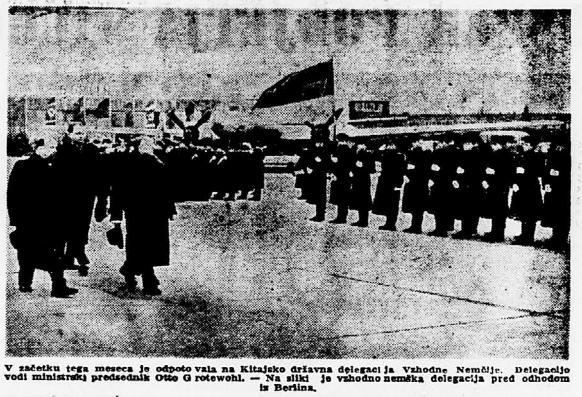
V začetku tega meseca je odpotovala na Kitajsko državna delegacija. Vzhodno Nemčije. Delegacija vodi ministrski predsednik Otto Grotewohl. — Na sliki je vzhodno nemška delegacija pred odhodom iz Berlina.