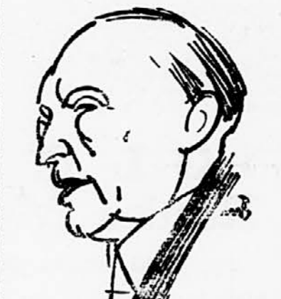
no ni točen, ker bo 6. februarja prišel v Bonn na uradni obisk predsednik italijanske vlade Segni.

Ta otrok in drugi otroci njegovega plemena in generacije, so problem za vsa država. Pred približno osemnajst meseci je devet sodnikov Vrhovnega sodišča soglasno sklenilo in mu sporočilo, da ima po ustavi pravico hoditi v isko šolo in se učiti pri istih učiteljih, kot beli ameriški otroci njegove starosti. Leto pozneje je Vrhovno sodišče znova sprejelo, ko je dvanaest mesecev pošiljalo zmedeno pismo in navzven, ki so prihajali od vseh prizidkih. To por je poučeno, da je treba plemenske