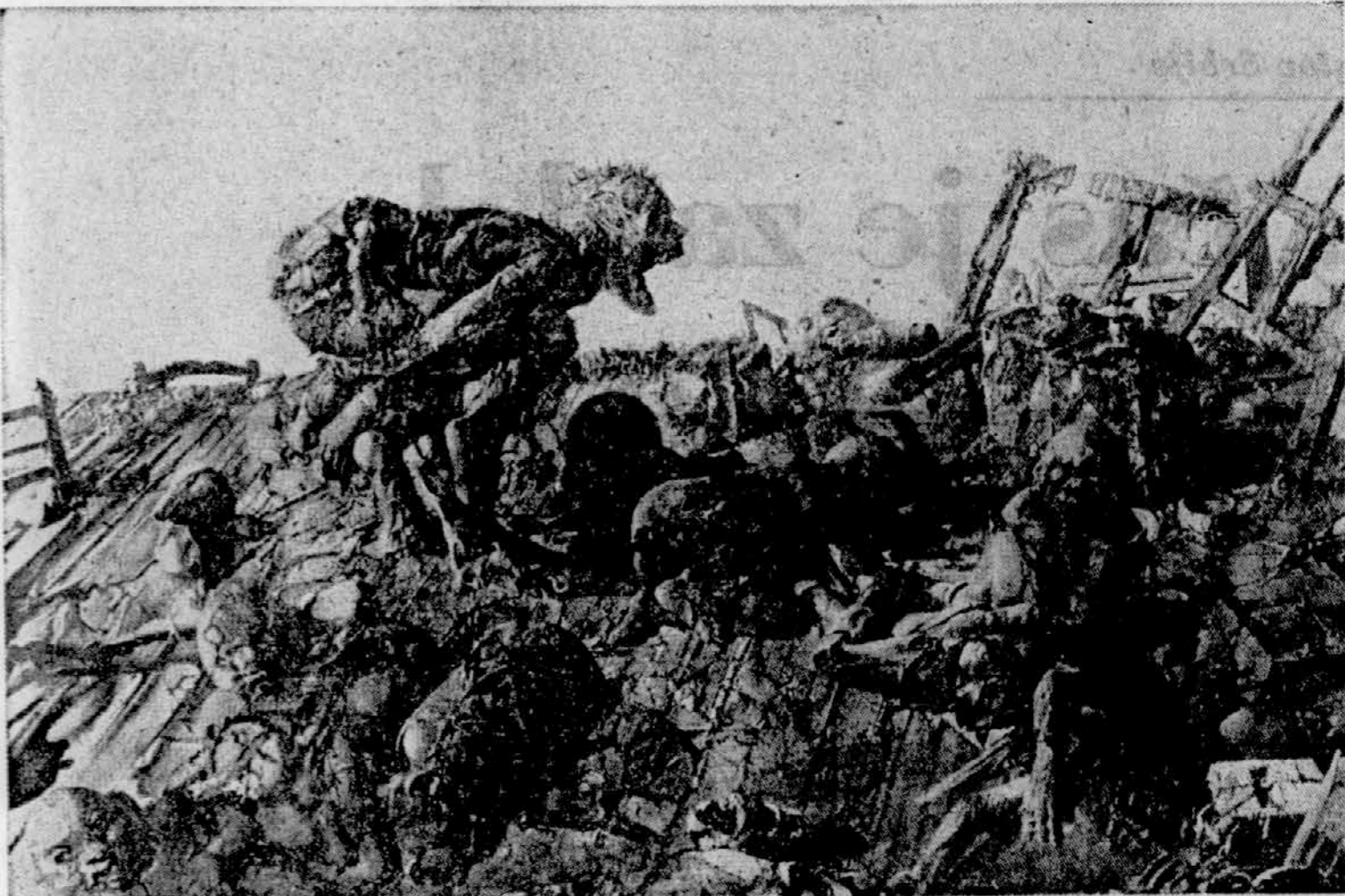
DADO: ATELJE (olja, 1971)