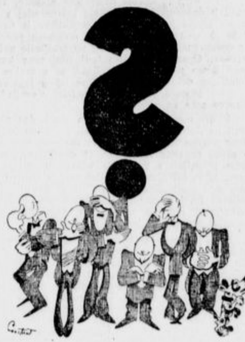
Razpoloženje na konferenci.

Predsednik Lebrun je otvoril šolo za urarstvo z govorom, v katerem se je dotaknil tudi mednarodnega položaja. Izjavil je, da je stabilna valuta podlaga blagostanja. Z nestalno valuto ni mogoče podpisati trajnih pogodb za bodočnost. Prav tako je izključena vsaka trajna carinska politika.