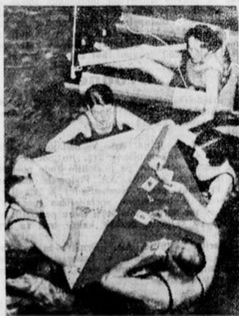
Američani kvartajo na morju.

Vsvezvezni kongres sovjetskih književnikov, ki bi se moral začeti 20. junija, je bil odložen do 10. septembra tega leta. Kongres so odložili, ker je bila priprava nanj preveč površna. Za vsvezvezni kongres sovjetskih književnikov pripravljajo mnogo poročil z ideološkimi predmeti. Še pred kongresom bodo sovjetski književniki razpravljali o umetniškem jeziku; to razpravo je izval članek Maksima Gorkoga „O prozi“. Razpravo so začel znani sovjetski književnik K. Fedin.