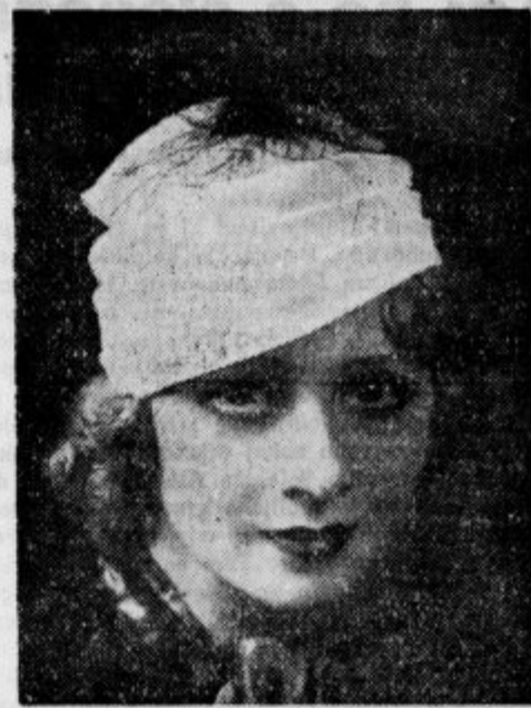
Parizanke nosijo še vedno »chechia«, to je klobuk iz belega blaga, nabranega v tri zgibe.

K prvemu poročilu je zapisal tole pripombo: »Bravo, Metternich! Dobro je izvedel to zadevo, ako izvzamem eno zelo važno točko. Poslanik je popolnoma izpregledal dejstvo, da ni dovoljeno sprejemati nesramnih zahtev angleških ministrov — četudi gre za zasebna mnenja — kadar bi ti bili radi miroljubni pod pogojem, da mi zmanjšamo svojo silo na morju. Podal se je na nevarno pobočje. Hud sem nanj. Treba mu je sporočiti, da jaz nikakor nočem sporazuma z Anglijo na škodo nemške mornarice. Če nam Anglija veličudno ponuja roko in dostavlja, da moramo zmanjšati našo mornarico, je to skrajna nesramnost, ki vsebuje hudo psovaje nemškega naroda in njegovega cesarja, ki jo mora poslanik odbiti a lmine. Ako dovolimo katerikoli tuji državi, da pod katerokoli pretvezo izpregovori o našem oboroževanju, potem nam ne preostane drugega, kakor da stopimo na pot nazaj, kakor Portugalska in Španija. Nemške mornarice nismo zgradili proti nikomur, niti proti Angliji, niti proti komu drugemu, zgradili smo jo, ker to zahteva naša potreba. Ali