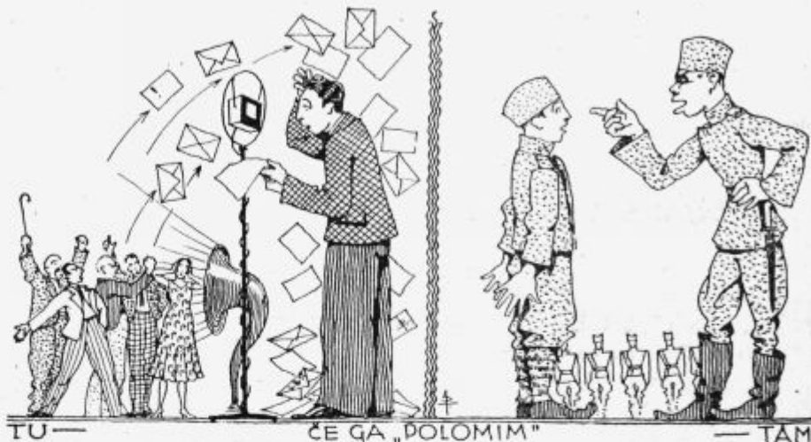
TU — ČE GA „POLOMIM“ — TAM

drugam. Bilo pa je tu v toliko boljše, da mi ni bilo treba samemu se gibati za pravočasnost, temveč da so za vse to poskrbeli drugi — jaz sem samo poslušal in vršil, kar je bilo rečenega. In če kaj ni bilo prav, sem slišal grajo enega, kvečjemu dveh, če pa človek pred mikrofonom kaj pogrši, čuje in čita kritiko neštetih glav, katerih vsaka je nedostake poslušala z obema ušesoma ter si njih obliko sila vestno utisnila v spomin. Nihče ne vpraša za vzrok, za povod take