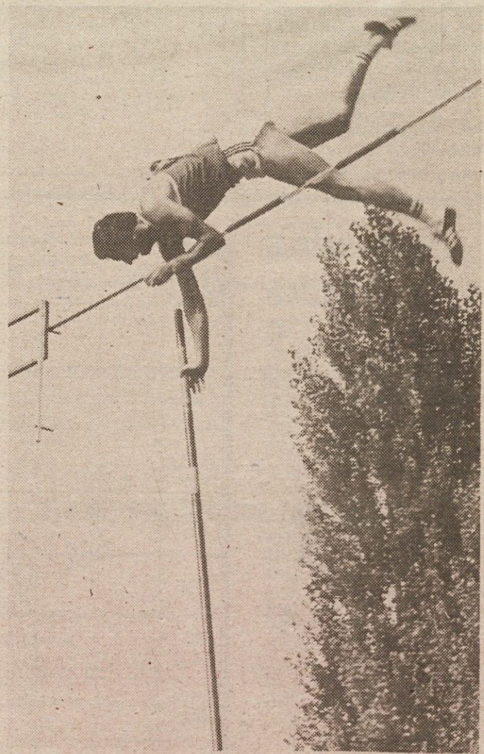
Konradova »specialnost« je športna fotografija. In prav pričujoči posnetek dokazuje njegov smisel in refleks v tej zvrsti

fija prijetna za pogled, torej kompozicijsko dovršena slika. Rad bi s fotografijo dosegel nekaj več, vendar je do umetniške fotografije pot zelo težka. Kljub temu, da sem dobil nekaj priznanj in diplom na naših razstavah v Emu, še vedno nisem dosegel tistega, kar želim. Kadar grem na sprehod ali na izlet, je moj najboljši tovariš fotoaparati. Tudi v Emu sem, kot mi pravijo, nekakšen »dvorni« fotograf. Karkoli se dogaja zanimivega, me pokličejo zraven. Moje osnovno pravilo ali moto, če hočete, pa je, napraviti fotografijo, ki je vseh tistemu, ki je na sliki in tistemu, ki jo naroči.«