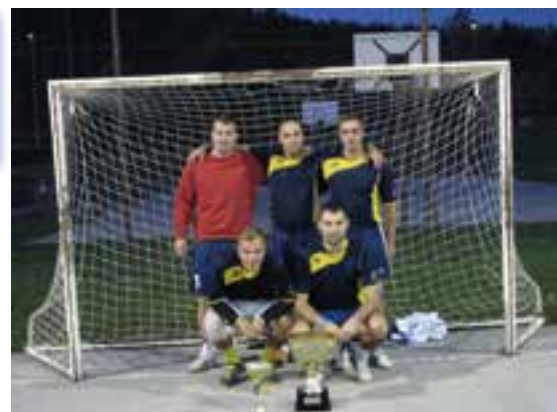
Ekipa Kovinarstvo Plank, ki je osvojila 1. mesto ter pokal občine Štore

Najboljše ekipe in posamezniki so ob zaključku sezone prejeli nagrade in pokale, ki jih je