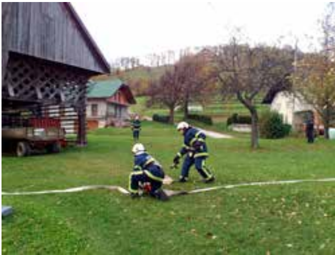
Taktična vaja na Svetini.