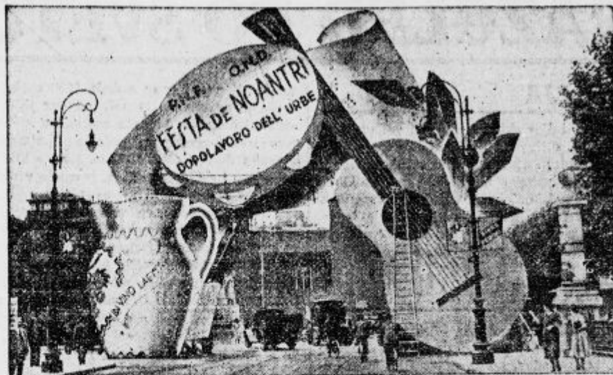
Vsako poletje praznujejo v Rimu nepretrgoma praznik poletja, za katerega so vse ulice ob obeh straneh reke Tibere slavnostno okrašene. Na sliki vidimo svojevrsten slavelok z znamenji veselja in razigranosti.