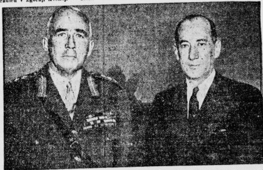
Poljski zunanji minister Beck in angleški general Ironside sta se prejšnji teden sešla v Varšavi in imela važen pomenek.