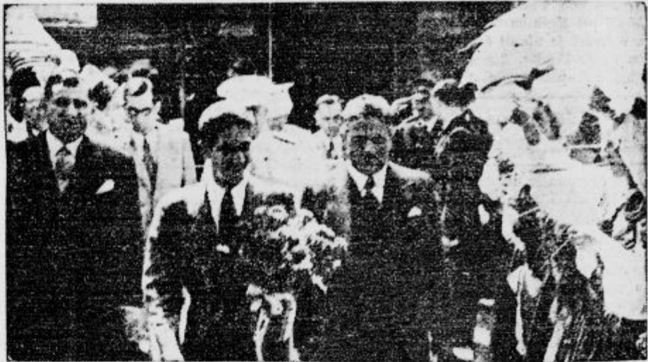
G. ban dr. Marko Natlačen spremlja kralja Petra skozi špalir navdušenih narodnih noš.