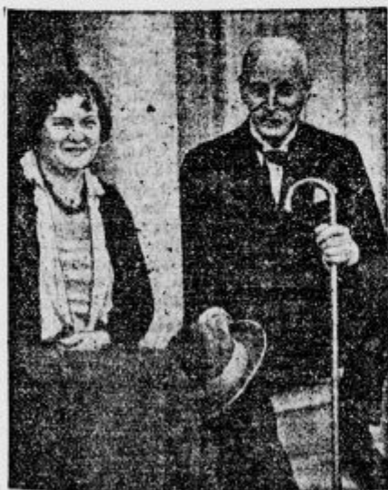
Knut Hamsun s svojo ženo na stopnicah svojega doma bo 4. avgusta praznoval 80 letnico svojega rojstva.