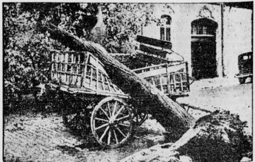
Kmet v Ameriki je vedril te dni. Medtem je ne vihta podrla drevo, ki je zdrobilo voz. Sreča, da sta bila voznik in konj na varnem

V Malobarju v Južni Indiji je izbruhnil ogenj v krasnem hinduskem templju. Domača požarna bramba pa je obstojala iz samih »sweeperjev«, kar bi se reklo po naše pometalcev, najnižje kaste v Indiji, takozvanih nedotakljivih. Brahmani imajo tolikšen stud pred njimi, da če le senca sweeperja pade na živč Brahmana, vrže jed proč. Duhovniki so zabranili vetop gasilcem, niti jim dovolili, da bi oddalec brizgali vodo v plamen in tako je dragoceni tempelj zgorel do tal.