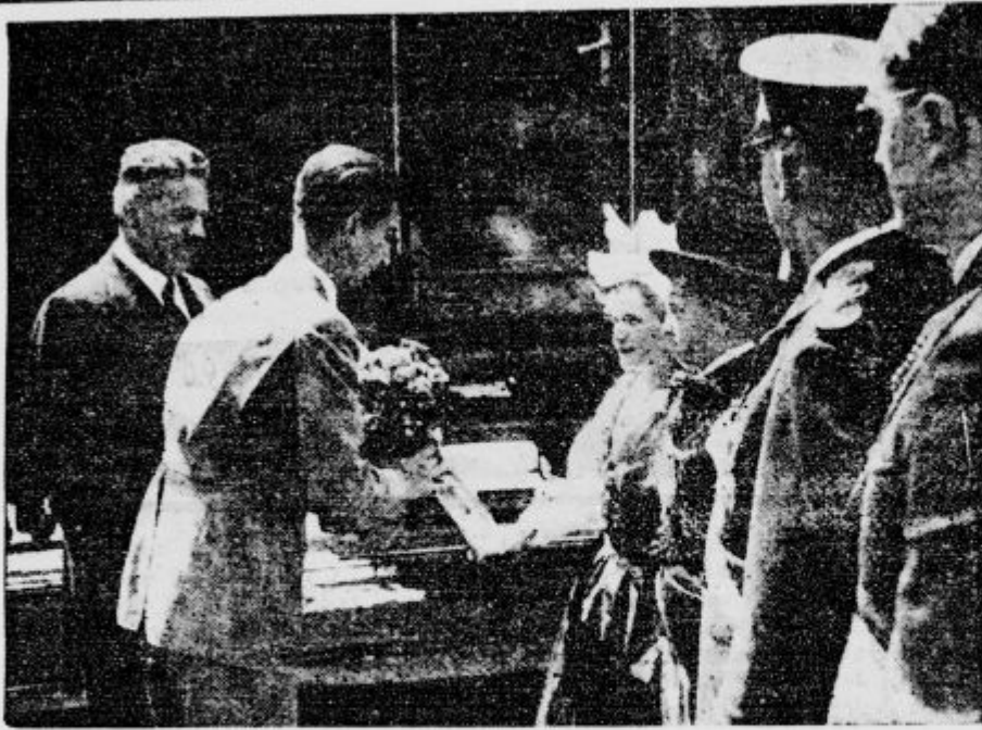
Prejšnji petek se je pripeljal na oddih na Bled Nj. Vel. kralj Peter. Lep sprejem so mu pripravili na kolodvoru v Leseah, kjer ga je obsula mladina s cvetjem.