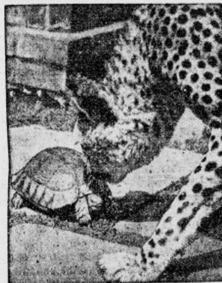
Udomačeni panter — prijatelj želve