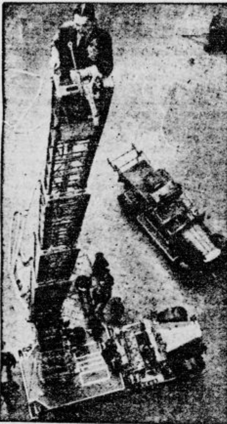
Angleški radio napovedovalec na najdaljši gasilski lestvi v Londonu govori poslušalcem o svojih vtisih