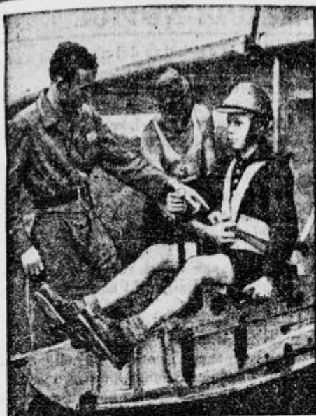
Prvi pouk v jadralnem letalstvu. Mladi pilot se zelo imenitno drži.