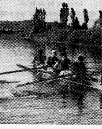
Prvenstvo Slovenije v veslanju