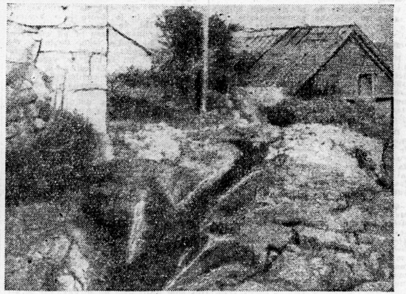
Tako razrita je vas Obrov že od meseca januarja leta

stij, ki bi jih zahtevala napeljava smrtno speljanega vodovoda v brkinske vasi, se ne bo mogoče dati jutri. Te stvari mora rešiti v izredno nujnih primerih vsaj začasno le delavna vaska skupnost. Brez velikih stroškov bi se dale marsikje zgraditi večje cisterne ter karpnice in električni motor bi lahko v marsikateri vasi že v kratkem poagal vodo tja, ker bi bila vsem najbolj pri roki.