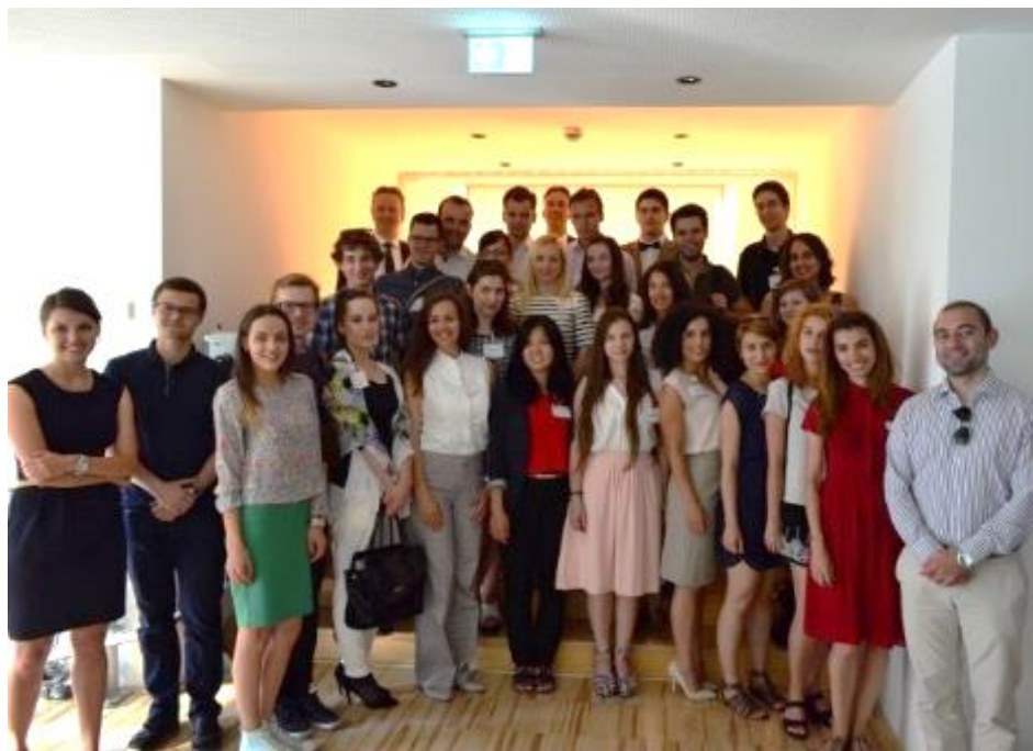
Slika: Udeleženci poletne šole na sprejemu v podjetju LeinterLeitner

Skupaj z drugimi študenti, pretežno iz držav vzhodne in južne Evrope, asistenti dunajske fakultete s področja ekonomskih in poslovnih ved ter prava, smo poslušali predavanja in imeli priložnost med seboj izmenjati izkušnje na področju študija, navezati nove karijerne stike, ki jih bomo lahko izkoristil v prihodnosti. Na poletni šoli so nam predavali priznani profesorji Dunajske ekonomske univerze. Predstavili so nam strukturo, uporabo in interpretacijo sporazumov o izogibanju dvojnega obdavčenja, uporabo OECD modela, davčno obravnavo dividend, licenčnin in obresti v sporazumih ter druga številna zanimiva področja, med njimi davčno problematiko transfernih cen in evropsko pravno zakonodajo (direktive) iz obravnavanih področji.