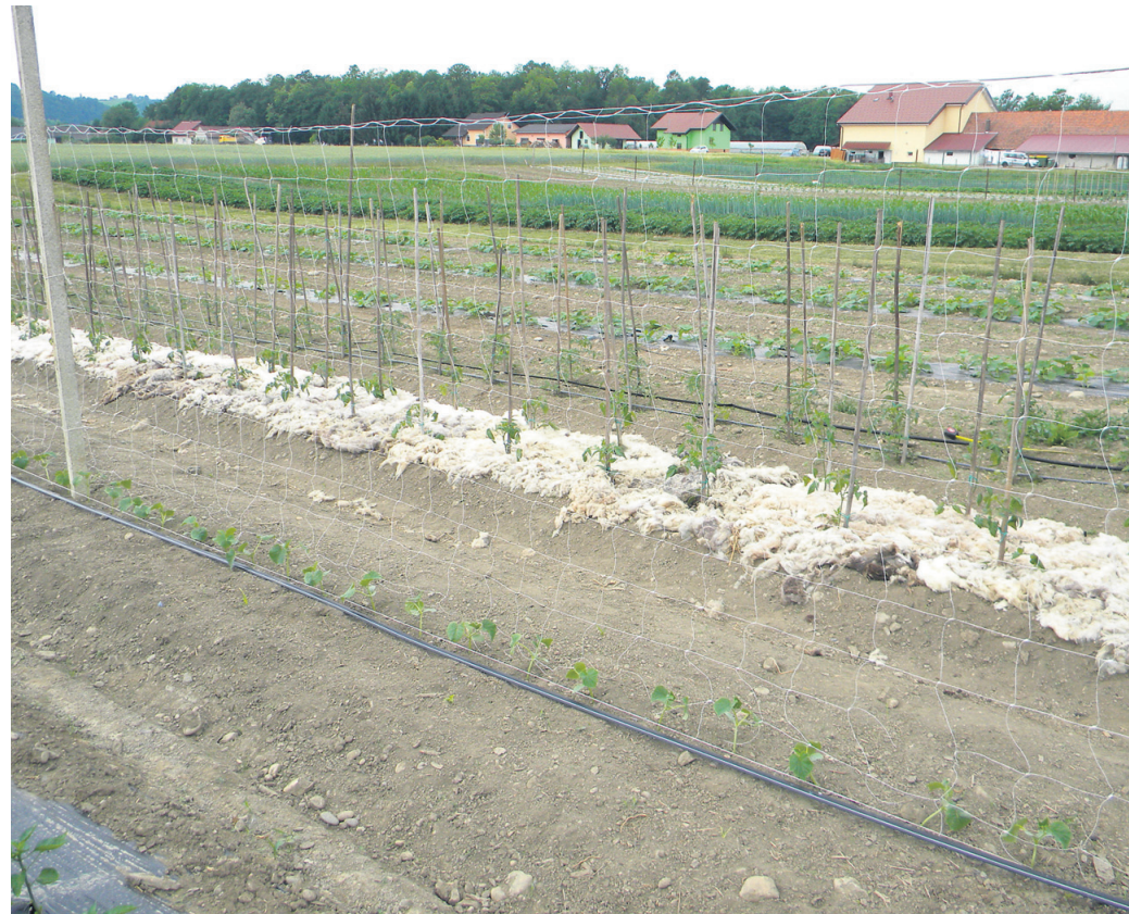
Zmagovalka med zastirkami je ovčja volna.

Solata pa letos res lepo uspeva. Zato jo posadite na vsako izpraznjeno mesto na vrtu. Sama sem pristaš presajanja sadik, ne direktne setve, saj lahko edino tako pridelujete v vsakem letnem času le toliko solate, kolikor je lahko sproti pojedete. Vzgoja sadik solate je od aprila naprej povsem enostavna. Mnogi se sicer odločate za gosto setev, iz katere potem izpuljene sadike presadite drugam. Sama sem prepričana, da so sadike s koreninsko grudo veliko boljše rešitev. Lončke, v katerih ste kupili prve sadike spomladi, ste, upam, shranili. Po možnosti jih sperite z vodo, ni pa nujno. Za vzgojo sadik vedno uporabljamo substrat, kupljeno zemljo, ne pa vrtno zemljo. Slednja se namreč preveč zbija in vzgojene sadike ne bodo kakovostne. Lončke napolnite z zemljo povsem do vrha, rahlo potlačite in še dodajte potrebno zemljo. Če bodo lončki premalo napolnjeni, boste pridelali sadike s predolgim stebлом, te pa so spet bolj nagnjene k uhajanju v cvet.