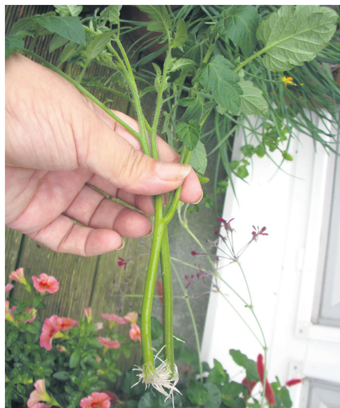
Zalistniki paradižnika v vodi po enem tednu

Vzemite kos papirja formata A5, ki naj bo enobarven. Na ta papir nasujte seme solate (endivije, radiča). Papir zvijete v lijak, ki ga približate lončkom z zemljo. S svinčnikom ali čim podobnim v vsak lonček porinite eno (ali dve) semenki. Seme samo s prstom potisnite v zemljo, zalijte in postavite na toplo za pet dni. V rastlinjaku je za vzgojo sadik solate že pretoplo. Trenutno so najprimernejša sončna mesta, kaj kmalu pa boste sadike bolje in lažje pridelali pod balkonom. To je vse. V štirih tednih je sadika primerna za presajanje na prosto. Seveda lahko tako posejete tudi zelje, kolerabico in še katero vrtnino. Naj pa vseeno pripomnim, da je zdaj za setev cvetače in brokolija skoraj prepozno. Te sadike bodo rodile sredi največje vročine in pridelek ne bo kakovosten. Vsekakor pa je zdaj čas za setev brstičnega in listnatega ohrovt.